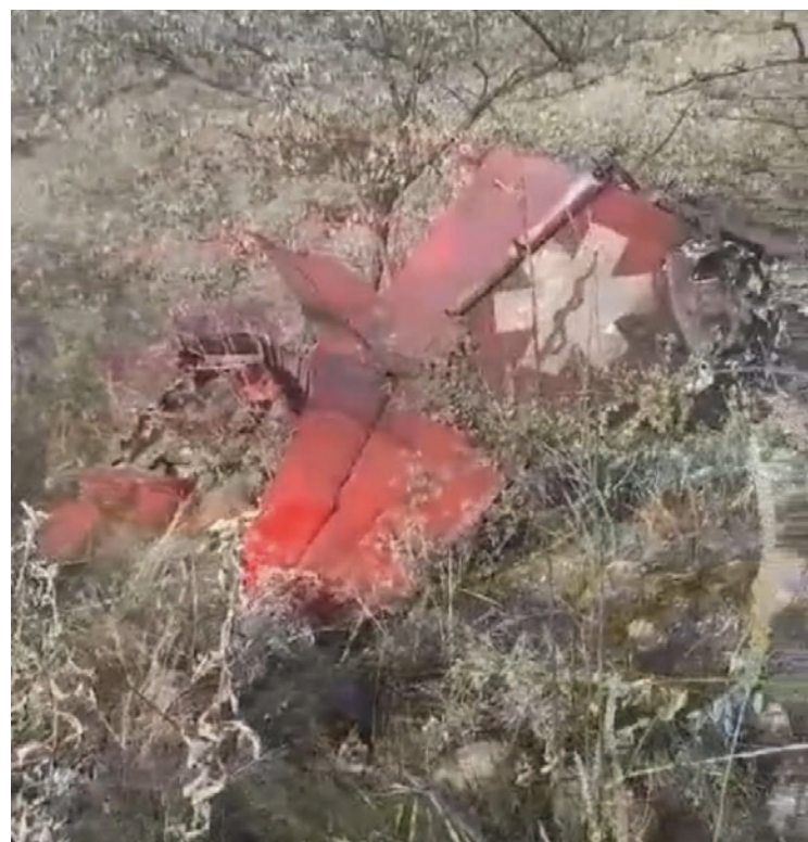
▲ Dos víctimas fatales en el desplome de la ambulancia aérea de la empresa Jet Rescue.