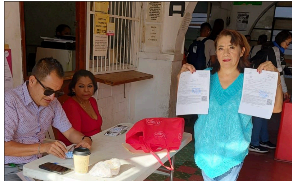
▲ Durante la campaña se aplicará un descuento del 16 por ciento en el impuesto predial.

Los contribuyentes podrán efectuar el pago del impuesto predial en las cajas