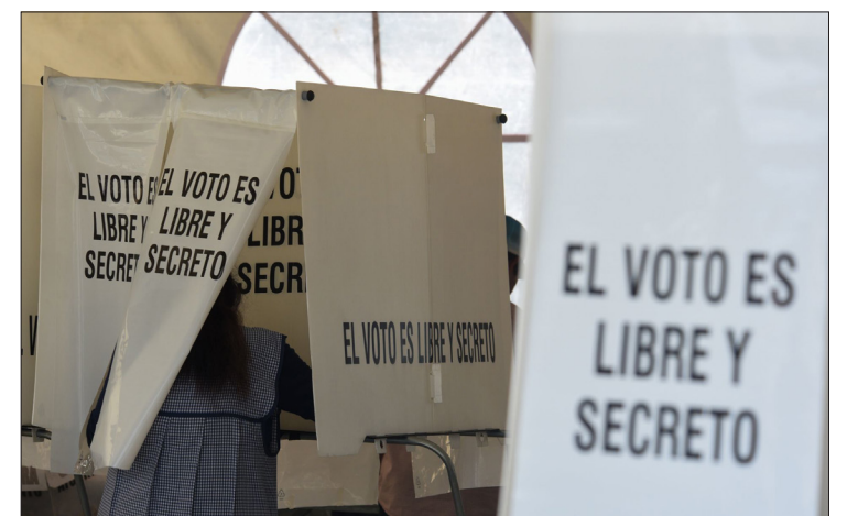
▲ La premisa institucional es construir condiciones para que el voto sea emitido en libertad el 2 de junio de 2024, aseguró el INE.