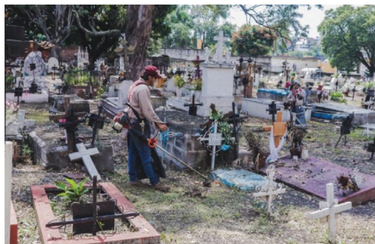
▲ Algunas sepulturas han permanecido abandonadas hasta 30 años.

"Hemos intentado contactar a las familias a través de registros, llamadas telefónicas, visitas, y correos electrónicos, pero hasta el momento no hemos obtenido respuesta", agregó Cotero Camacho.