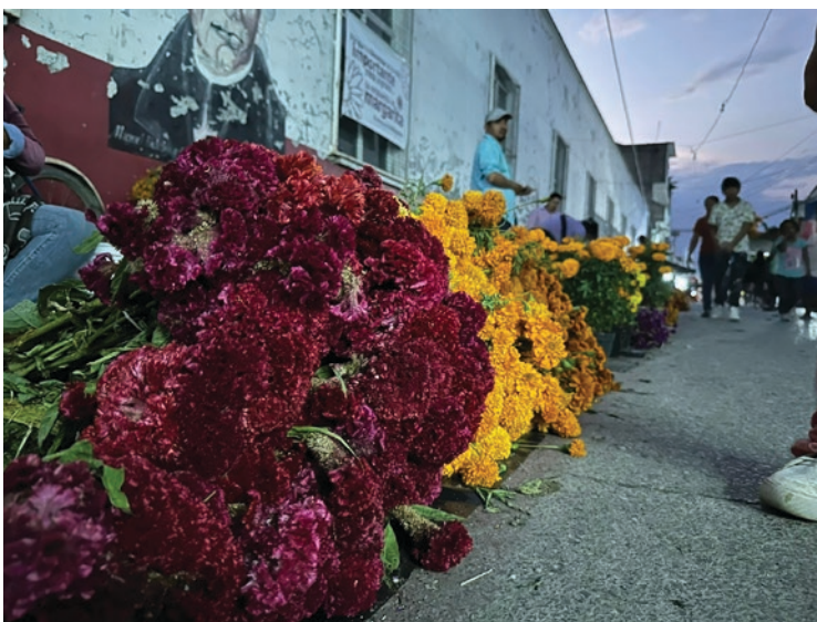
▲ En Jojutla la venta de artículos tradicionales del Día de Muertos comienza a repuntar.

Finalmente, se hace una invitación a la ciudadanía para que visite este mercado de tradiciones que permanecerá abierto hasta el jueves en el centro de Jojutla.