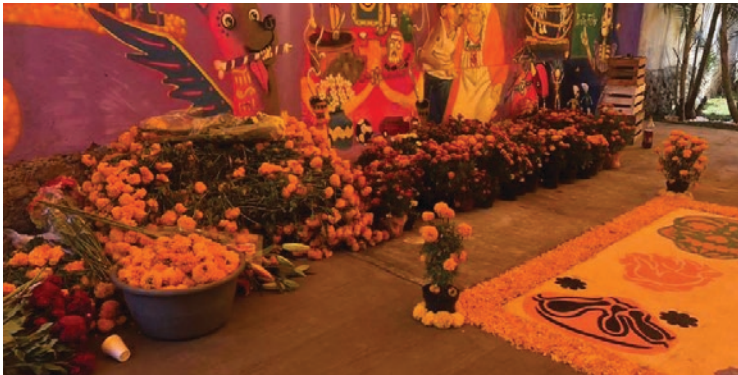
▲ Las ofrendas en Ocoteppec atraen cada vez más visitantes.

Cabe destacar que el 2 de noviembre, el Día de los Fieles Difuntos, es la celebración más grande. En este día, las velas llevadas por los visitantes se llevan al panteón y se queman en la tumba del difunto.