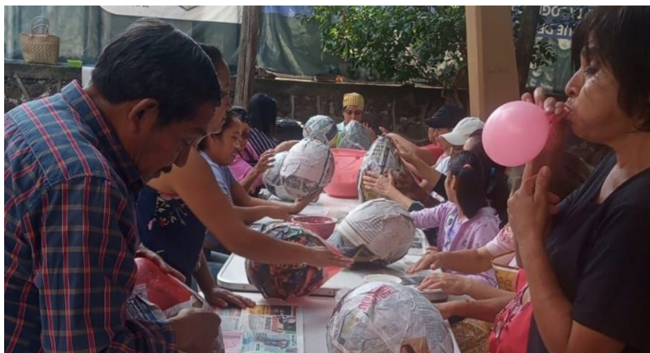
▲ El próximo lunes, 6 de noviembre, continúa el taller de elaboración de piñatas, el cual se ofrece de forma gratuita en las instalaciones de la Instancia de la Mujer.