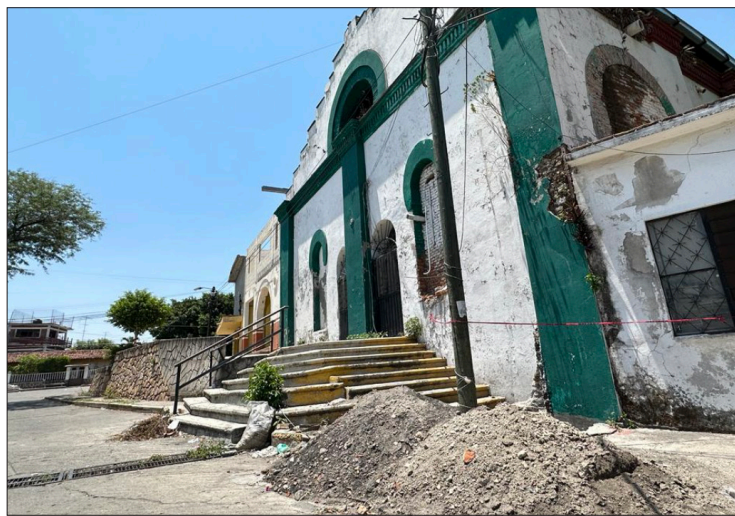
▲ La Secretaría de Desarrollo Agrario, Territorial y Urbano, anunció que las obras del mercado de Zacatepec concluirán en el primer trimestre del próximo año.

Sin embargo, es información que los comerciantes ya sabían, recor-