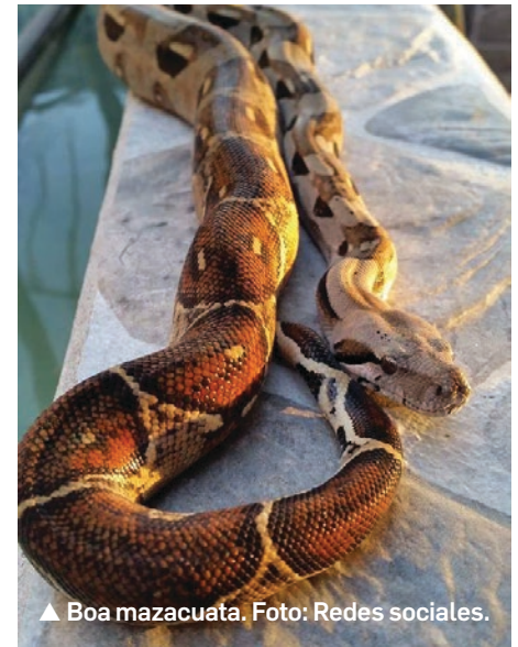
▲ Boa mazacuata.

En fin, en el 2006, regresábamos de Saltillo con un grupo de amigos de la escuela de Emiliano y en la autopista atropellé sin querer a