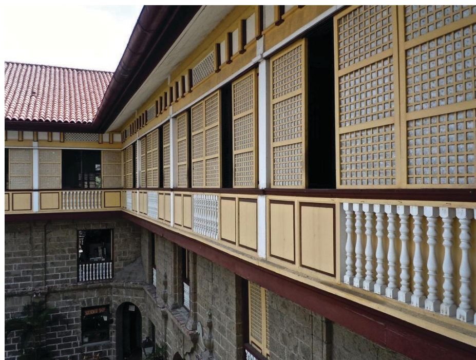
▲ Vivienda de Manila, Filipinas.

La planta baja se construye con muros de mampostería y la del segundo nivel de madera, se utilizan conchas laminadas capiz , para regular la entrada de luz y radiación solar, y las cubiertas a dos aguas de madera con palma para garantizar una mejor condición climática en las estancias del hábitat de la casa.