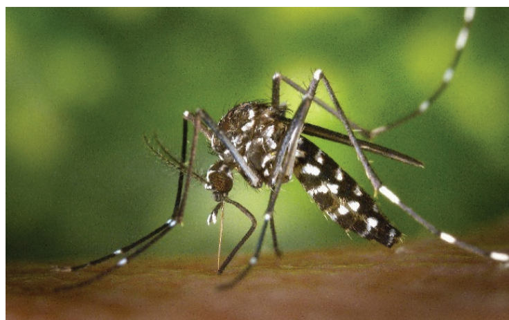
▲ A la fecha, 816 casos de dengue en Morelos se consideran no graves, mientras que dos mil 334 presentan signos de alarma o son casos graves y ya se han registrado 19 defunciones.

En este contexto, se ha enfatizado la necesidad de lavar con jabón y cepillo piletas, floreros y estanques, tapar tinacos y cisternas, voltear botes, tinas y cubetas, y desechar llantas, latas y utensilios en desuso que puedan acumular agua.