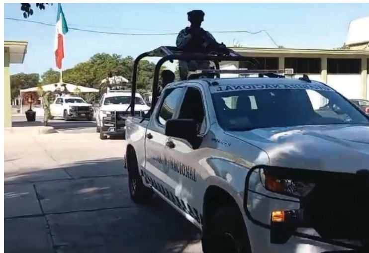
▲ La seguridad en Cuautla se reforzará con 150 efectivos adicionales.

El pasado 21 de octubre, más de 500 elementos llegaron al estado de Morelos para combatir los delitos de alto impacto en la entidad. Sin embargo, algunos días después, los agentes federales fueron trasladados al Estado de Guerrero para colaborar en las labores de recuperación tras los desastres provocados por el huracán Otis en el municipio de Acapulco.