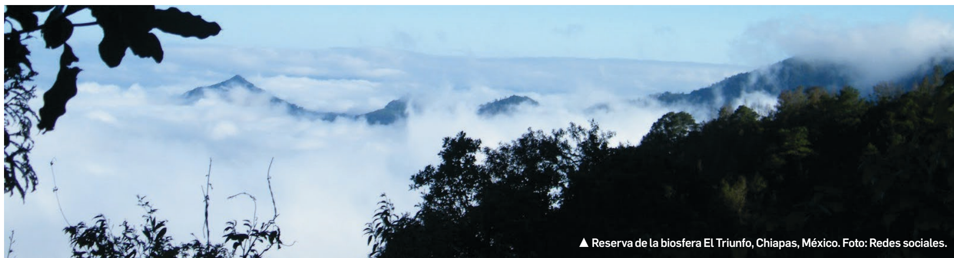
▲ Reserva de la biosfera El Triunfo, Chiapas, México.

Desde entonces me he esmerado en impulsar aún más la caficultura de conservación frente a la caficultura de extracción; desde entonces el perfil de sabor de mi taza de café no es tan importante como su limpieza ecológica y ambiental. Claro que disfruto el buen café, pero aún más que provenga de orígenes y fincas que cuidan el suelo, el agua, la flora, la fauna, y en última instancia el clima mundial. Porque eso es lo que está en juego cada vez que tomamos una taza de café.