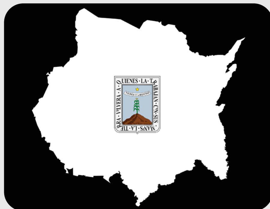
▲ Imagen: Creative Commons Attribution-Share Alike 3.0 / commons.wikimedia.org.

El anuncio del torpe secretario de Gobierno acerca de que emigrará la delincuencia de Acapulco es una burla a los morelenses, sería mejor que nos dijera qué están haciendo para impedirlo o para detener a los delincuentes que se pasean y realizan los crímenes por todo el estado a plena luz del día con la mano en la cintura. Las advertencias no son importantes ¿porque qué podemos hacer los ciudadanos que vivimos encerrados y con cámaras, cercas electrificadas y alarmas, desde ya hace un buen tiempo?, o no quieren que salgamos, ni a comprar lo que necesitamos; la prevención del delito es su obligación que les marca la Constitución. La verdad es que no sé qué hacen en una posición política, si no le ponen remedio a las cosas y hacen puros avisos y nada de resultados. ¿No cree usted?