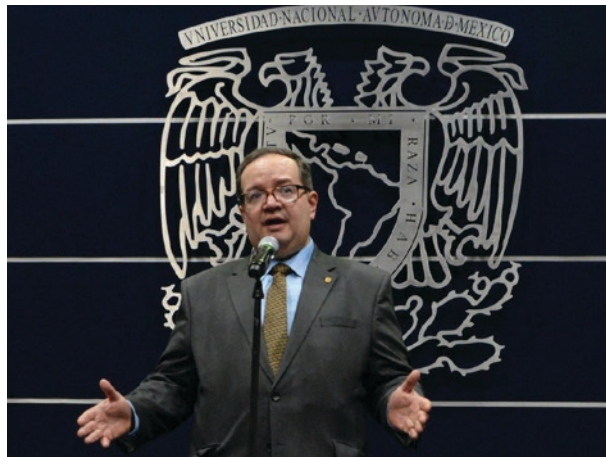
▲ Leonardo Lomelí, nuevo rector de la UNAM.

Este proceso se inició el día 21 de agosto con la convocatoria que este órgano colegiado emitió ya que concluye la gestión de nuestro actual Rector, el doctor Enrique Graue, quien encabezó durante dos periodos de 4 años a la máxima casa de estudios,