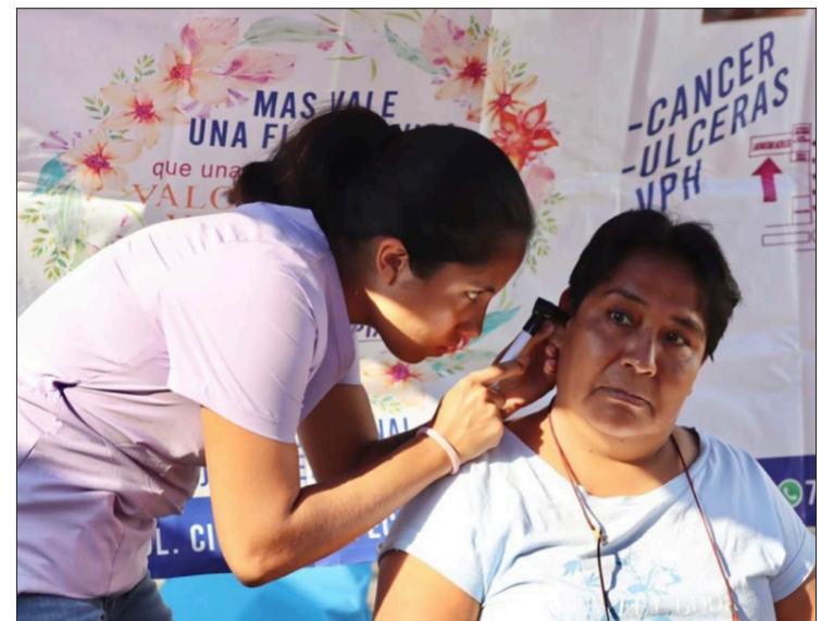
▲ DIF Jiutepec ofrece servicios de nutrición.