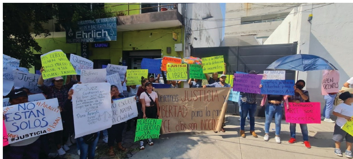
▲ Familiares y amigos de los detenidos aseguran que éstos no fueron arrestados en donde dice la policía, que les "sembraron" droga y que los amenazaron para no desmentir la versión oficial.

"Eso que está pasando es una injusticia, ellos no son culpables, son inocentes. Los sacaron de su casa injustamente, todos sabemos que son trabajadores, incluso, están poniendo evidencia falsa. Todo lo que están diciendo son mentiras... los están acusando por armas y droga, pero ni consumen droga, ni andan en esos pasos... los amenazaron para que no dijeran que entraron por ellos a su casa", comentó una familiar.