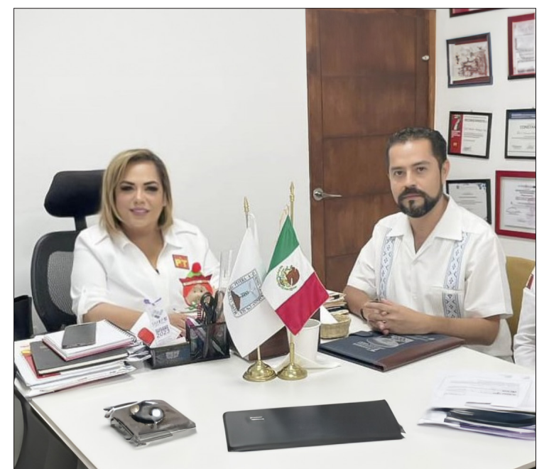
▲ La diputada Tania Valentina siempre ha demostrado su compromiso con la preservación de la historia y la cultura morelense.