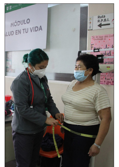
▲ También aumentaron los casos de diabetes tipo 2.

El entrevistado enfatizó que adoptar hábitos saludables, como una alimentación adecuada, la práctica de actividad física, la adherencia al tratamiento farmacológico, el seguimiento continuo con el médico y el apoyo para gestionar hábitos y emociones, son fundamentales para reducir las complicaciones asociadas con la diabetes.