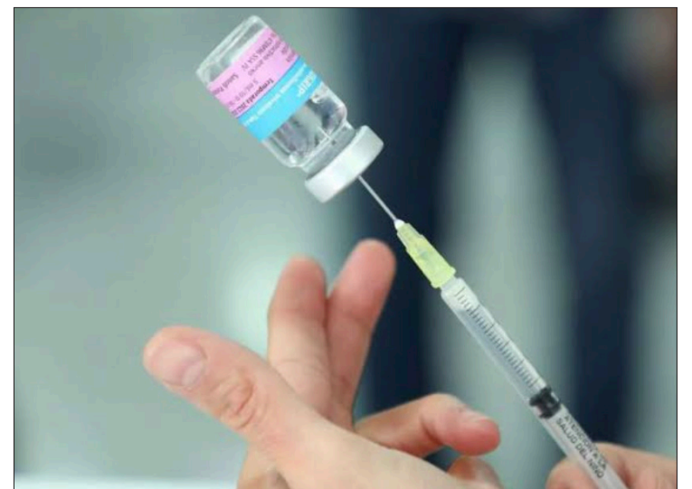
▲ la vacunación dirigida a menores de cinco años, adultos mayores de 75 años y más, embarazadas y personas con comorbilidades ha comenzado en el IMSS e ISSSTE.

El llamado también se ha extendido a madres y padres de familia o tutores legales de menores de cero a cinco años para llevar a sus hijos a vacunarse contra la influenza, lo que disminuye significativamente el riesgo de hospitalización y enfermedades respiratorias durante esta temporada invernal.