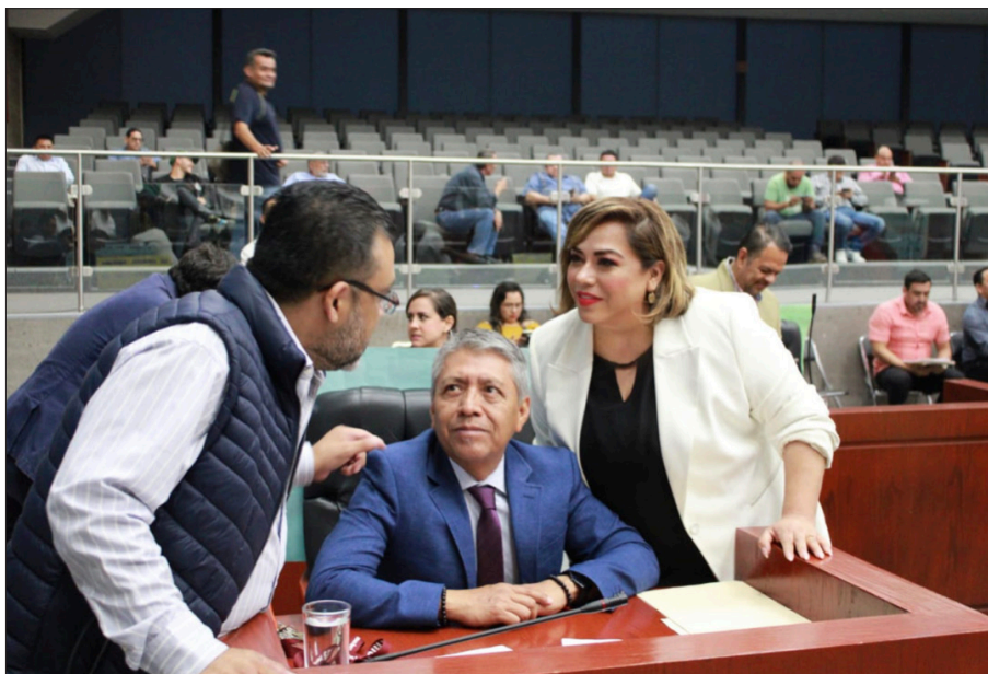
◀ La diputada promovió descuentos para el pago anticipado del Impuesto Predial y Servicios Municipales.