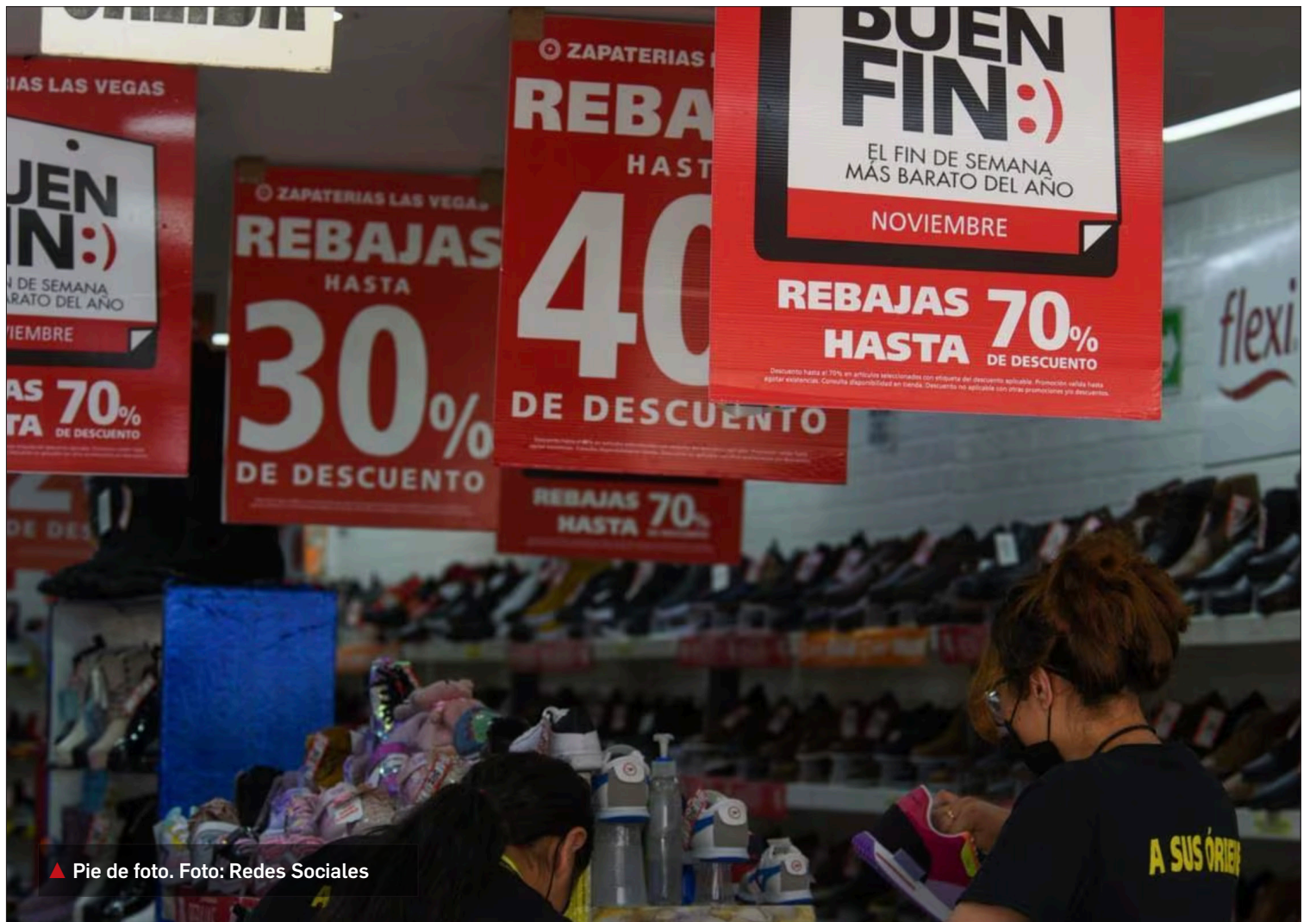
▲ Pie de foto.