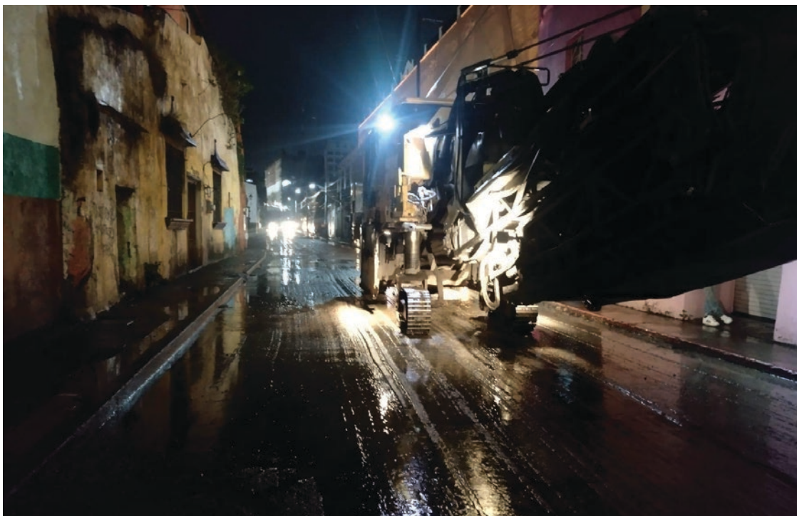
▲ Las vialidades intervenidas con pavimento asfáltico son Hermenegildo Galeana, Vicente Guerrero, Carlos Cuaglia y Boulevard Adolfo López Mateos, Santos Degollado y la calle General Francisco Leyva de Motolinía a Himno Nacional.