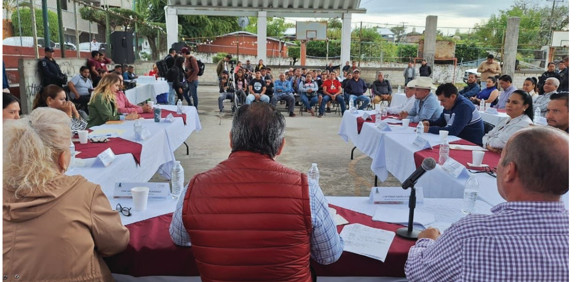
▲ El edil se comprometió a llevar a cabo una jornada comunitaria de embellecimiento durante el mes de diciembre de este año.