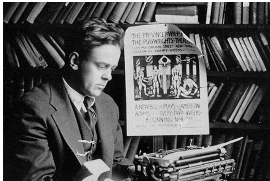
▲ John Reed, autor de "México Insurgente" y de "Los 10 días de conmovieron al mundo".