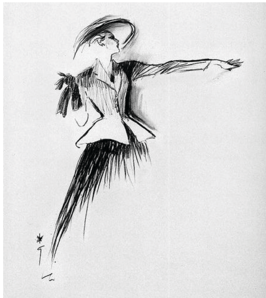
▲ Dibujo por Rene Gruau sobre la silueta del New Look de Christian Dior.

¡Buenos días, buenas tardes, buenas noches y hasta la próxima!