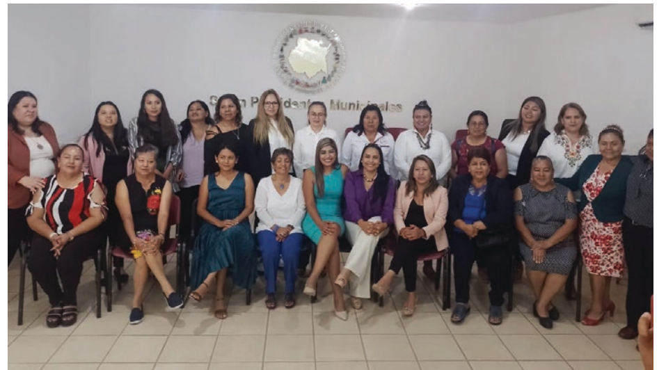
▲ "Foro comparte tu experiencia como mujer integrante de los primeros cabildos conformadas con perspectiva de género e intercultural" se convirtió en una luz de esperanza.

Con el proceso electoral 2023-2024 a la vuelta de la esquina, en ese evento se propuso la necesidad de hacer una reunión presencial para dar continuidad a los acuerdos y mantener la comunicación. A todas se les notaba contentas y sonrientes. Con aplausos despidieron la sesión grupal y se tomaron una fotografía para recordar que no están solas y se podrán acompañar.