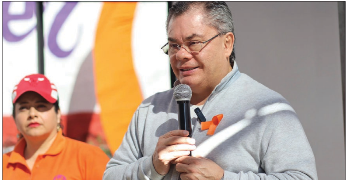
▲ El presidente municipal de Jiutepec solicitó a las personas usuarias de la Instancia de la Mujer ser portavoces para difundir los servicios gratuitos que ofrece la Dependencia municipal.