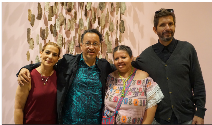
▲ Treinta artistas morelenses contemporáneos exhiben una muestra provocativa al arte, y a los nutriólogos del mundo.