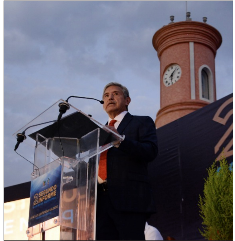
▲ El edil de Cuernavaca reprochó el abandono en que ha dejado el gobierno estatal a la capital morelense.

Gracias a la disciplina financiera, aseguró el alcalde, se ha podido invertir en seguridad pública, 47 mi-