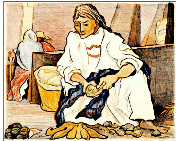
▲ "El mercado (Cuautla, estado de Morelos)", Pablo O' Higgins.

Entre muchas cosas, ese documento deberá rediseñar la institución que será la cabeza de sector que rearticule el CEMA, el MMAPO, el Centro Cultural Infantil La Vecindad, el Auditorio Teopanzolco, los museos estatales, independientes-comunitarios y privados, la Escuela de Escritores Ricardo Garibay, y sus relaciones intersectoriales e interseccionales con instituciones como la Facultad de Artes y la Secretaría de Extensión, pero también con toda la UAEM, el INAH