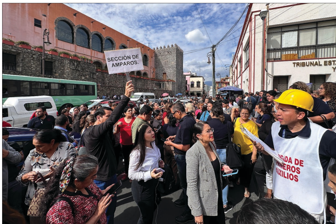
▲ El temblor de 5.7 grados con epicentro muy cerca de la frontera entre Morelos y Puebla provocó, además de crisis nerviosas, daños ligeros en edificios públicos del estado.

Durante el sismo, decenas de miles de morelenses fueron evacuados de los sitios donde estaban.