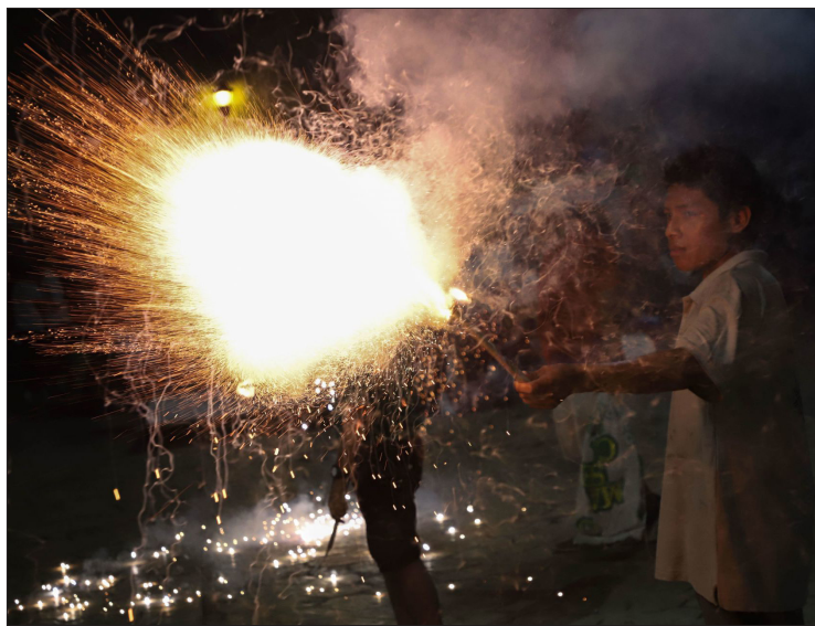
▲ Aunque hay muchas razones de seguridad y civismo para evitar los cohetes en cualquier época, si estás decidido, sólo en dos municipios hay puntos autorizados para venderlos..

“Si hay alguna queja por parte de la ciudadanía puede levantar su queja ante Licencias Federales para que a su vez con la Sedena se realicen operativos. Los menores de edad no pueden usar pirotecnia bajo ninguna circunstancia y jóvenes supervisados por adultos. Nunca los lleven en bolsas de plástico o en los pantalones o mochilas. Siempre deben de ir en bolsas de papel o cajas de cartón para transportarlos de