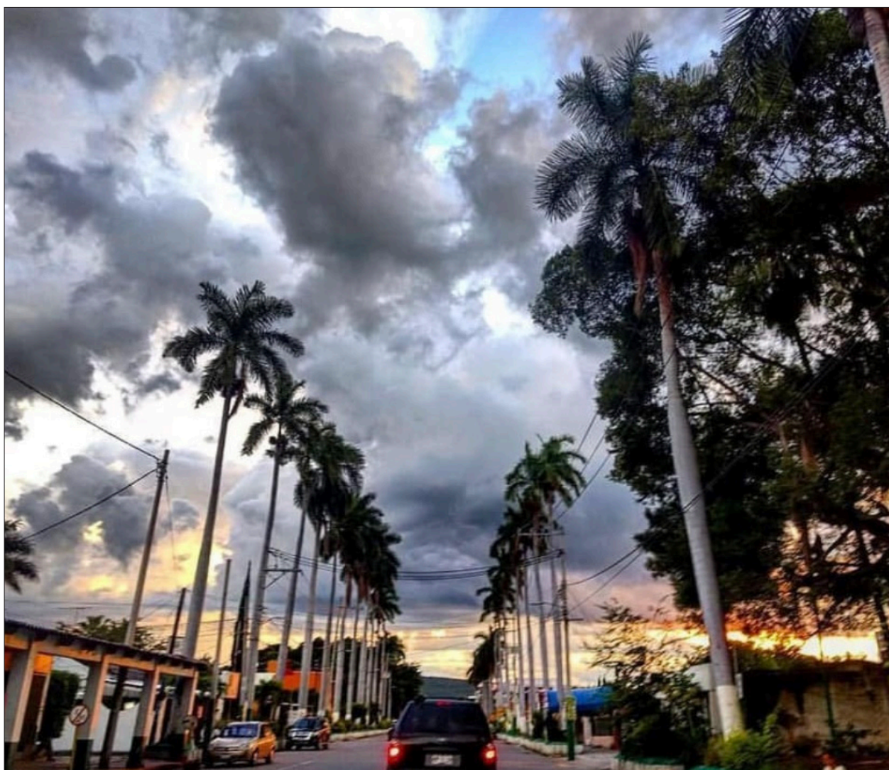
▲ Un atardecer de 2017, un poco antes del sismo, aún estaban en pie las oficinas de la gerencia.

La Avenida Central, aunque solo se extiende por cuatro cuadras, nada le pide en atractivo a la famosa Sunset Boulevard de Beverly Hills, la kilométrica y opulenta avenida californiana.