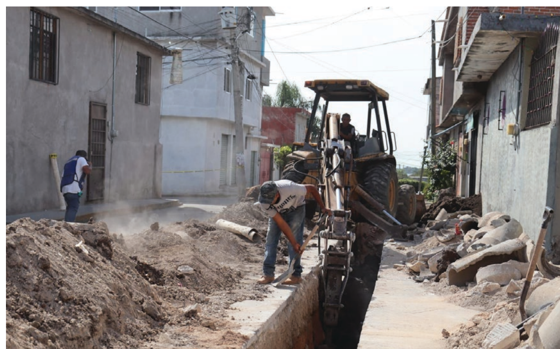
▲ Entre las acciones que se realizan está la nivelación con equipo topográfico, excavación, retiro de materiales, suministro e instalación de 150 metros lineales de tubería, con una inversión de 750 mil pesos.