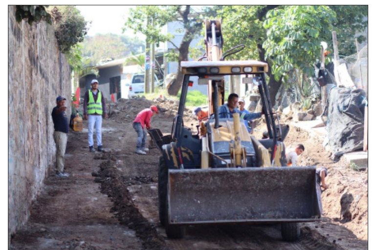
▲ En las obras de infraestructura social el gobierno de Jiutepec invierte cinco millones 757 mil 199 pesos.

Por último, informó que debido al daño que provocó en las oficinas de la CDHM el sismo del jueves pasado, hasta nuevo aviso la atención presencial fue suspendida, por lo que la ciudadanía podrá recurrir a sus servicios de manera virtual.