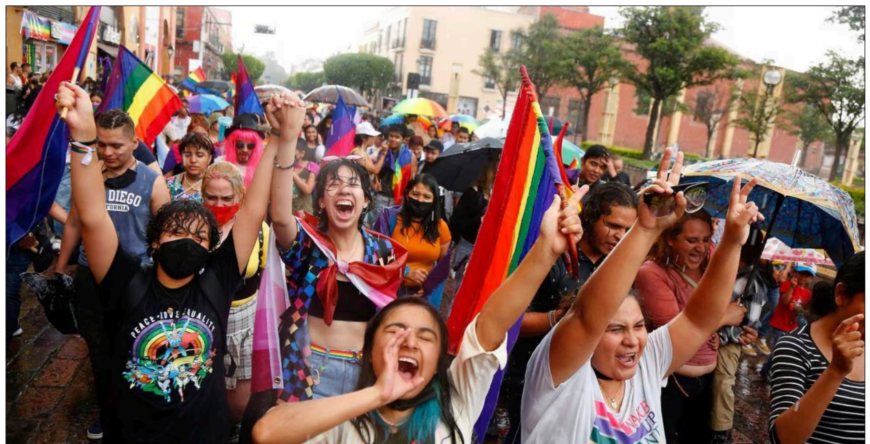
▲ Fue el resultado de todo un proceso social poder salir a la calle año con año para gritar que siempre hemos existido.

No debemos olvidar que para llegar hasta aquí, ha sido todo un proceso, toda una revolución de colores, una lucha incansable por parte de la comunidad LGBT+ para poder disfrutar la vida y poder ser libres, para que sean reconocidos nuestros derechos