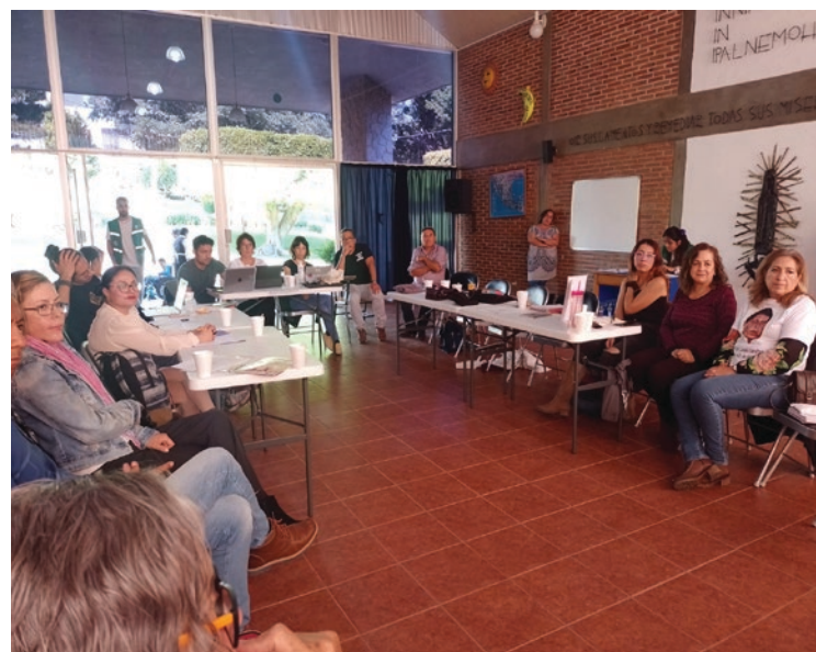
▲ Dentro de los principales hallazgos obtenidos por la Misión Internacional de Observación fue que en Morelos, como en Chiapas, se evidencian los efectos perniciosos de empresas mineras y megaproyectos.

Ante la compleja realidad observada, las organizaciones que conforman la Misión Internacional de Observación de Derechos Humanos en México hacen un llamado urgente a las instancias gubernamentales. Piden acciones coordinadas a nivel estatal y federal para fortalecer las instituciones clave, garantizar el derecho a defender derechos humanos y proteger a quienes han sido privados de su libertad, respetando los estándares internacionales en materia de derechos humanos.