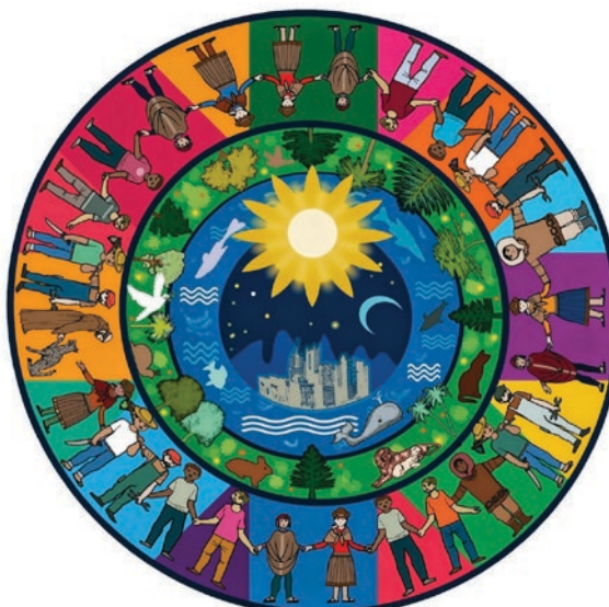
▲ Imagen: http://demosaber.blogspot.com/

*Licenciado en comunicación y Maestro en Sistemas Políticos Complejos