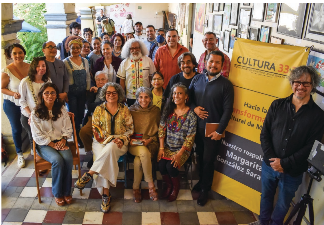
▲ Con apoyo de la UAEM, el movimiento realizará foros de consulta y análisis en los 36 municipios para socializar el instrumento que garantizará a las y los morelenses el ejercicio de sus derechos culturales. También se solicitará al Ejecutivo la pronta publicación de la Ley de Cultura y Derechos Culturales para el Estado de Morelos.

Al evento, realizado la Cafetería Resiliente de la Ciudad de Cuernavaca, acudieron representantes de los medios de comunicación e integrantes del sector cultural de diversos municipios de Morelos.