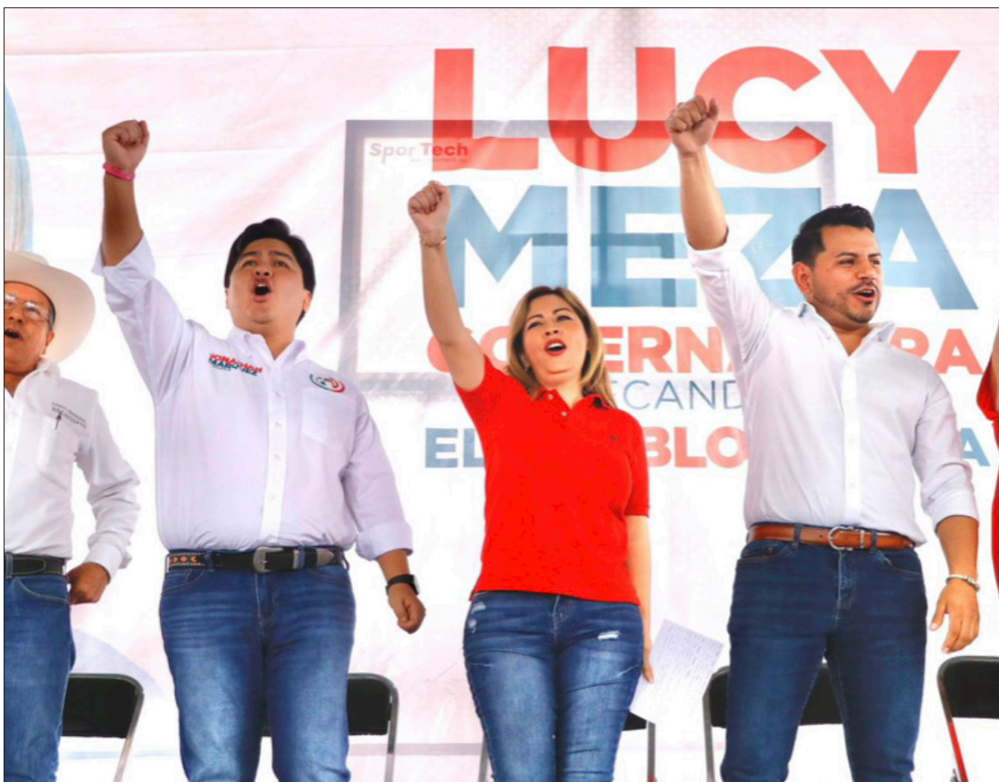
▲ Aumenta el respaldo social en favor de la precandidata a la gubernatura de Morelos.