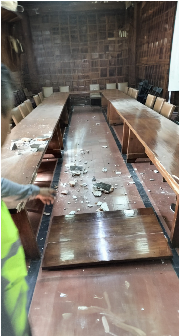
▲ Los daños fueron afectaciones en algunas oficinas, fisuras en la cúpula y bordes del edificio principal. Afectaciones mucho menores que las que dejó el terremoto del 2017, que aún no terminan de repararse.

Enfatizando la conexión con líderes nacionales, concluyó: "Nosotros vamos con la doctora Claudia Sheinbaum, con el presidente Andrés Manuel López Obrador, y también vamos, por supuesto, aquí en Morelos, a este proceso en la cuarta transformación de México".