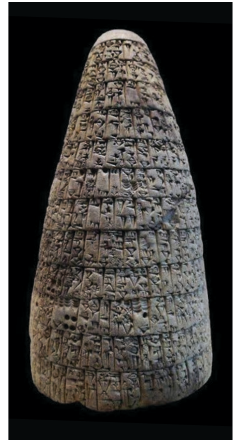
▲ Código de Urukina.

Esta cruda realidad, ¿implica acaso que debe desaparecer la ONU? Creo que no. Lo que sí es que hace evidente la necesidad de hacer cambios sustantivos en lo que se refiere a sus formas de diagnosticar y deliberar sobre los problemas nacionales e internacionales, así como en la forma de tomar las decisiones colegiadas. Dicho de otra forma, debe democratizarse, para concederle todo el poder a la Asamblea General, y crear órganos ejecutivos dedicados exclusivamente a ejecutar lo que les mandaten, sin posibilidad de veto. Reto mayor en esta propuesta de reconfigurar a la ONU es la de fijar claros criterios que permitan discernir entre los derechos y obligaciones de los gobiernos, y los derechos y obligaciones de los pueblos, los cuales deberían coincidir, pero sabemos que no siempre es así.