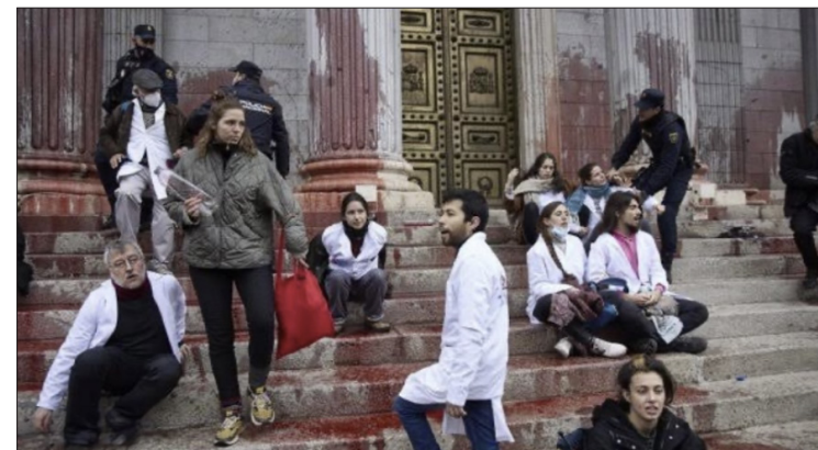
▲ Palacio de las Cortes en Madrid. 6 de abril de 2022.