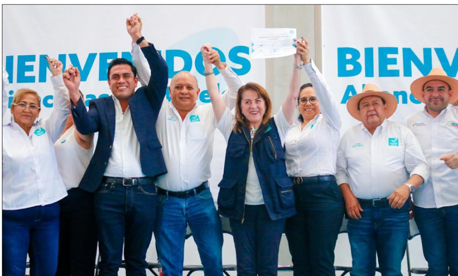
▲ La dirigencia y liderazgos del Partido Nueva Alianza levantó los brazos a su precandidata a la gubernatura.