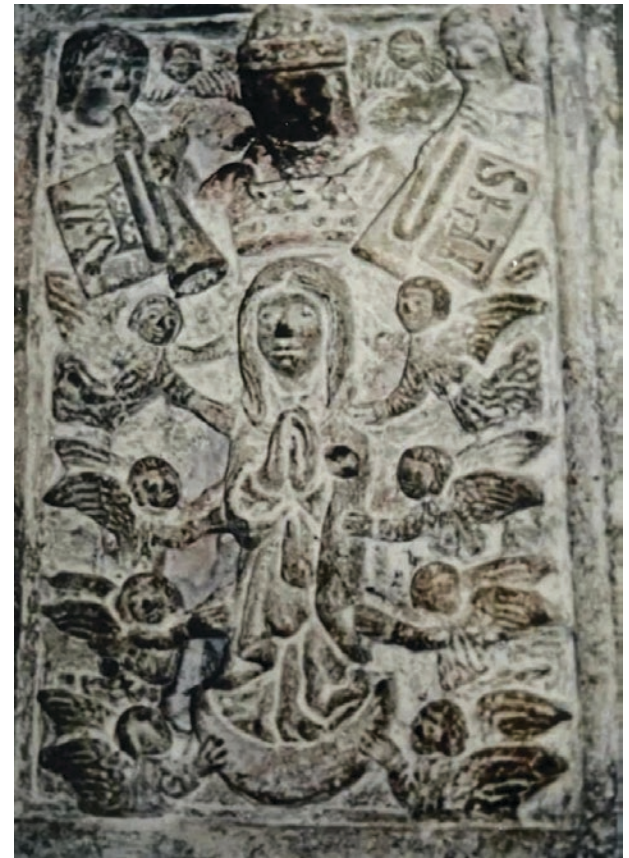
▲ Relieve Guadalupano de la Catedral de Cuernavaca, archivo de RAC.

La causa guadalupana tampoco se puede entender sin el sincretismo que acompañó la evangelización en la Nueva España, y los conventos morelenses no fueron la excepción. En 1959 Don Sergio Méndez Arceo promovió una draconiana interpretación del Concilio Vaticano Segundo, esto origino que, con su proyecto de remodelación, la catedral de Cuernavaca sufriera un atentado en su patrimonio histórico y artístico, algo que ni siquiera doscientos años de guerras civiles y extranjeras lograron. Afortunadamente en años recientes el patrimonio fue inventariado y rescatado por medio de restauraciones y la creación del Museo de Arte Sacro. En 1959 cuando el altar lateral de la Virgen de Guadalupe fue destruido, encontraron tras la imagen de la virgen morena, empotrada una figura precortesiana de piedra, era la Tonantzin, la deidad que los antiguos mexicanos cariñosamente llamaron "nuestra madre" y que fue adorada precisamente en el Cerro del Tepeyac. Seguramente fue colocada allí como resultado del sincretismo imperante o de la oculta resistencia de los indígenas a abandonar sus antiguas creencias, hoy la talla se encuentra en exhibición en el Museo de Arte Sacro de la Catedral de Cuernavaca.