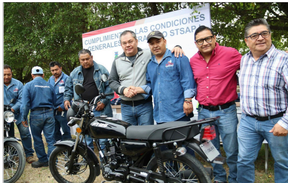
▲ El Ayuntamiento de Jiutepec realizó una inversión de 385 mil pesos para la adquisición del material, herramientas de trabajo y supervisión.