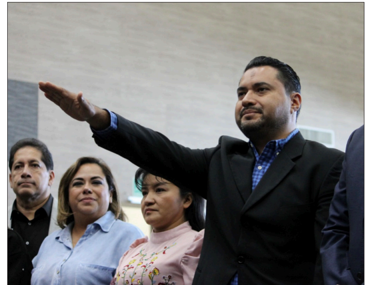
▲ El Congreso aprobó con 17 votos el nombramiento de quien fungía como encargado de ese despacho desde hace casi un año.