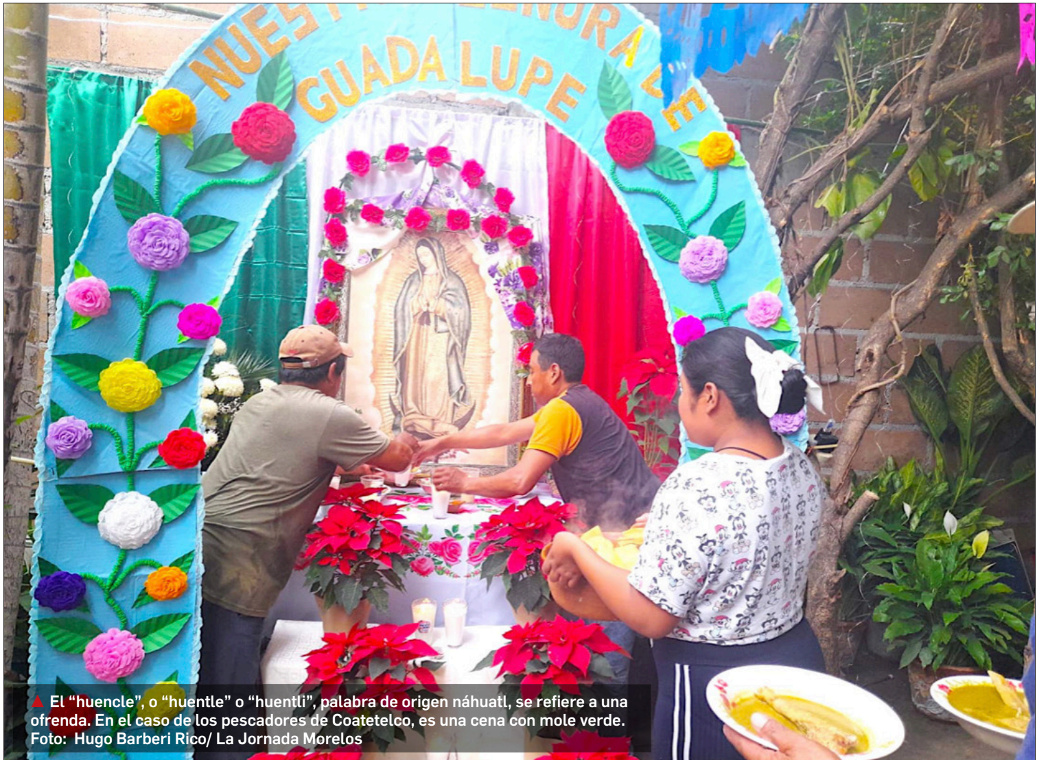
▲ El “huencle”, o “huentle” o “huentli”, palabra de origen náhuatl, se refiere a una ofrenda. En el caso de los pescadores de Coatetelco, es una cena con mole verde.