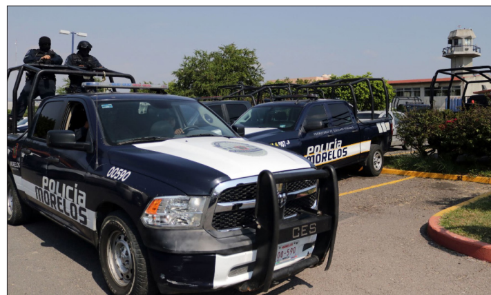
◀ La Comisión Estatal de Seguridad Pública gestiona el envío de 17 policías para apoyar en labores de vigilancia y protección ciudadana a la capital del estado.

La respuesta de la Comisión Estatal de Seguridad Pública llegará dos años después del inicio de la administración de José Luis Urióstegui, que decidió salir de la estrategia de Mando Coordinado policial, y de los primeros llamados del ayuntamiento al gobierno estatal para no abandonar sus tareas de prevención del delito en Cuernavaca.