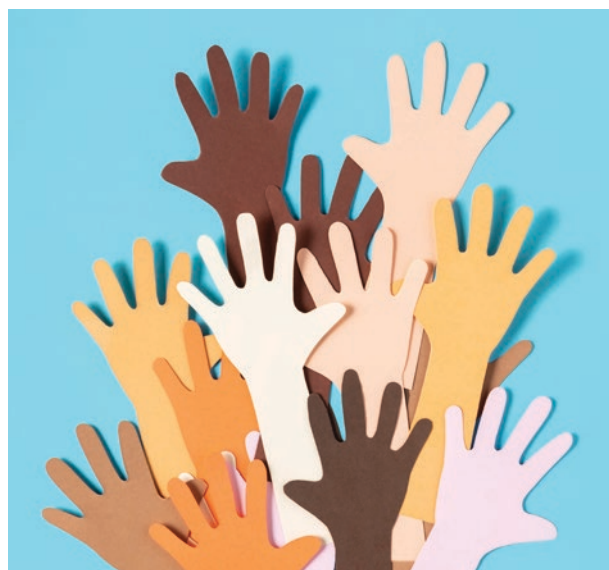
▲ Imagen: freepik.com

Por otro lado, al interior de cada país se viven diferentes problemáticas, respecto a la dignidad, la libertad y el acceso a la justicia y, en general, sobre los derechos humanos pues, por citar lo que nos acontece como país, miles de personas y