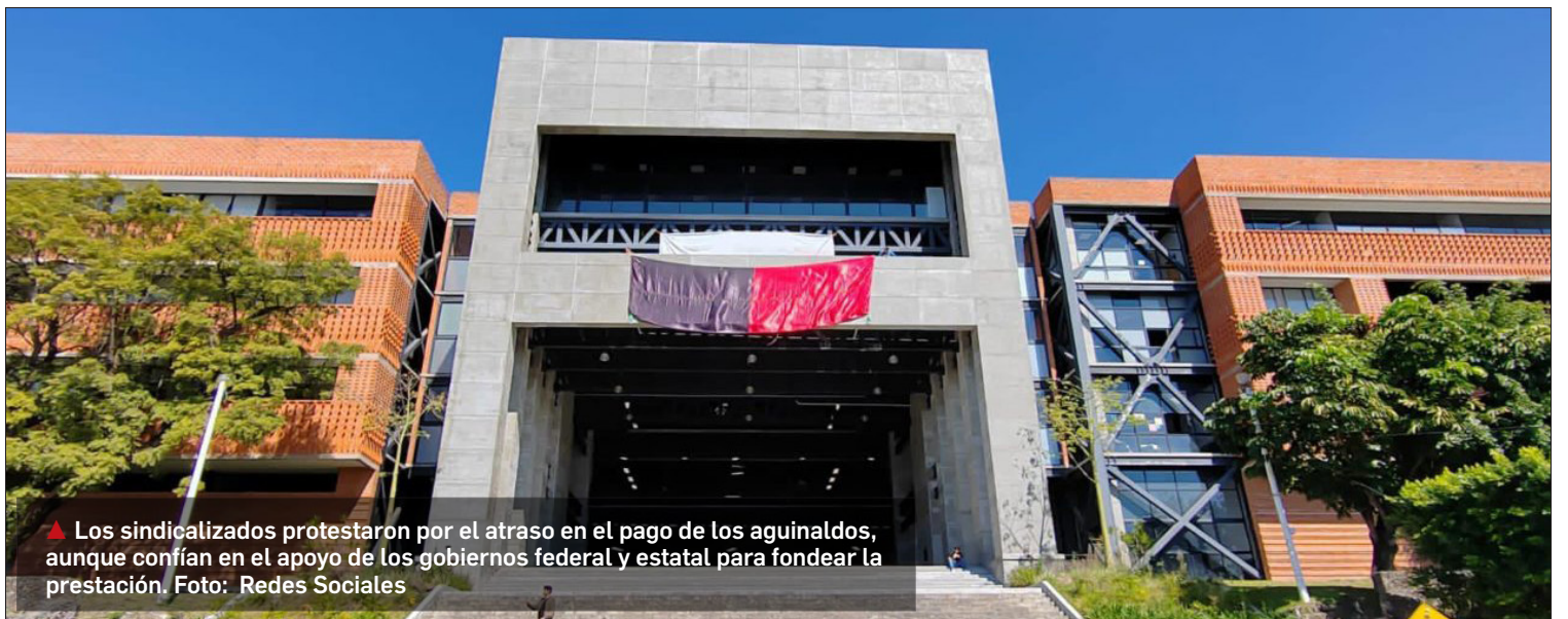
▲ Los sindicalizados protestaron por el atraso en el pago de los aguinaldos, aunque confían en el apoyo de los gobiernos federal y estatal para fondear la prestación.

En este sentido, el entrevistado afirmó que en caso de no tener en breve una respuesta favorable podrían escalar las protestas y este próximo viernes 15 de diciembre realizarían una marcha alrededor de seis mil 500 trabajadores de la Universidad, a fin de hacer visible “la desesperación” ante la falta de cumplimiento del contrato colectivo.