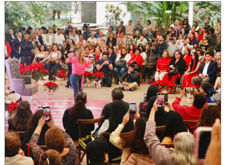
▲ Acompañada de la precandidata de Fuerza y Corazón por México a la presidencia de la República, la aspirante a la gubernatura de Morelos lamentó la violencia intrafamiliar y feminicida por falta de políticas públicas.

Expuso que, si bien se ha avanzado en materia de igualdad salarial, es necesario que los empresarios también asuman el compromiso