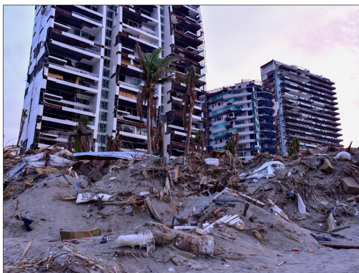
◀ Acapulco tras el paso de Otis.

* Investigador del Programa Universitario de Derechos Humanos de la UNAM. eguardarramal@gmail.com