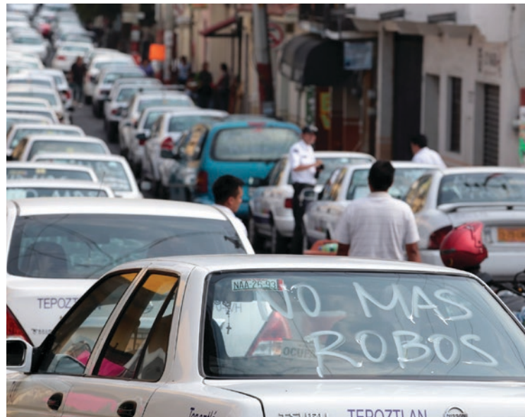
▲ Jardines de eventos, transporte público y tortillerías las víctimas más frecuentes, informó el comisionado Ortiz Guarneros.

De acuerdo con los datos del Secretariado Ejecutivo Nacional de Seguridad Pública (SESNSP), Morelos se encuentra en el octavo lugar a nivel nacional con 7.27 extorsiones por cada 100 mil habitantes, 20 por ciento más del promedio nacional (6.07). En el 2023, la entidad se encuentra en el top 10 de estados con más delitos de alto impacto. Además del segundo lugar en homicidios dolosos por cada 100 mil habitantes.