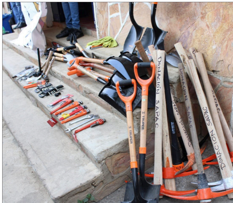
▲ Con la donación de herramientas, la Organización Colonias Unidas de Cuernavaca busca apoyar al Sistema de Agua Potable y Alcantarillado de Cuernavaca (Sapac) para la reparación de fugas de agua potable.

Expuso que a dos años del gobierno de Cuernavaca, han logrado el rescate del Sistema de Agua Potable y Alcantarillado de Cuernavaca (Sapac), pues a su llegada no se contaba con herramienta, vehículos y pipas: “La idea es extraordinaria nos han hecho algunas donaciones importantes, el presidente municipal ha estado muy comprometido con el Sapac” y recordó “que en días recientes hizo entrega de material muy importante para el trabajo que se hace de manera muy cotidiana”.