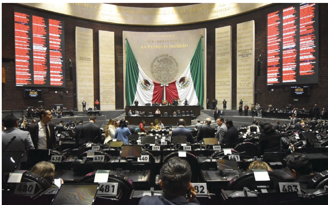
▲ En breve el Congreso de la Unión notificará al Congreso local para que "proceda como corresponda".

También mencionó que varios fiscales renunciaron al cambiar de gobierno, sugiriendo que esto va en contra de la Constitución. Además, afirmó que las investigaciones deben basarse en evidencia y pruebas, no en motivaciones políticas, por lo que descalificó la resolución de la Cámara.