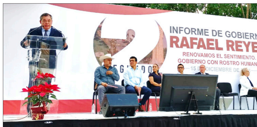
◀ Gracias a una correcta aplicación de los recursos de los que se dispone se lograron resultados importantes en Jiutepec, aseguró el alcalde Rafael Reyes Reyes al rendir su segundo informe de gobierno.

Así, entre aplausos concluye el alcalde que se despidió reiterando que el cargo público es pasajero, pero los amigos se quedan para siempre. Rafael Reyes aún no ha definido su próxima misión en la política morelense, eso se verá después, hoy la misión se ha cumplido.