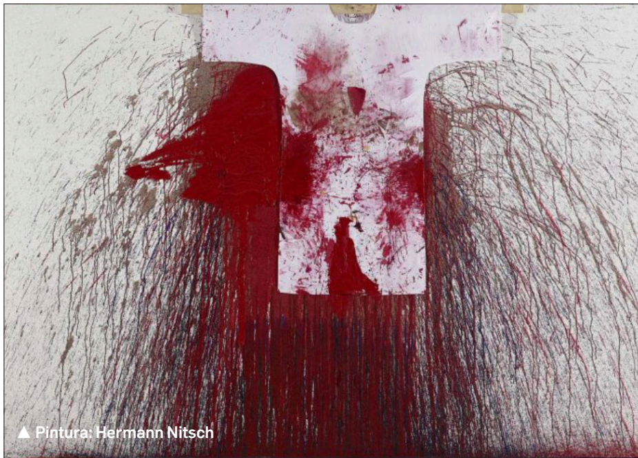
▲ Pintura: Hermann Nitsch