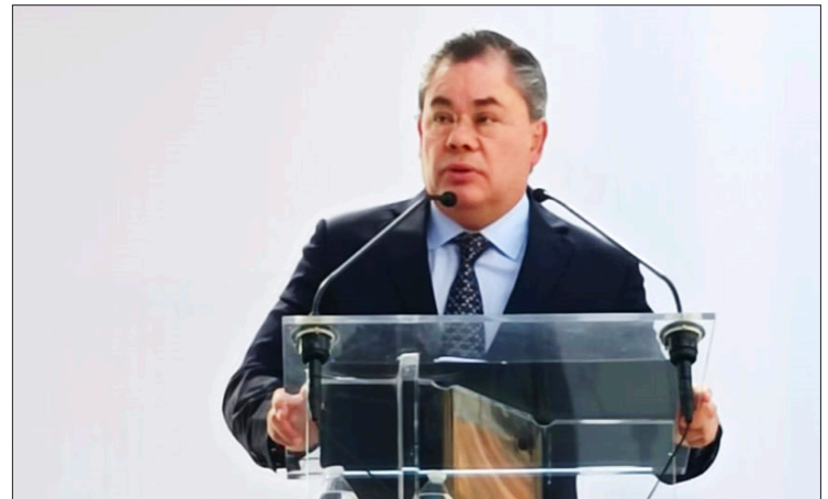
▲ Con acciones concretas, en favor de los que menos tienen se construye futuro en el municipio, aseguró el alcalde en su segundo informe de actividades.

Jiutepec ha realizado “este año 29 obras gracias a recursos del Fondo de Aportaciones para la Infraestructura Social (FAIS) mismas que se suman a las 169 hechas en años anteriores para dar un total de 198, entre las que se encuentran pavimentaciones de calles, introducción de redes de agua potable y drenajes, construcción de muros de contención, electrificaciones, rehabilitación de espacios públicos, la rehabilitación de canchas de fútbol como las de la Unidad Habitacional Campestre y la construcción del Parque de la