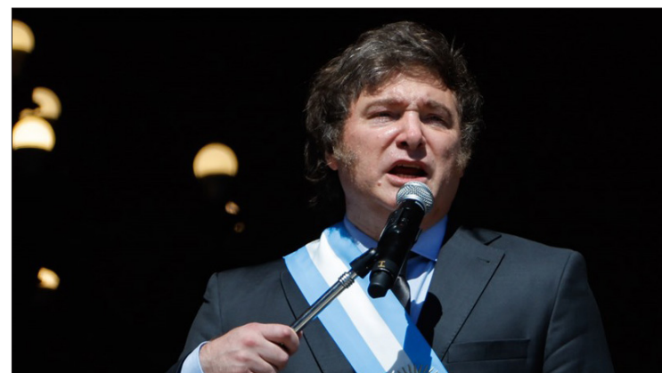
▲ Javier Milei.