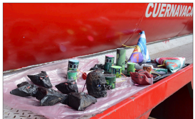
▲ Los cohetes conocidos como “Paloma”, “Mole”, “Hulk”, “Huevo de codorniz” y “Cabeza de diablo”, representan un gran peligro al ser detonados por su impacto expansivo.

Reiteró la recomendación de “no utilizar este tipo de productos, que además de provocar daños al medio ambiente y a la fauna domestica como son perros y