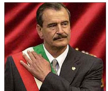
▲ Vicente Fox.

La magistrada comprometió al Tribunal: "Revisaremos la legalidad del acuerdo y el cumplimiento de las medidas afirmativas establecidas en 2021 antes de emitir una posición".