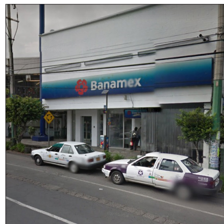
▲ El Ayuntamiento de Cuernavaca solicitará que se apliquen mayores medidas de seguridad al interior de las sucursales bancarias.

La tarde de este jueves, se reportó el robo de 200 mil pesos a una persona que salió de un banco ubicado en la avenida Plan de Ayala en Cuernavaca y fue asaltado por dos sujetos armados al llegar a su domicilio en la colonia Ciudad Chapultepec.