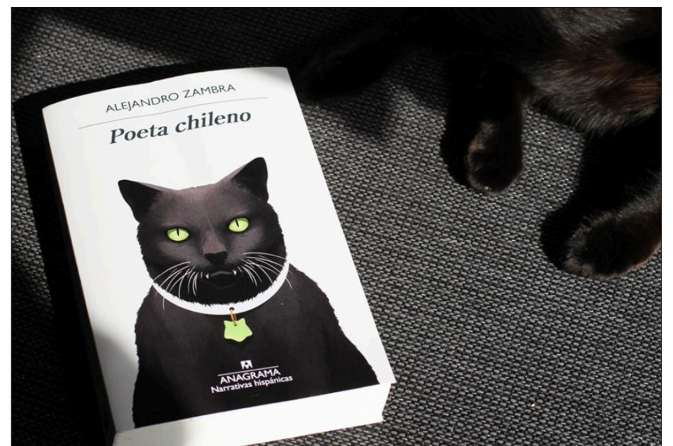
▲ Poeta chileno , Alejandro Zambra. Editorial Anagrama.

* Poeta chileno , Alejandro Zambra. Editorial Anagrama Primera edición mexicana: 2020.