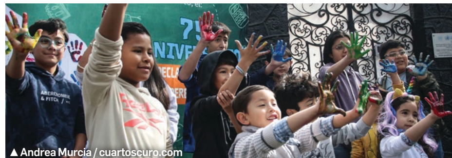
▲ Andrea Murcia / cuartosuro.com

Derecho a la protección de la salud y a la seguridad social. Deben gozar del más alto nivel posible de salud y a recibir la prestación de servicios de atención médica gratuita y de calidad.