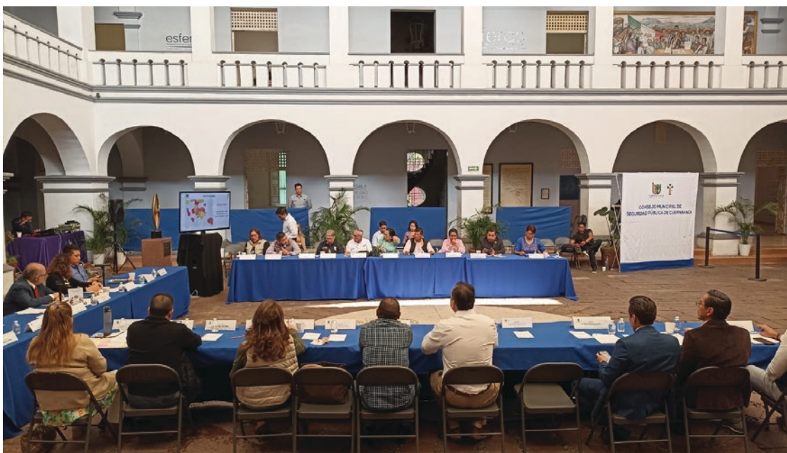
▲ "En la última sesión ordinaria del año del Consejo Municipal de Seguridad Pública de Cuernavaca se informó que se han fortalecido las acciones de socialización e información a la población sobre los servicios, acciones y medidas de autoprotección.