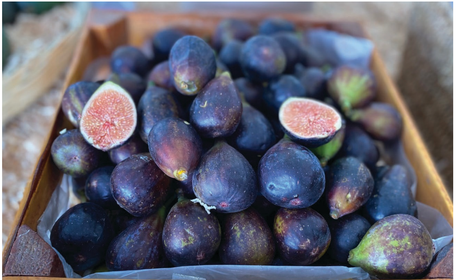
▲ Con la producción de tres mil 789 toneladas de higo, Morelos es líder en producción del fruto a nivel nacional.

Cabe mencionar que las y los productores recibieron su Certificado de Huertos de Higo Registrados para Exportación a Estados Unidos con Tratamiento de Irradiación, en coordinación con el Consejo Estatal de Sanidad Vegetal del Estado de Morelos (CESVMOR), lo que refrenda su compromiso y contribución a la producción agrícola.