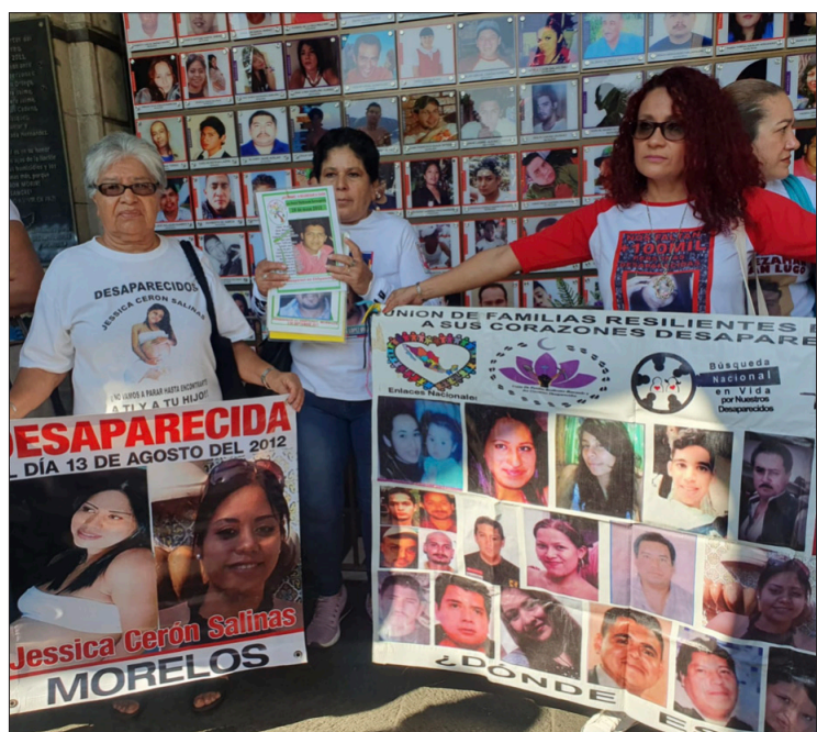
▲ También acusan a la Comisión Estatal de Atención y Reparación a Víctimas de no atender a afectados en Morelos.

Sin embargo, señaló que no tiene miedo de regresar a la cárcel, donde ya estuvo más de 25 años, pues lo que busca es demostrar que no fue responsable del delito de secuestro por el cual fue detenida en enero de 1988.