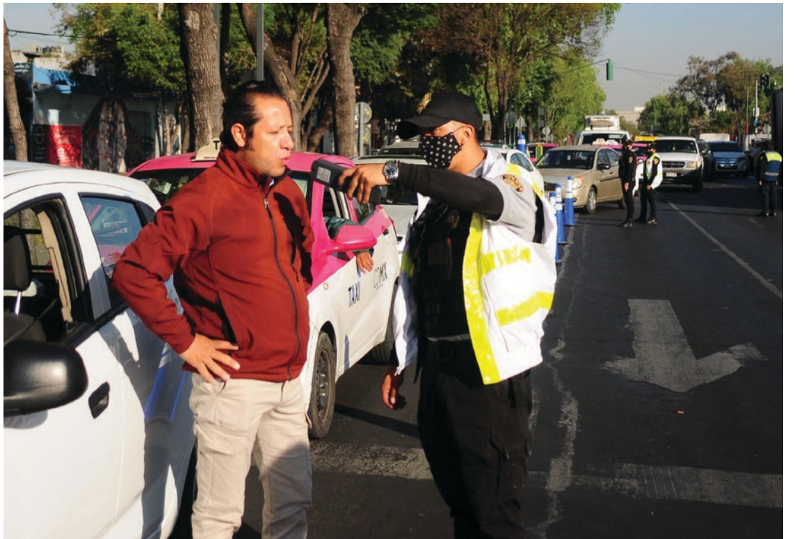
▲ En los primeros días de celebraciones de fin de año, ocho personas han sido detenidas por el operativo.

“Más que darles una oportunidad lo toman como un reto porque siguen dejando sus coches mal estacionados, no utilizan el cinturón de seguridad o llevan en las manos equipo de telefonía. Tenemos un registro de 35 a 42 accidentes viales por semana y se incrementan entre 50 y 60. La recomendación es que también tengan en orden su documentación”, enfatizó.