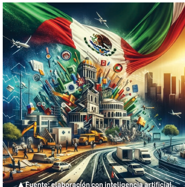
▲ Fuente: elaboración con inteligencia artificial.

La infraestructura en México también necesita atención urgente. Una red de transporte eficiente, carreteras seguras, y sistemas de agua y saneamiento adecuados son esenciales para el desarrollo económico y la calidad de vida de los ciudadanos. La falta de inversión en estos sectores ha limitado el potencial de crecimiento del país y ha perpetuado desigualdades regionales. Una reforma fiscal que incremente la inversión pública en infraestructura no solo mejoraría la vida cotidiana de los mexicanos, sino que también impulsaría el desarrollo económico, creando empleos y favoreciendo un entorno más propicio para la inversión privada.