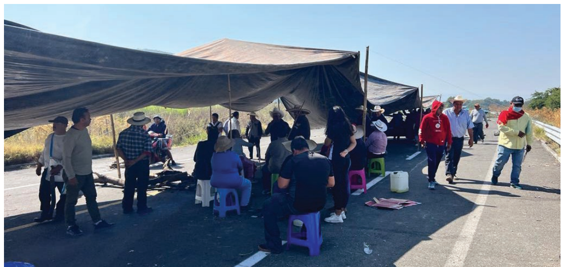
▲ Los campesinos que mantienen tomado el tramo carretero se pronunciaron ayer por continuar con los bloqueos.

“no es un solo caso”, sino varios en que se incurrió en ilícitos. El mismo vocero exhibió que los concesionarios pagaron a otros en 2018 a 177.75 pesos el metro cuadrado de terreno afectado, sin embargo, ahora quieren pagar máximo 80 pesos.