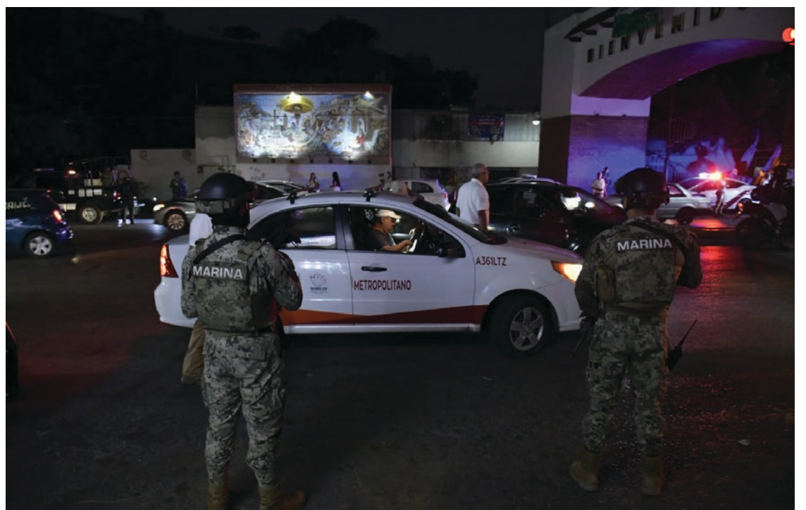
▲ Por las amenazas, la Comisión Estatal de Seguridad Pública Morelos mantiene presencia constante en el municipio de Temixco y, con la Secretaría de Movilidad y Transporte, realiza revisiones de taxis.

El Ejecutivo advierte que durante las festividades decembrinas “también se realizarán recorridos por aire y tierra, los cuales se desplegarán en lugares de mayor afluencia como balnearios, zonas arqueológicas y centros recreativos”.