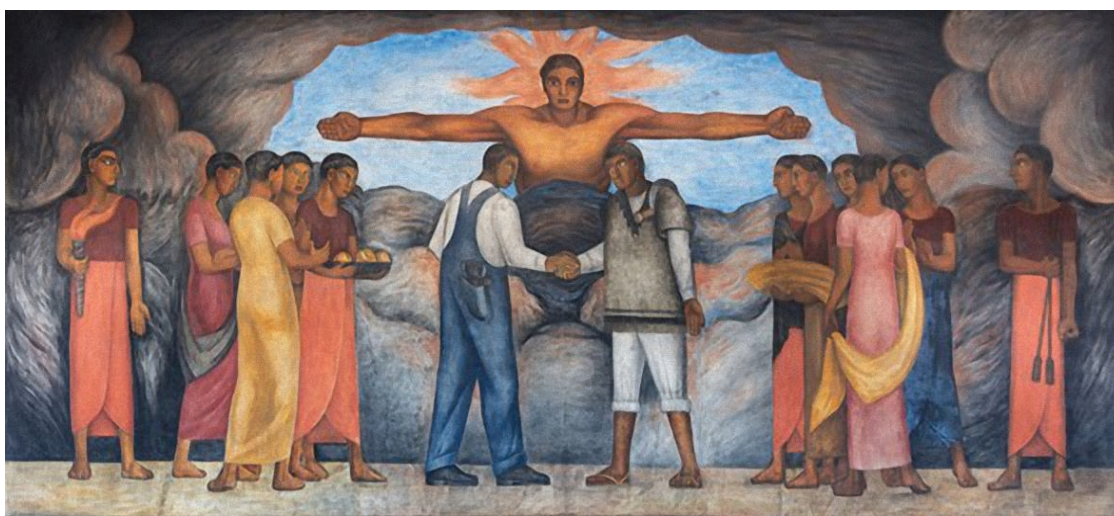
▲ "Fraternidad", mural de Diego Rivera.

Felices fiestas y un mejor año para todos. Repartan abrazos. Fraternalmente, va de nuez: fraternalmente.