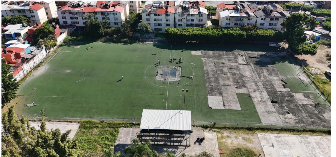
▲ El objetivo de la rehabilitación es ofrecer a los usuarios una cancha en óptimas condiciones para la práctica de la disciplina deportiva.

La rehabilitación de la cancha de la Campestre forma parte del Programa Anual de Obra Pública aprobado por los integrantes del Ayuntamiento, para mejorar las condiciones de vida de las familias jiutepecenses.