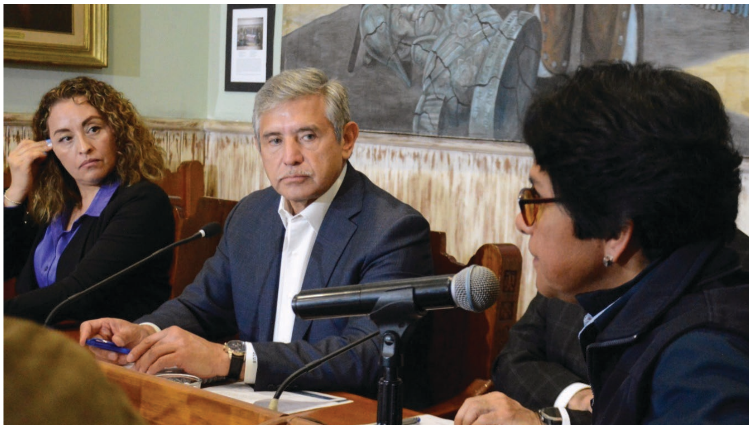
▲ La sede del Sistema Calle de Cuernavaca será el Centro de Control, Comando, Comunicación, Cómputo, Calidad y Contacto Ciudadano (C4) y funcionará de acuerdo con los parámetros nacionales.

Con ello, el tiempo de respuesta para atender algún auxilio deberá de reducir a dos a tres minutos, dependiendo de la cercanía de los agentes policiales con el sitio de la llamada de auxilio, concluyó.