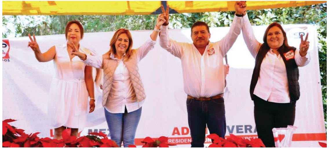
▲ La precandidata a la gubernatura aseguró que los "fuereños" solo han llegado al estado a enriquecerse y a perjudicar a las familias.