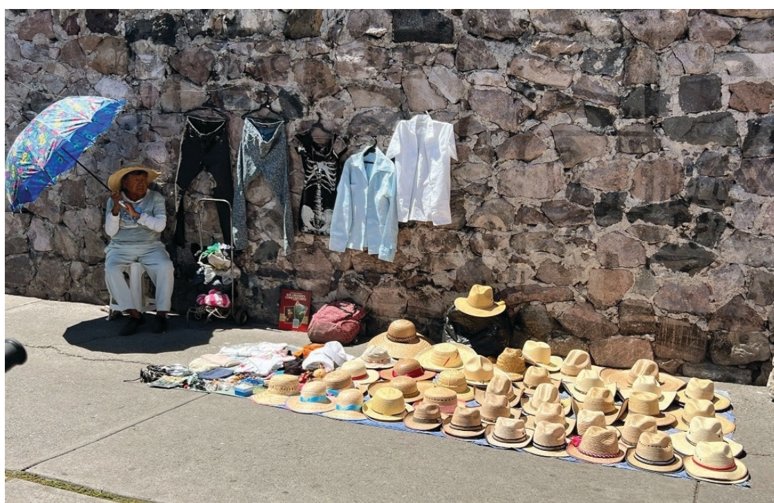
▲ Datos de la Encuesta Nacional de Ocupación y Empleo (ENOE) revelan que 54.9 por ciento de la población ocupada en el país lo hace en el sector informal.

Organismos internacionales como la Comisión Económica para América Latina y el Caribe (Cepal) estiman que 65 por ciento de la población de la región vive en hogares que dependen total o parcialmente del empleo informal. Mientras la Organización para la Cooperación y Desarrollo Económicos (OCDE) prevé que 43 por ciento de las personas en América Latina depende enteramente del empleo informal.