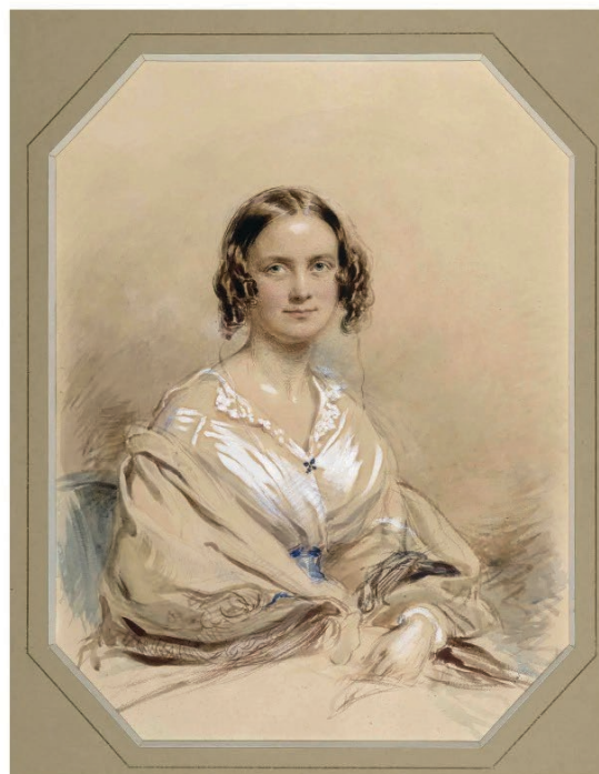
▲ Charles y Emma Darwin.