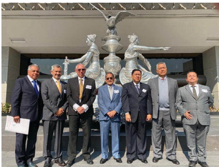
▲ Acusan al Congreso de haber violado la ley con el nombramiento de magistrados del Tribunal Superior de Justicia, al tiempo que juzgados federales rechazaron las solicitudes de amparo depositadas por algunos abogados al considerar que el nombramiento es un acto autónomo del Congreso.

Aseguró que el proceso legislativo fue realizado correctamente, y considera que las impugnaciones no procederían en ese aspecto, aunque se comprometió a examinar a fondo cualquier nueva información al respecto.