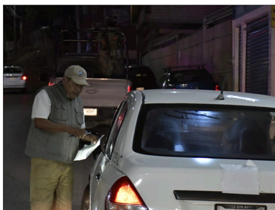
▲ Las autoridades de Temixco han intensificado las medidas de prevención en colaboración con la Secretaría de Movilidad y Transporte (SMYT).

En cuanto a la incidencia delictiva en el municipio, el secretario general afirmó: "Podemos garantizar que, en este momento, el municipio tiene eventos como todo el estado de Morelos, pero son los eventos que forman parte de la incidencia delictiva habitual".