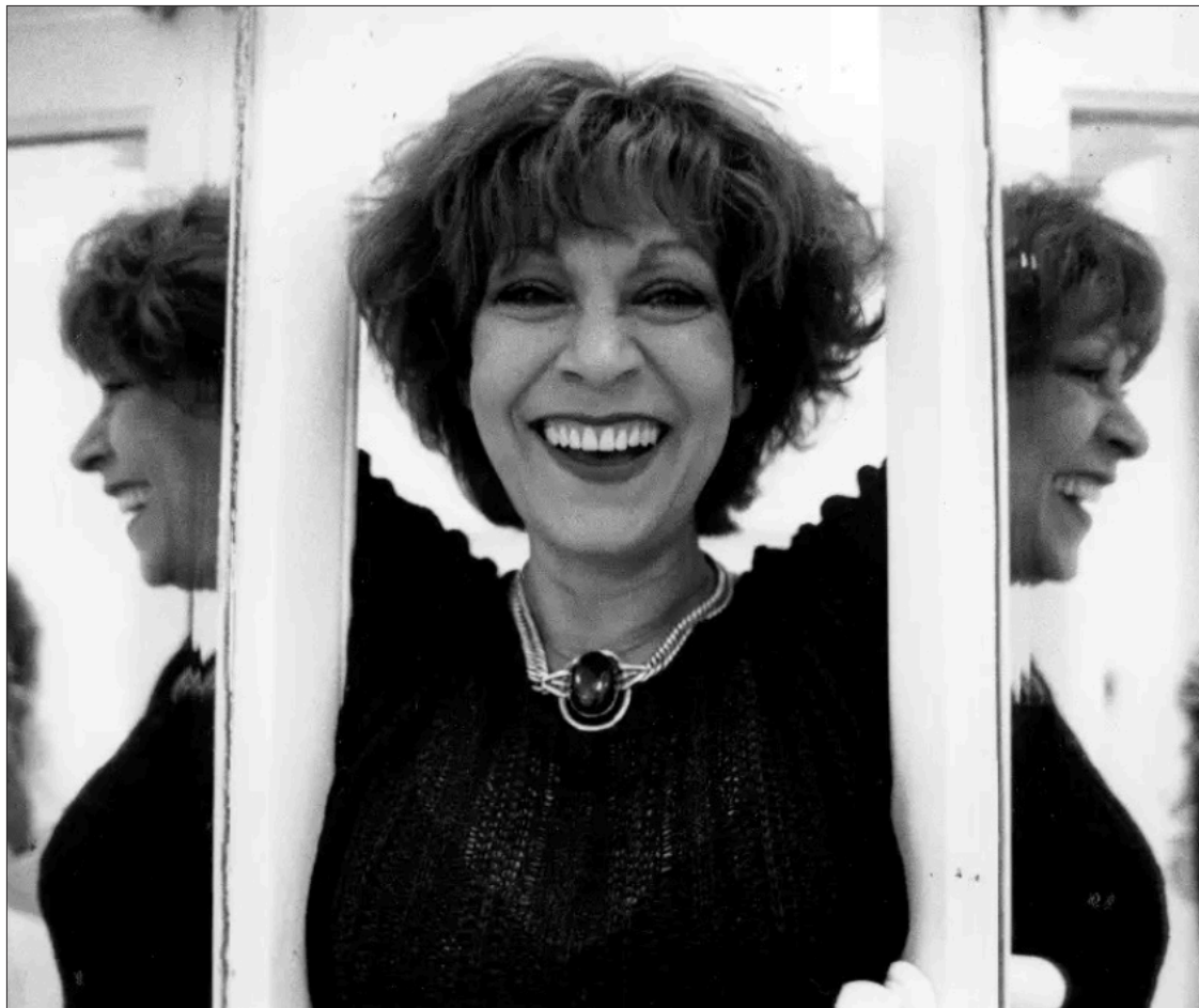
▲ La periodista y escritora Cristina Pacheco, el 24 de abril de 1996.