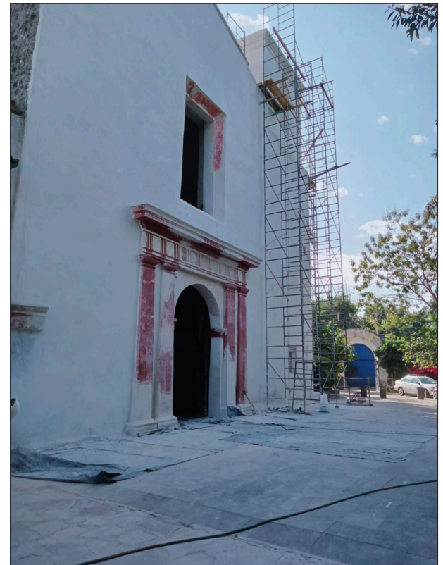
▲ Exconvento Dominicano de la Asunción de María en Yautepec. Siglo XVI.

Ahora toca a la feligresía y a las autoridades eclesásticas desmontar las capillas provisionales y dignificar la otrora