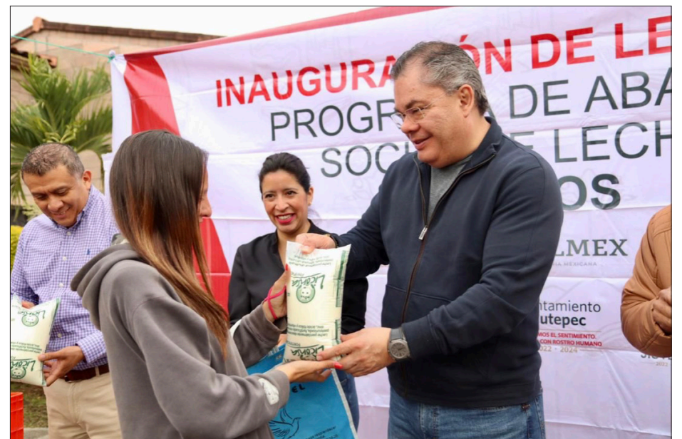
▲ Con la de Arcos de Jiutepec, ya son 28 lecherías LICONSA que operan en el municipio.