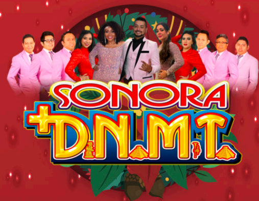
SONORA D.N.M.T. Miércoles 13 de diciembre