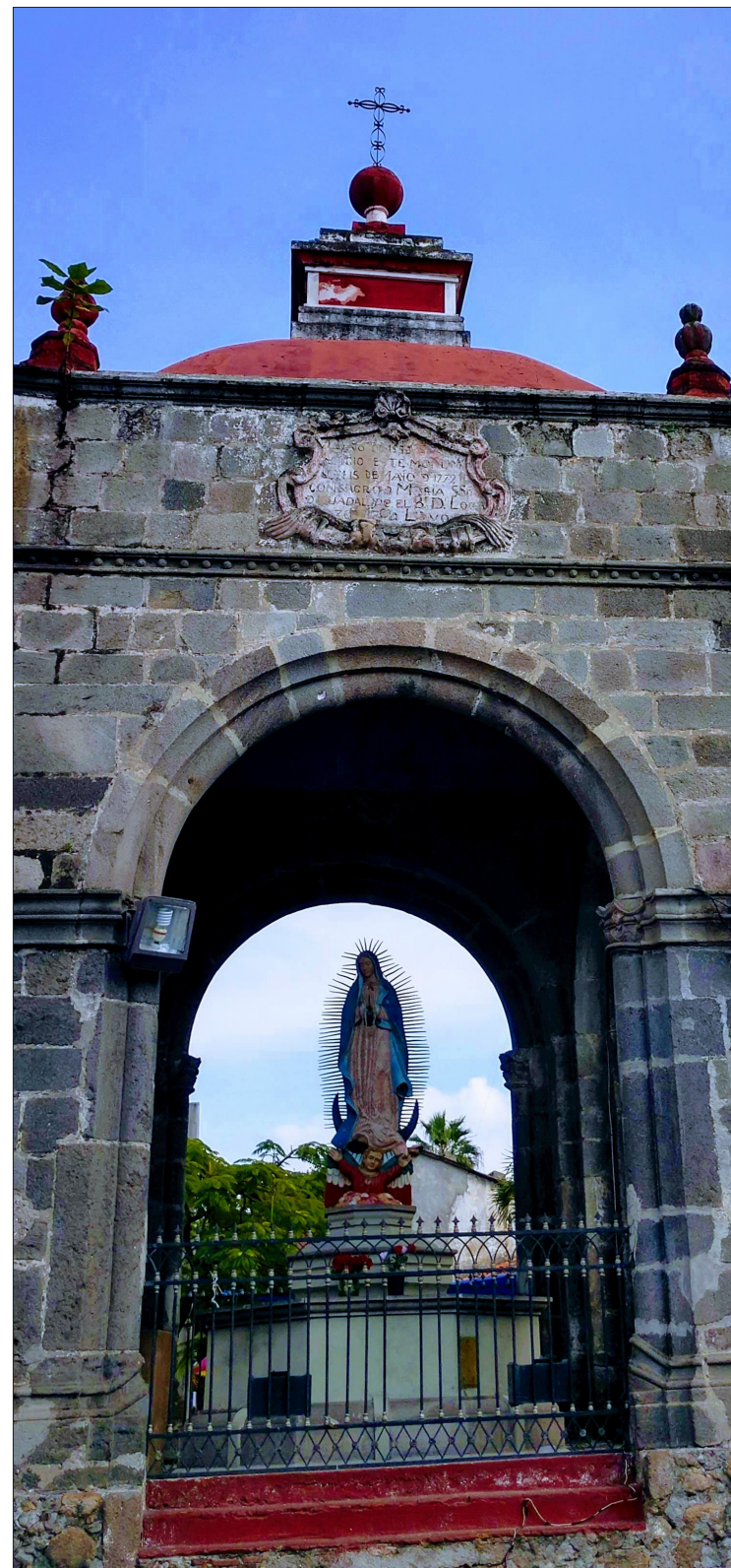
▲ La tradición guadalupana tiene uno de sus escenarios frente a la imagen ubicada frente a la iglesia de El Calvario, en la entrada de la Cuernavaca antigua.

Los menos glotones piden apenas un chicharrón preparado, pero son minoría frente a la cantidad de comensales que le entra al pozole, el pambazo y la garnacha