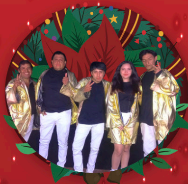
GRUPO QUE CUMBIA Martes 12 de diciembre