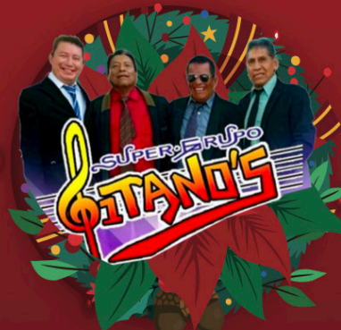
SUPER GRUPO GITANOS Sábado 16 de diciembre