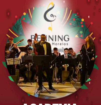
ACADEMIA BENNING Y BIG BAND JAZZ MORELOS Domingo 17 de diciembre