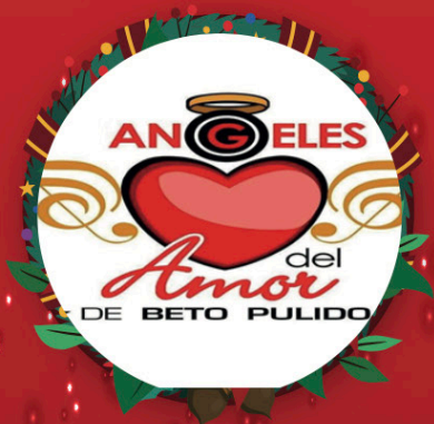
ANGELES DEL AMOR Lunes 11 de diciembre