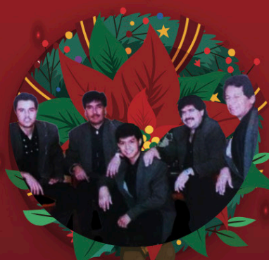
MISTER LOBO Viernes 15 de diciembre