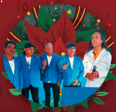
CONJUNTO REBELIÓN (TRIBUTO A RIGO TOVAR) Jueves 14 de diciembre