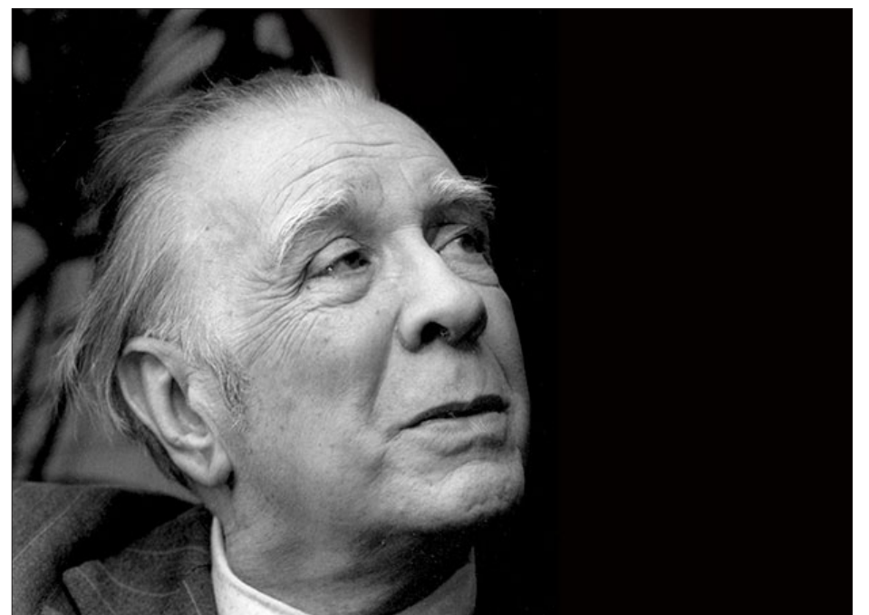
▲ Jorge Luis Borges.

*El Colegio de Morelos / Red Mexicana de Mujeres Filósofas