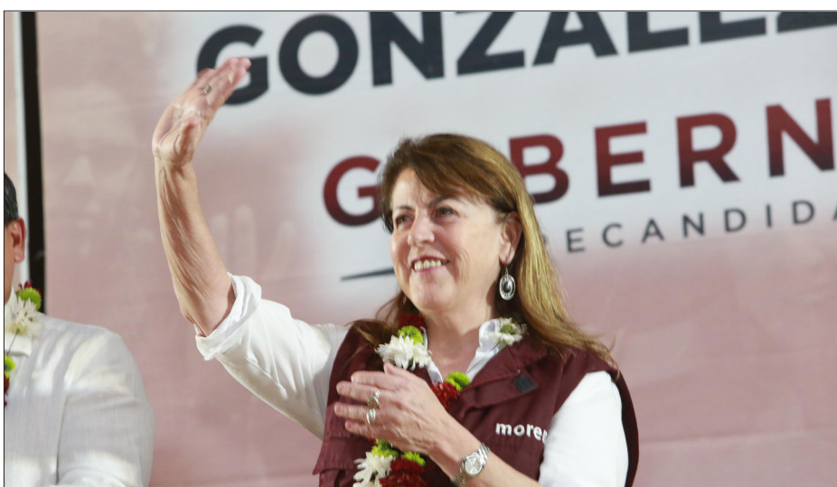
▲ La precandidata fue recibida calurosamente en Tepoztlán, en donde invitó a sus simpatizantes a mantenerse unidos para concretar la transformación en Morelos.