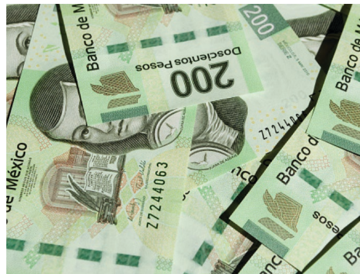
▲ Conadusef llama a reforzar precauciones en la época decembrina, debido al aumento detectado en la circulación de moneda apócrifa.

Asimismo, identificó los establecimientos comerciales, mercados municipales y tianguis de las colonias como los puntos críticos donde se registra el mayor índice de circulación de billetes falsos. En este contexto, se recomienda a la población en el estado de Morelos extremar precauciones y vigilar con detenimiento los billetes que reciben durante sus transacciones comerciales.