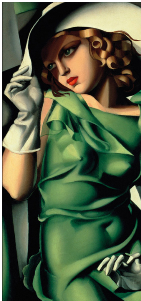
▲ Tamara de Lempicka, "Young Lady with Gloves".

Ya en el avión Documental de Anthony Bourdain, el que filmó con CNN, antes de suicidarse.