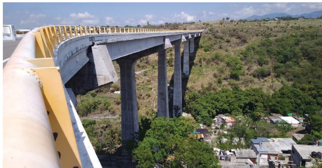
▲ Puente sin fin.

El mandatario resaltó que la obra costaría 600 millones de pesos, no obstante, el proyecto sigue sin concretarse.