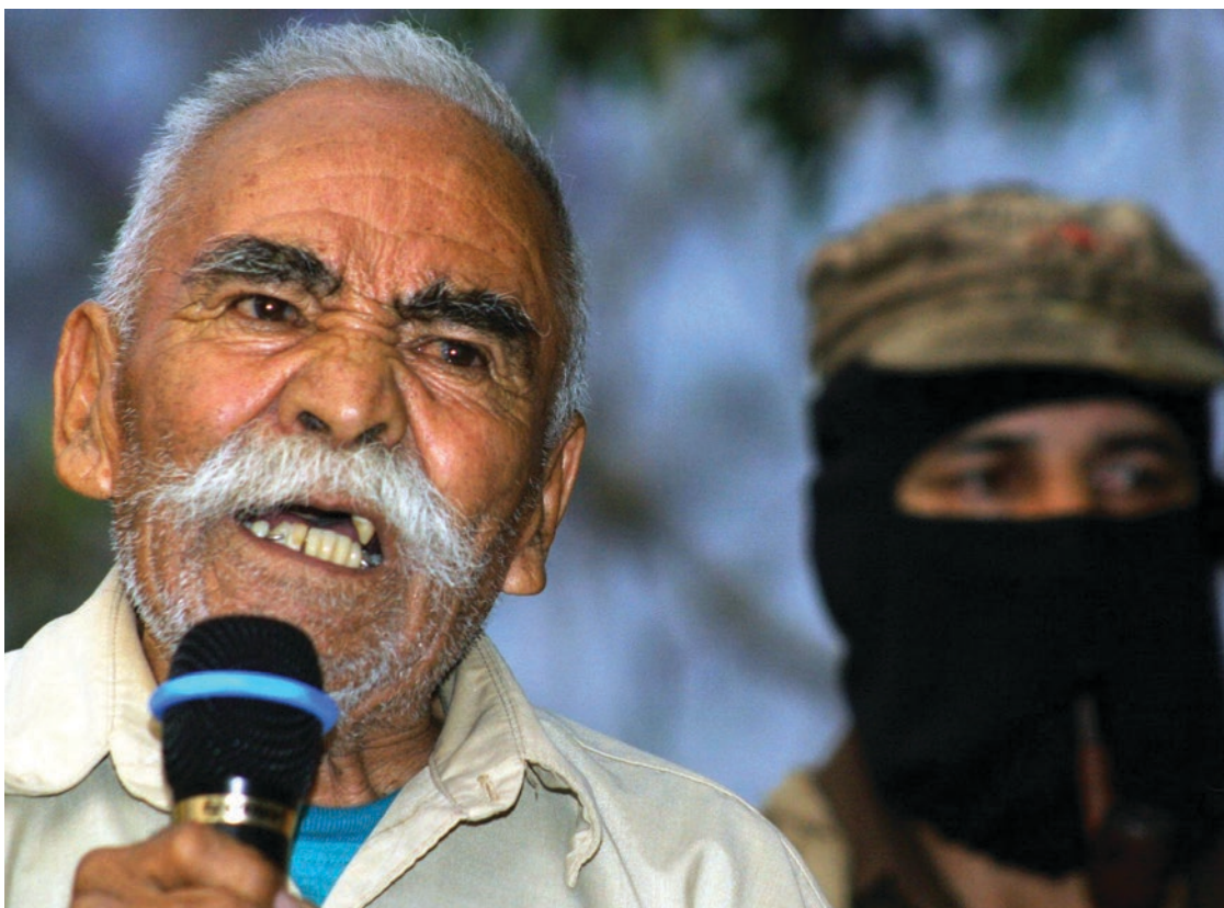
▲ El morelense Félix Serdán y el Subcomandante Marcos.

En Morelos hay 282 comunidades indígenas reconocidas en 35 municipios, en 173 de ellas se eligen a autoridades por el régimen de usos y costumbres, en el resto, se requiere la convocatoria del ayuntamiento. El único municipio donde no se reconoce una comunidad indígena es Jiutepec, aunque el conteo del INEGI ubicó a casi el 28% de la población del municipio autoadscrita como indígenas, casi 60 mil personas, éstas viven dispersas en todo el territorio y no concentradas en una sola población.