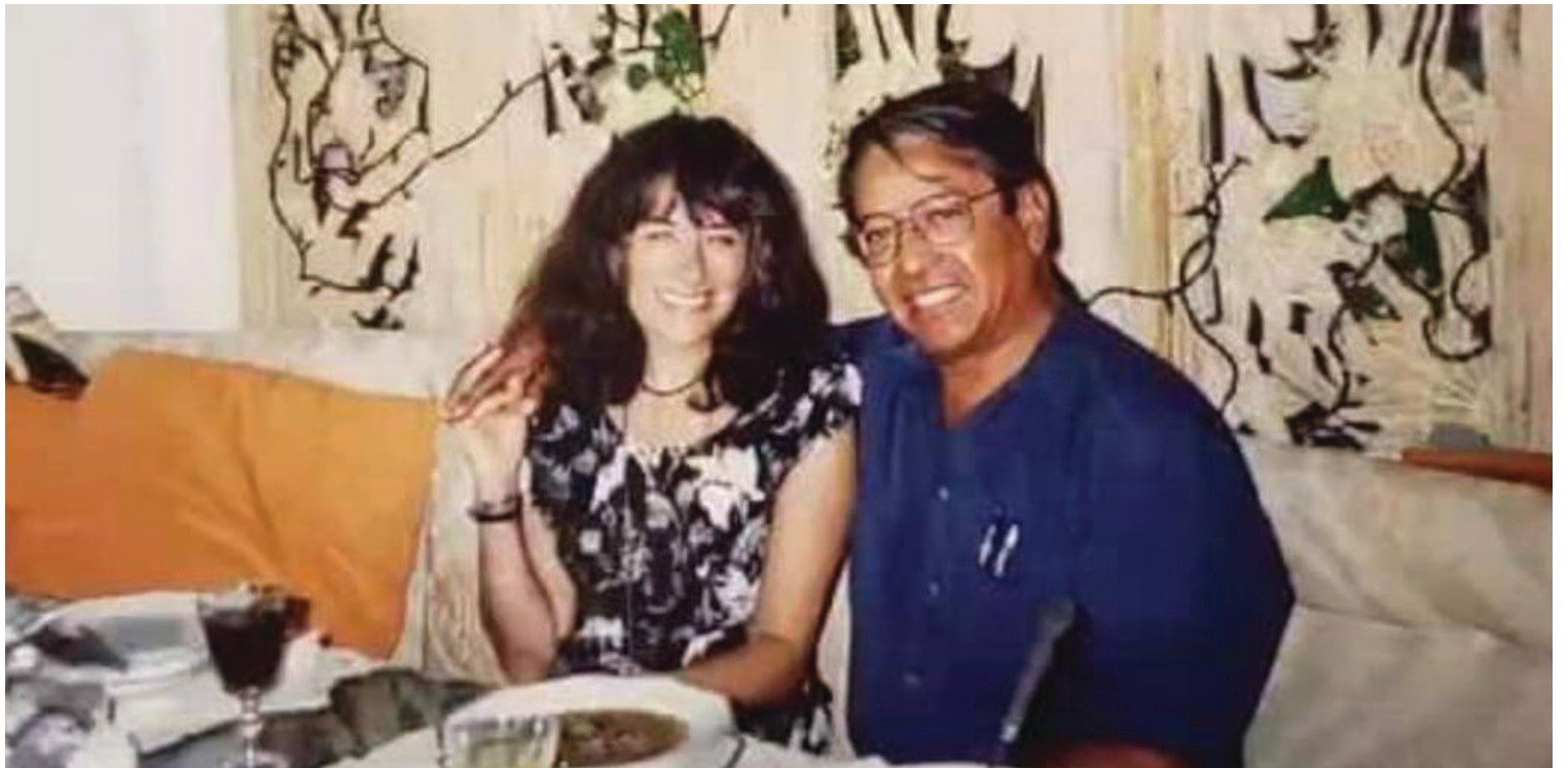
▲ José Agustín.

Cabe recordar que desde el 2009, el escritor considerado de culto cayó de una altura de casi dos metros en el Teatro de la Ciudad de Puebla, tras haber sido invitado a dar una conferencia, en la que sufrió seis costillas fracturadas, una lesión en el oído izquierdo y una ruptura en el cráneo y desde entonces su salud convaleció.