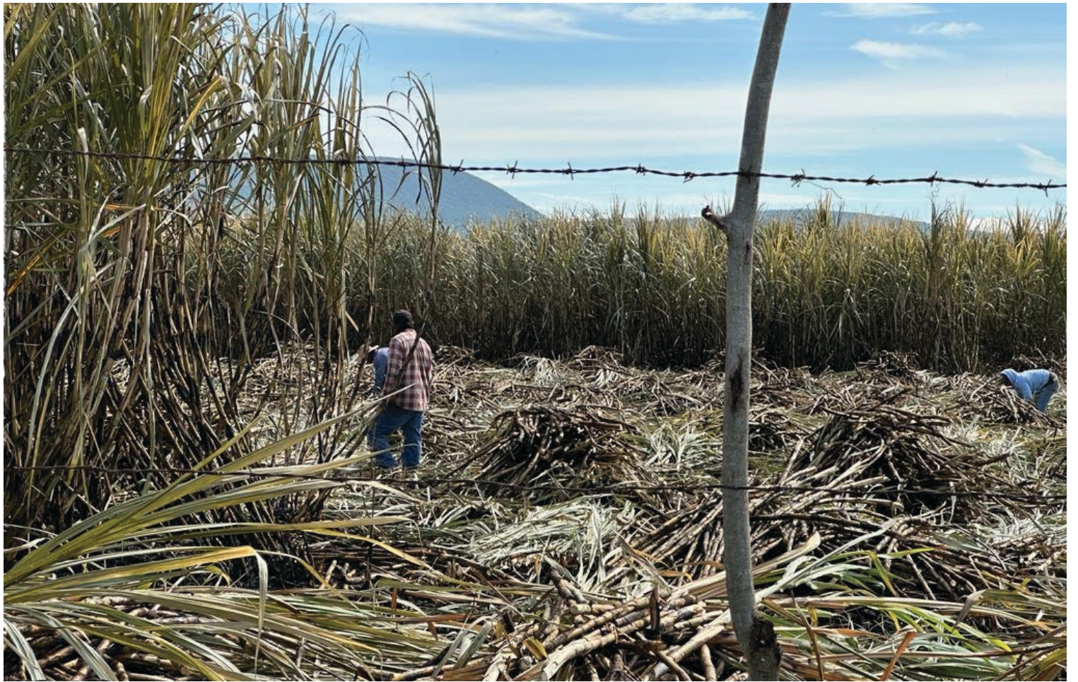
▲ Una de las actividades que resentirán más la sequía será la producción de caña.

Por otro lado, el funcionario federal del INIFAP, destacó que para este año se apoya la transición agroecológica, es decir, cosechar caña con la misma producción, pero con reducción en los costos de cultivo y con opciones de mejoramiento en el cuidado del suelo a través de abonos verdes, con microorganismos y algunas otras cuestiones en pro de cuidar el ambiente y reducir los productos químicos, tales como los fertilizantes.