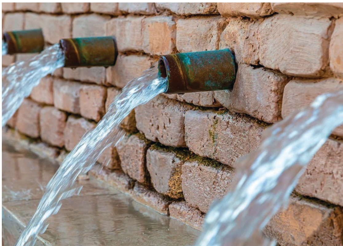
▲ Una inadecuada gestión del agua, como la falta de protocolos en la cloración del líquido en los municipios, podría ser la causa del repunte de casos de hepatitis y salmonela.

Una característica principal de la hepatitis aguda es la ictericia, es decir, una coloración amarillenta en la piel y los ojos.