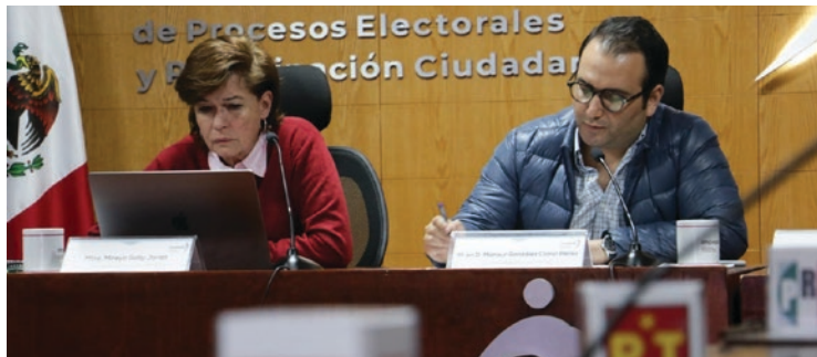
▲ Por unanimidad, los integrantes del IMPEPAC autorizaron interponer un recurso de inconformidad contra el presupuesto que le asignó el Congreso para 2024.

La consejera presidenta aprovechó entonces la sesión extraordinaria del Consejo Estatal Electoral para obtener la autorización de echar a andar los recursos jurídicos necesarios para garantizar la viabilidad financiera del órgano electoral durante la elección más grande en la historia de Morelos que será la de este 2024.