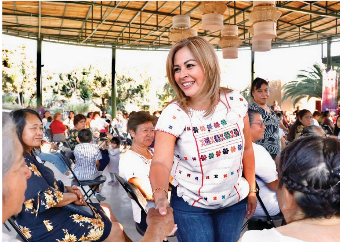
▲ Morelenses de todos los municipios se unieron al llamado de la precandidata con 1000 buenas acciones.