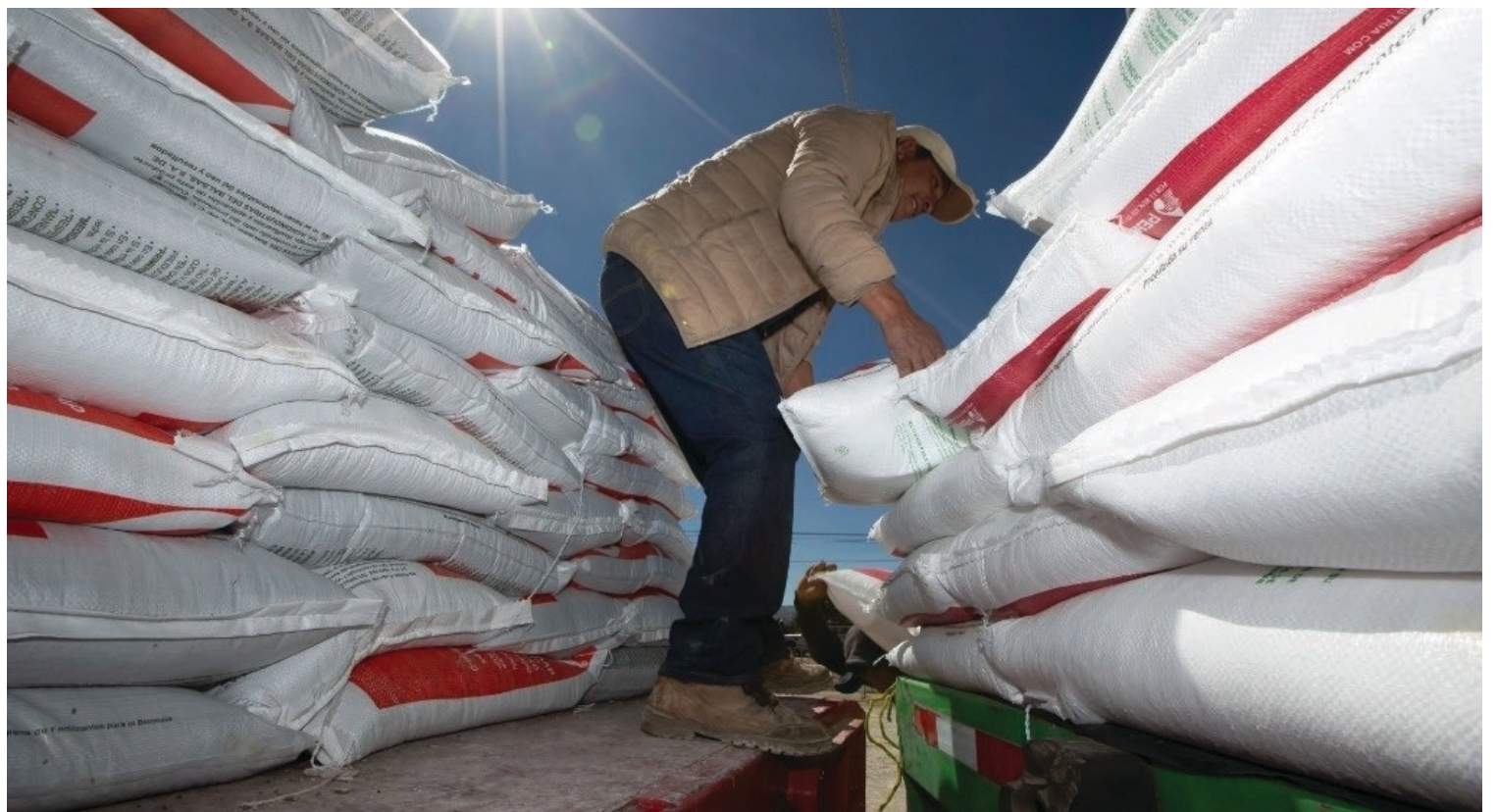
▲ El programa, que inició en 2019 en Guerrero, contará para este año con un presupuesto de 17 mil 489 millones de pesos para la adquisición de fertilizantes.

Agricultura resaltó que la población beneficiada por el Programa se encuentra comprometida a aplicar el paquete de fertilizantes recibido en el cultivo señalado en su solicitud y a aceptar, facilitar y atender en cualquier etapa del proceso para la entrega de los apoyos y posterior a ésta, verificaciones, auditorías, inspecciones y solicitudes de información para verificar la correcta aplicación de los recursos otorgados.