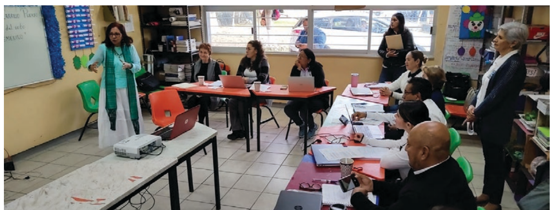
▲ Docentes y directivos se capacitarán en planeación educativa durante esta semana. El retorno a las aulas revivió viejos pendientes en el sector educativo.

La secretaria de Educación Pública, Leticia Ramírez Amaya, visitó la telesecundaria Felipe Carrillo Puerto, en la comunidad de Michapa en Coatlán del Río, para acompañar a directores de primerías al inicio del taller para directivos, ahí aseguró que la sesión busca formar “líderes que permitan detonar habilidades específicas para el ejercicio de la función docente, la de directivos y supervisores”.