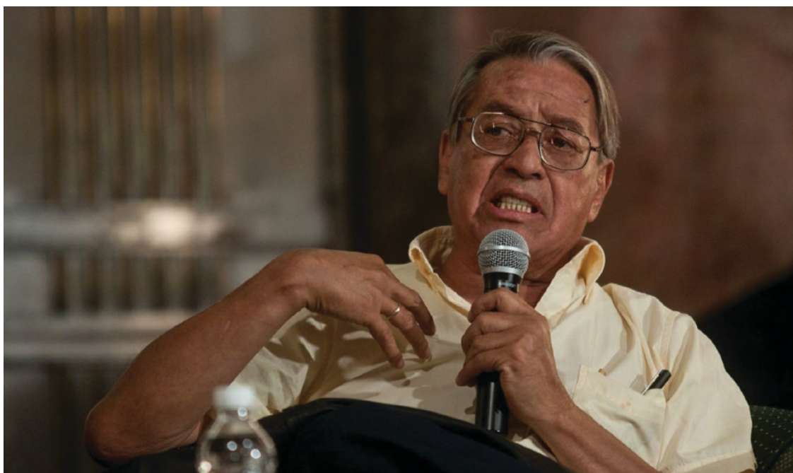
▲ José Agustín.

Entre las distinciones y reconocimientos nacionales e internacionales que ha recibido, destacan el Premio Nacional de Literatura “Juan Ruiz de Alarcón” 1993; el premio “Dos océanos”, otorgado por el Festival Internacional de Biarritz, Cine y Cultura de América Latina, en 1995 por su obra Dos horas de sol; la preseña “Juan R. Escudero” del Puerto de Acapulco, 2005, y la medalla Bellas Artes, en 2011. En su honor, se entrega el premio de cuento “José Agustín”, de Acapulco, Guerrero desde 1996.