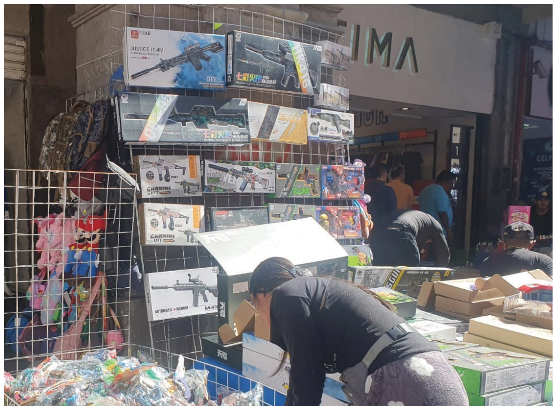
▲ Las autoridades han recomendado evitar regalar juguetes bélicos para evitar replicar conductas agresivas.

réplicas de armas con finalidades bélicas"; sin embargo, no se ha avanzado en la legislación sobre el tema.