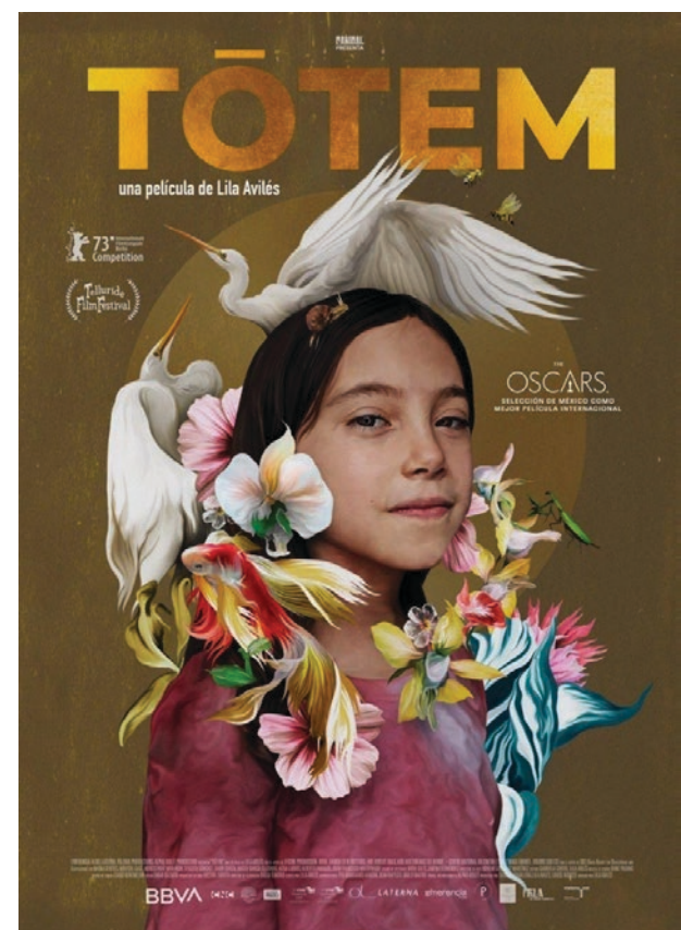
▲ Imagen: Filmaffinity

A la familia de Mafer, les abrazo desde el fondo de mi alma. No están solos en su dolor. Toda la ciudad llora porque nos falta Mafer.