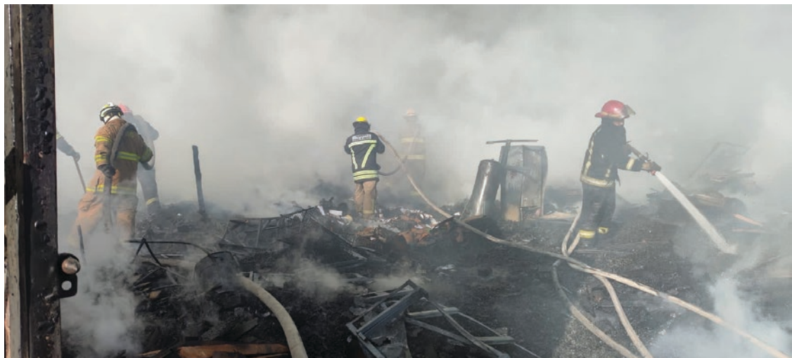
▲ Pese a la intervención de bomberos, personal de protección civil y pipas de agua que sofocaron el incendio, en el sitio se encontraron dos víctimas fatales.