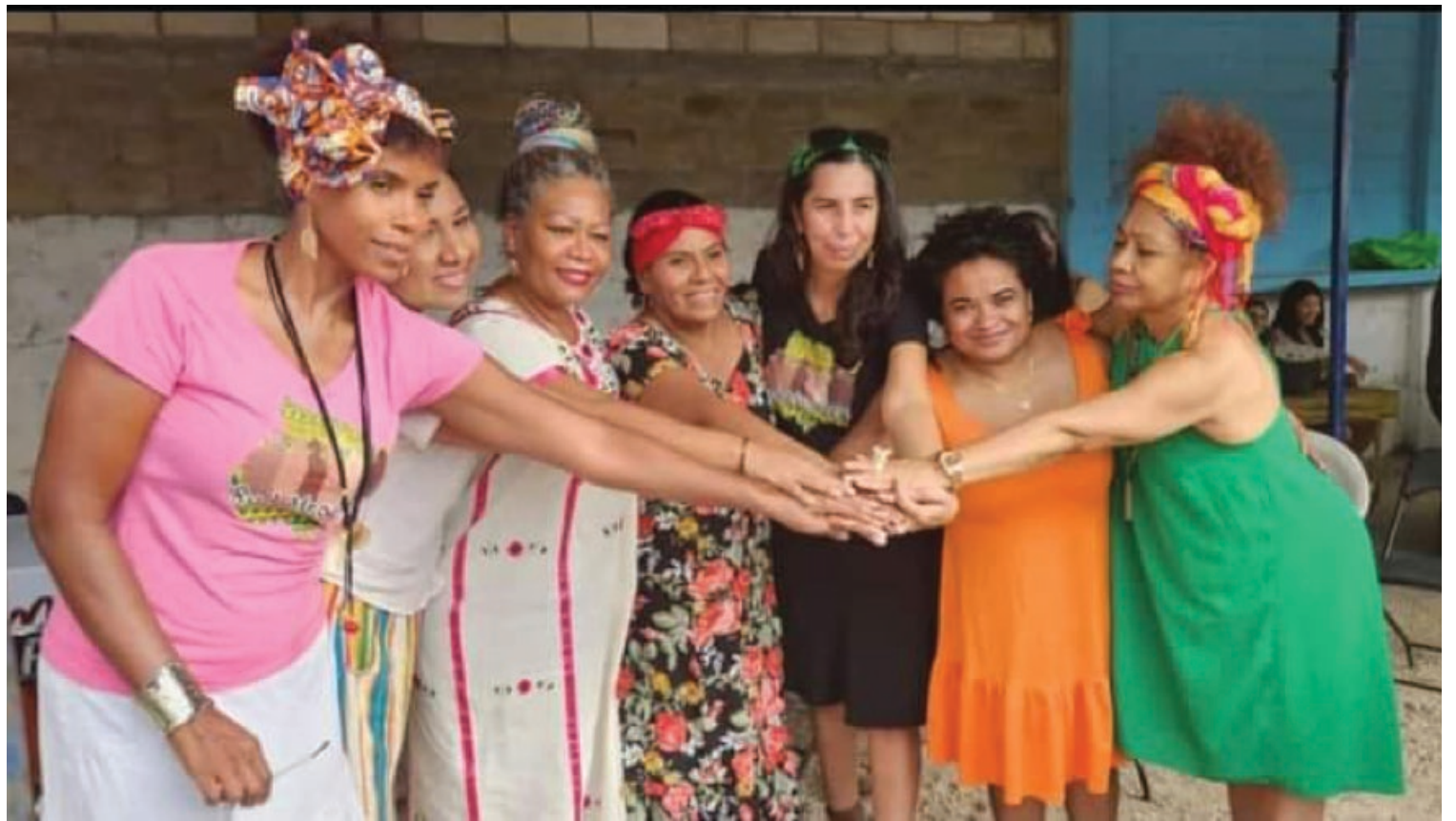
▲ Mujeres afrodescendientes de Morelos aseguran que el Impepac omitió garantizar su derecho de ser votadas en el Proceso Electoral Ordinario 2023-2024