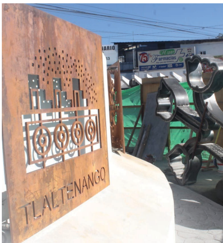
▲ El personal del ayuntamiento trabaja a marchas forzadas para dar los últimos toques a la nueva Glorieta de la Identidad.

Chavira de la Torre confirmó que en unos días se tendrán resultados evidentes, brindando a la población un espacio digno donde encontrarán las 12 toponimias de los pueblos originarios de la ciudad que en el centro contará con la toponimia de Cuernavaca, impulsando la identidad e historia de la ciudad de la Eterna Primavera.