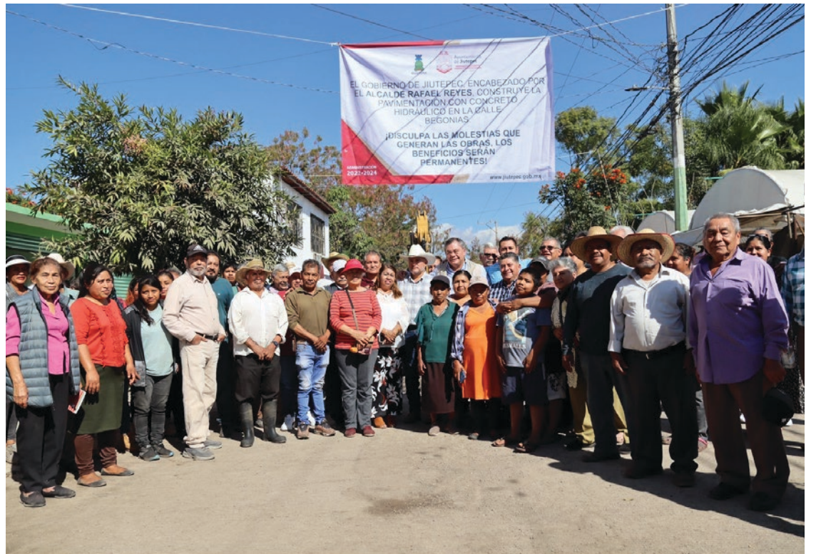
▲ El presidente municipal compartió en una charla con vecinos la importancia de mejorar las condiciones de una de las vialidades más utilizadas por la población de Jiutepec.