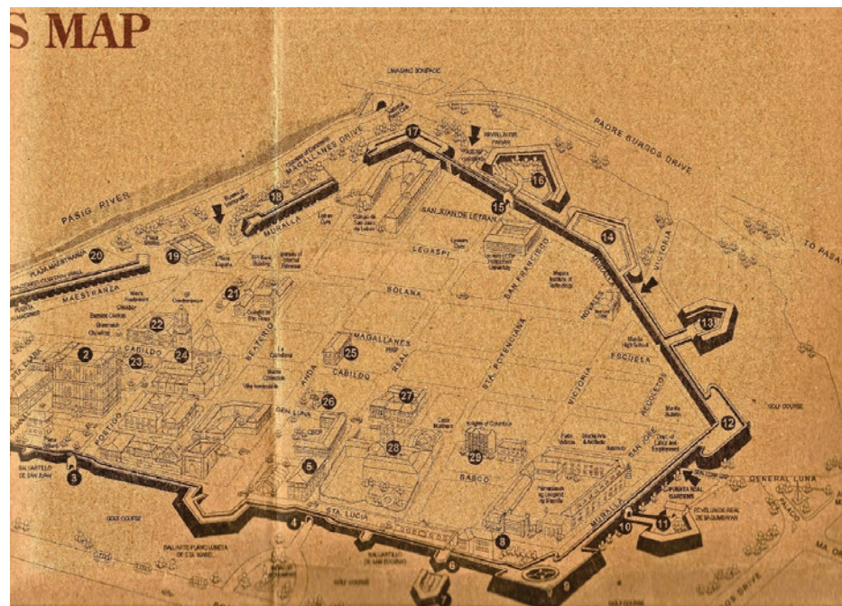
▲ Plano del conjunto de intramuros de la ciudad de Manila, Filipinas.

El entorno a la muralla en extramuros y el glacis de protección, espacio abierto de la muralla para su defensa original, se ha conservado gracias a un proyecto de campo de golf que ha logrado dejar libre este monumento militar histórico en la periferia extramuros de la ciudad virreinal. Ha sido una interesante y buena solución para este espacio exterior, sus perspectivas, su entorno cultural y natural, que bien vale la pena comentar como una solución asertiva para otras fortificaciones y sus entornos, ya que varias se han perdido por nuevas edificaciones, muchas fuera de contexto.