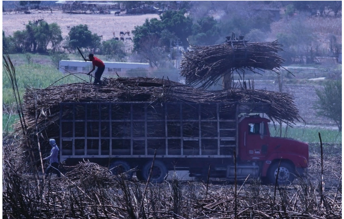
▲ La producción de azúcar de caña disminuirá este año debido a la falta de lluvias la temporada pasada.

“Esto significa que es probable que México dependa aún más de lo normal del suministro centroamericano. Los países centroamericanos exportan normalmente unos 3.3 millones de toneladas de azúcar. Este año, la mayor parte irá a México”, apuntó la analista.