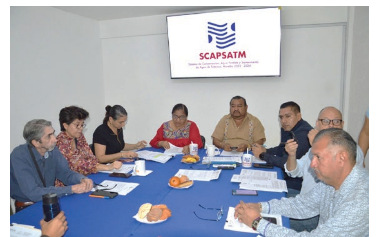
▲ La Junta de Gobierno del Sistema órgano aprobó descuentos y estímulos fiscales para el pago del servicio del agua, en Temixco.