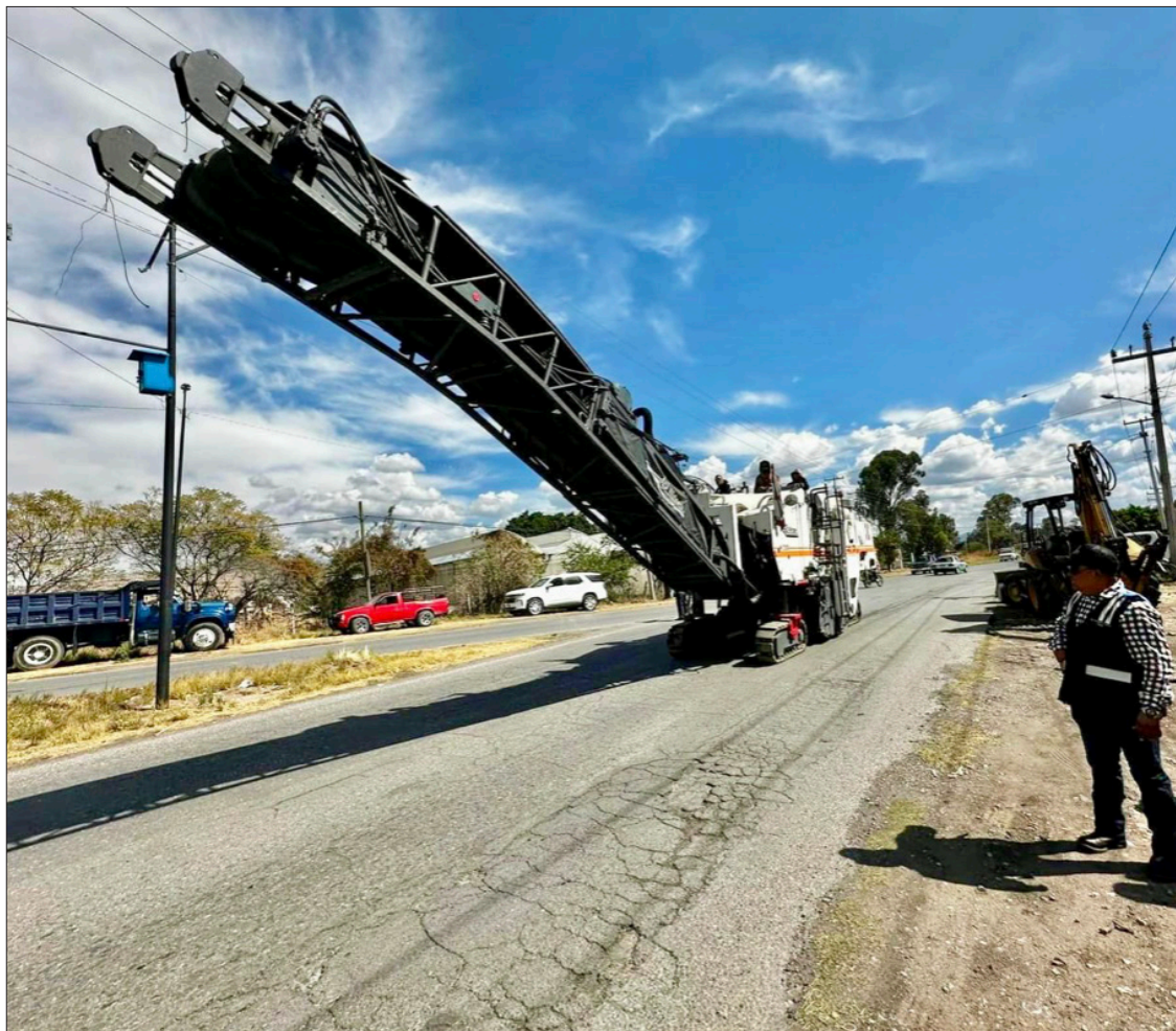
▲ La rehabilitación del tramo carretero se realiza con recursos etiquetados desde el Congreso del estado dentro del Fondo de Infraestructura Regional Municipal (FIRM).

Y reconoció que las gestiones para la obra “no han sido fáciles, pero estoy muy contento por cumplir con mi Distrito y por haber etiquetado los recursos para esta obra” de alto impacto del ayuntamiento de Yecapixtla, y reveló que en el mediano plazo “vienen muchos más proyectos para los municipios de mi Distrito y de todo el estado de Morelos”.