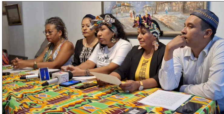
▲ Todavía hoy en Morelos reconocerte como una persona negra sigue teniendo una carga negativa, lamentaron los integrantes de la comunidad afro morelense.

Afirmó que la sociedad debe ver a las personas afro desde una perspectiva más amplia, reconociendo sus contribuciones históricas y actuales al desarrollo del estado.