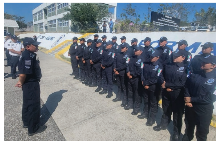
▲ Temixco es el municipio con el mayor número de elementos operativos graduados en la Academia de Estudios Superiores en Seguridad Pública.