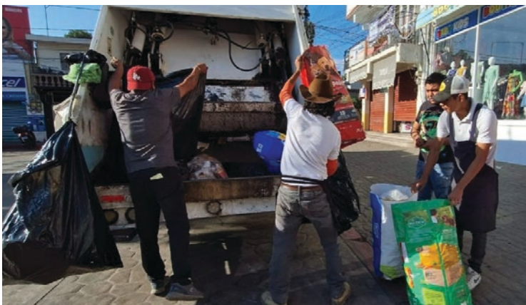
▲ Desde el año 2019 la administración municipal proporciona el servicio de forma gratuita, recolectando en promedio 140 toneladas de residuos sólidos diariamente.