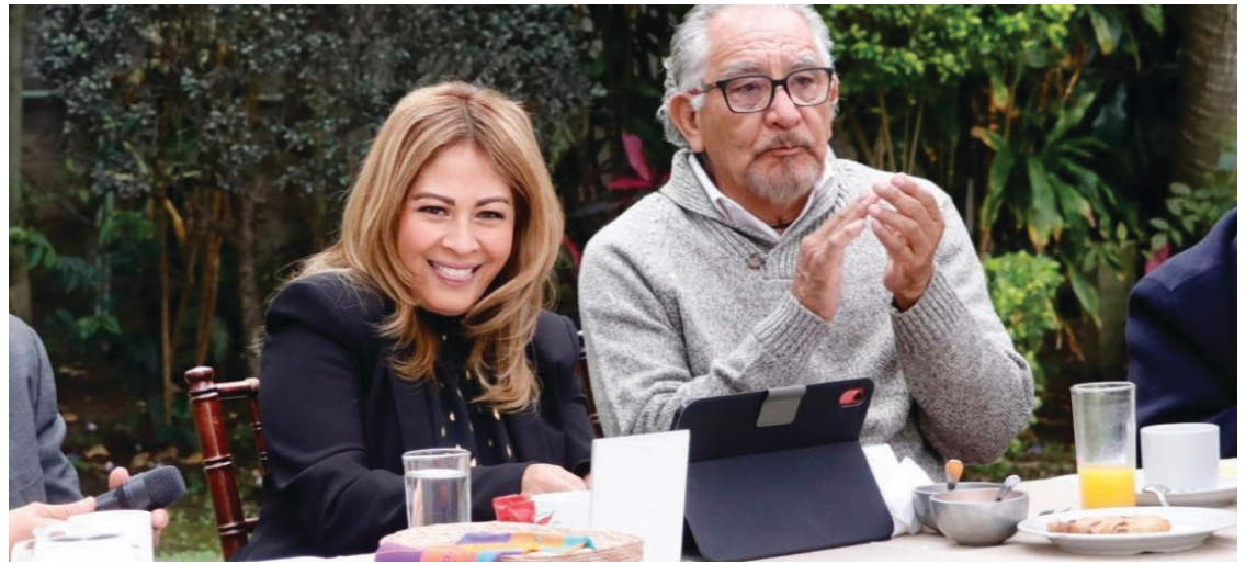
▲ “Nuestro proyecto está abierto para todos los morelenses”, aseguró la senadora Lucy Meza.