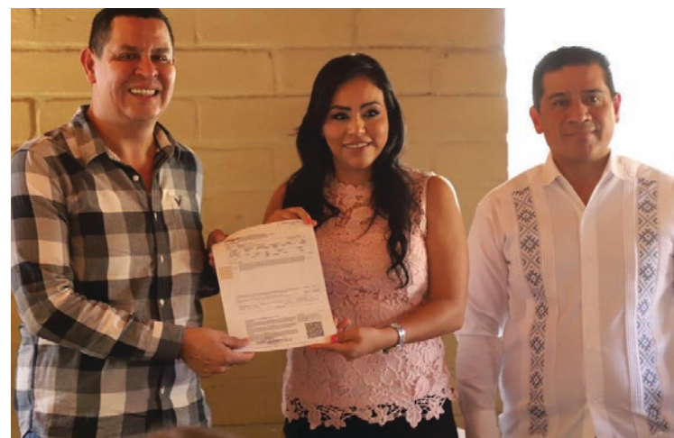
▲ La Casa Ecológica de los Maestros de Tlatenchi se pondrá al servicio de los vecinos de la unidad habitacional en cuanto sea rehabilitada.