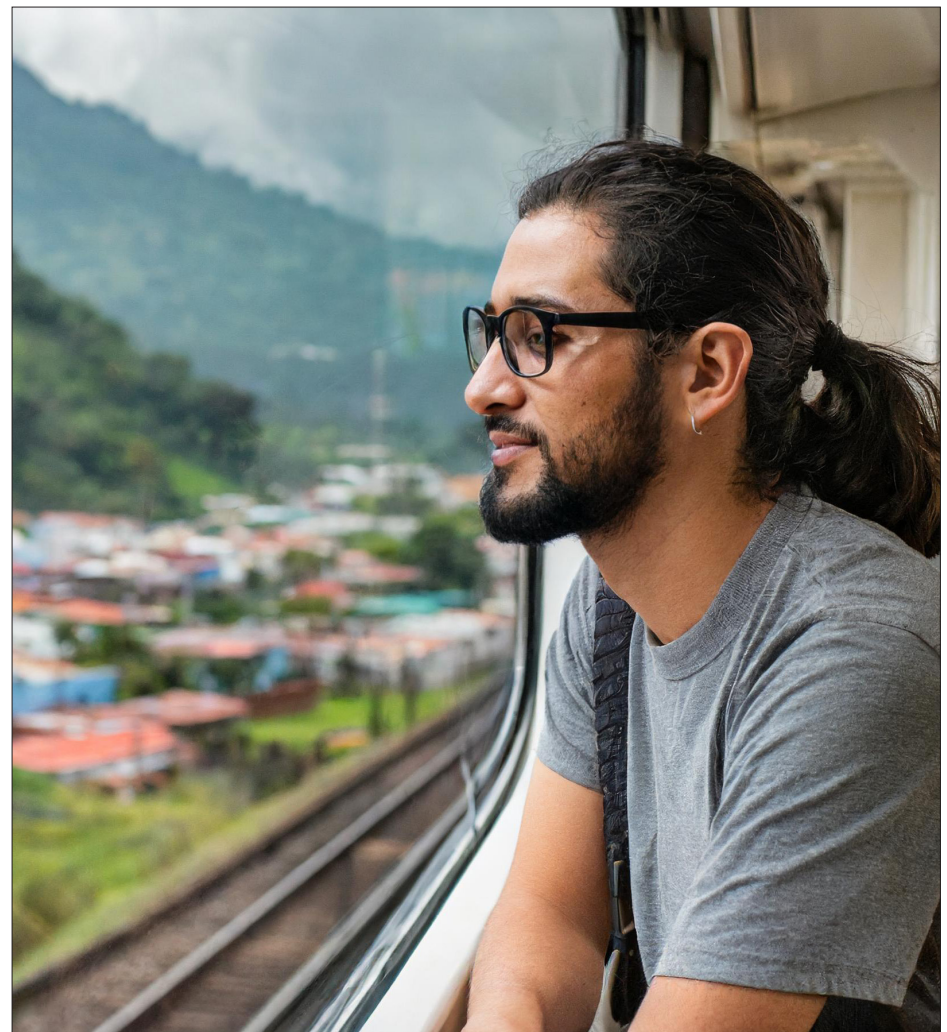
▲ Ilustración: Hannibal Martínez

Si pudiera la recorrería completa, la pampa con los gauchos en gallardos ca-