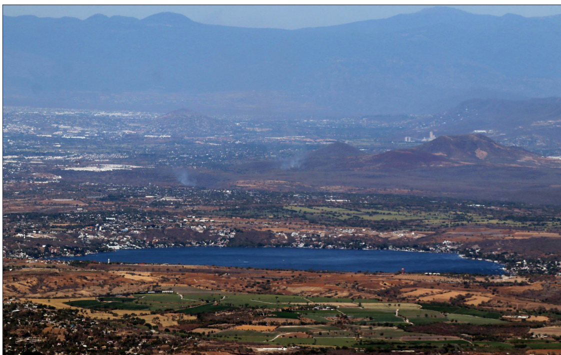
▲ En el lago se encuentran dos municipios y cuatro ejidos

*Padre de familia, político y sodaador en busca siempre de un mejor Morelos para todos.