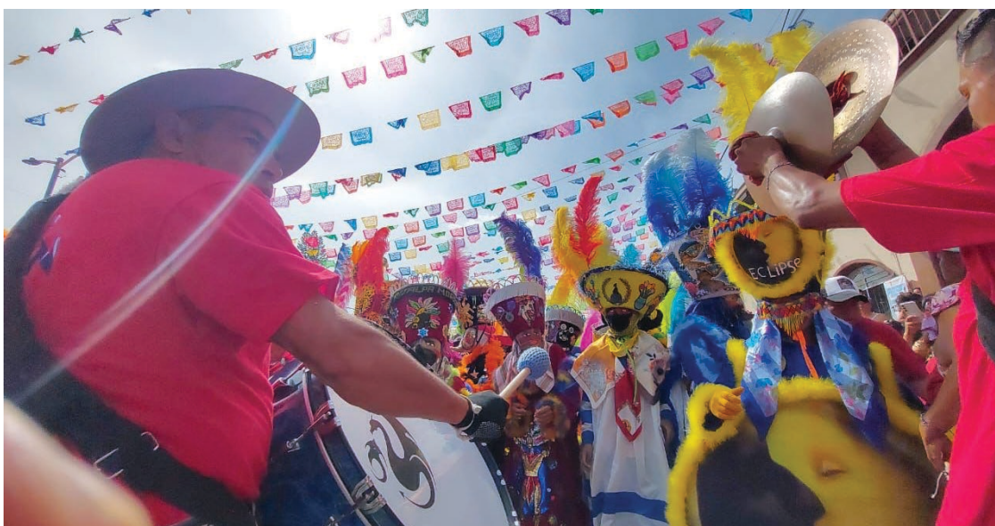
▲ Fue un éxito el Carnaval de Jiutepec y cerró con saldo blanco, informó el presidente municipal Rafael Reyes.

“El Carnaval de Jiutepec no solo se erige como un éxito festivo, sino también como un ejemplo de gestión y organización, dejando a la comunidad satisfecha y en espera de futuras ediciones”, apuntó.