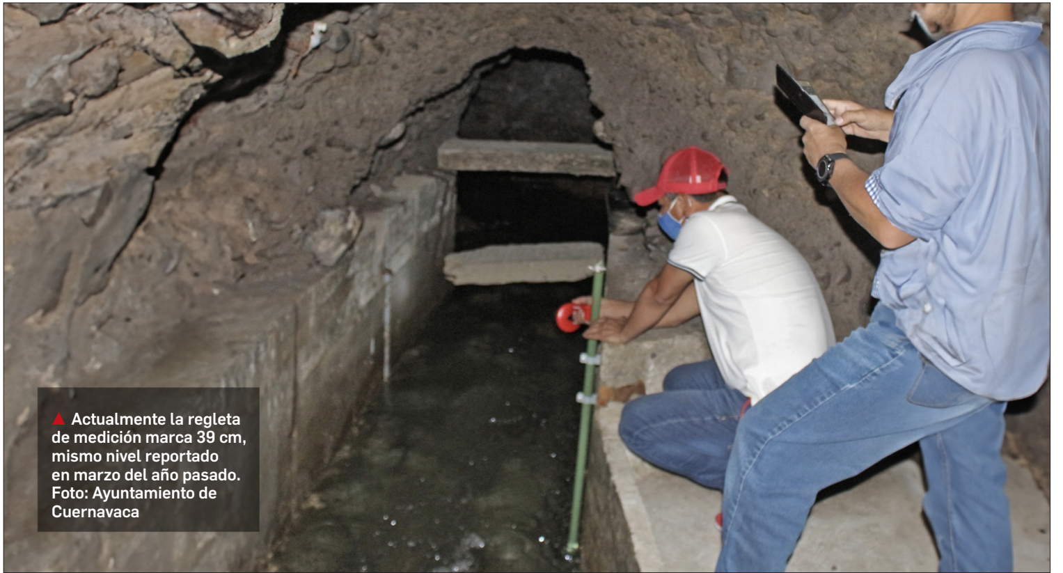
▲ Actualmente la regleta de medición marca 39 cm, mismo nivel reportado en marzo del año pasado.