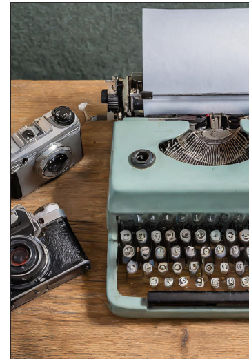
▲ Ilustración: Hannibal Martínez

Y así, a lo largo de mi quehacer periodístico corrí con mucha suerte, mucha tenacidad y muchas ganas de crecer. Como cuando en mis inicios en el Diario, un día que cubrimos la gira del entonces embajador de la República Popular China en México, hacía poco más de una década en que ambos países habían establecido relaciones. Al término,