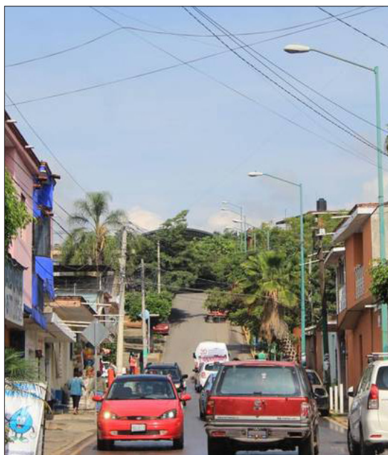
▲ Colonia Antonio Barona.

“El asunto de Derechos Humanos algunas personas lo utilizan para frenar los actos de la policía