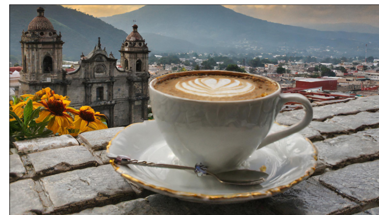
▲ Ilustración: Hannibal Martínez

* Licenciado en Psicología por la Universidad Autónoma del Estado de Morelos. Contacto: freudconcafe@gmail.com