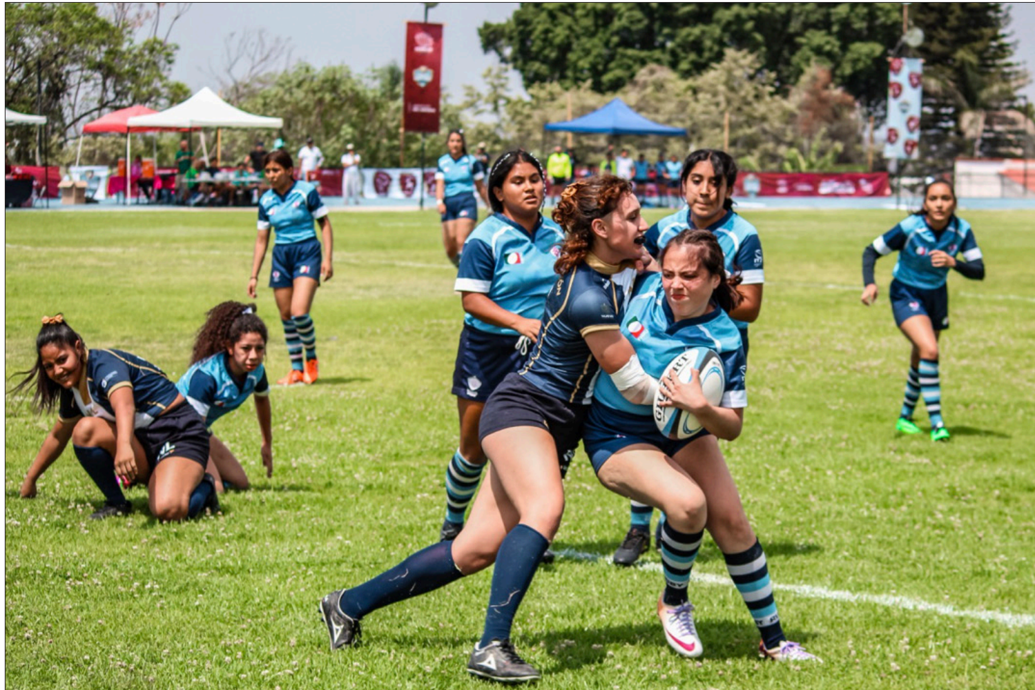
▲ La selección de rugby de Morelos está en etapa de formación y por ello busca hombres y mujeres de entre 14 y 19 años para las pruebas en que se elegirá a los mejores atletas del estado en este apasionante deporte. / LA JORNADA MORELOS / P 11 / Foto: Indem