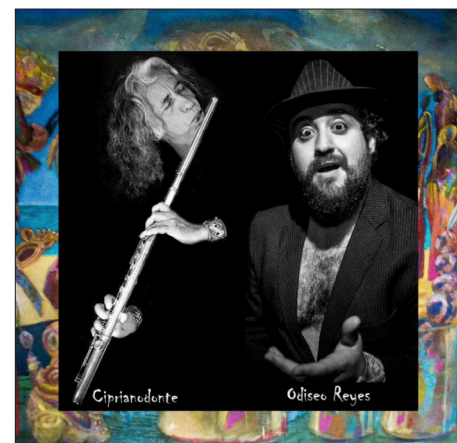
▲ Universonoro, Ciprianodonte