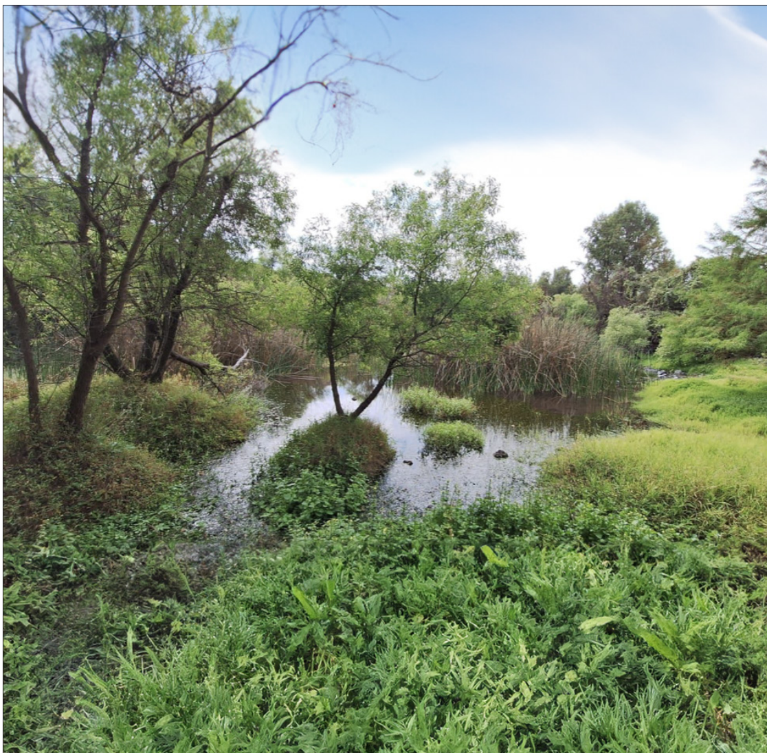
▲ La Laguna de Hueyapan y el manantial "Las Fuentes" registran niveles históricamente bajos.