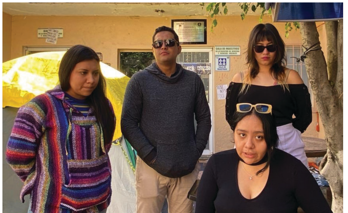
▲ Miembros de MEU durante el plantón de protesta.