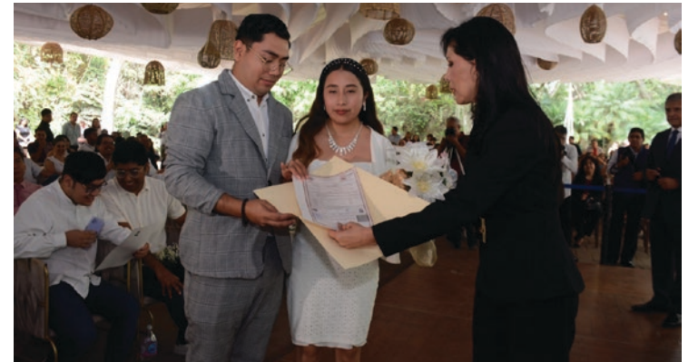
▲ Por cuarta ocasión en la actual administración, parejas mayores de 18 años podrán contraer matrimonio de manera gratuita y con todas las facilidades, gracias a una iniciativa del Sistema Municipal DIF.