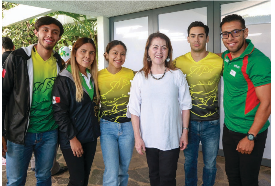
▲ Con trabajo y honestidad, el sector deportivo debe ser considerado en el desarrollo de la entidad, afirmó.