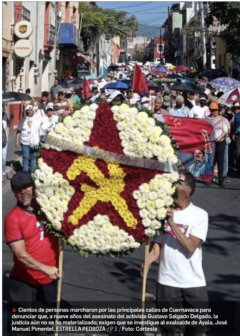
▲ Cientos de personas marcharon por las principales calles de Cuernavaca para denunciar que, a nueve años del asesinato del activista Gustavo Salgado Delgado, la justicia aún no se ha materializado; exigen que se investigue al exalcalde de Ayala, José Manuel Pimentel. ESTRELLA PEDROZA / P 3 / Foto: Cortesía