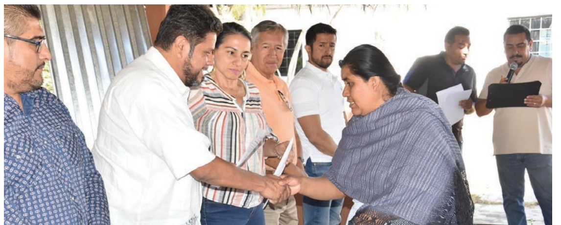
▲ El apoyo a 43 artesanos de la comunidad de Cuentepec proviene del Fondo de Aportaciones Estatales para el Desarrollo Económico (FAEDE) y consistió en una inversión de 200 mil pesos.