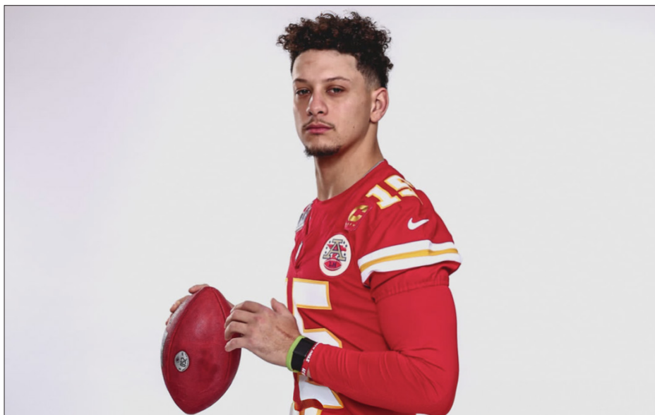
▲ El próximo domingo podríamos ver al primer equipo bicampeón de los últimos 18 años. En la foto, el quarterback de los Chiefs, Patrick Mahomes.

Síguenos en nuestras redes sociales: Revista End Zone en Facebook y @EndRevista en X.