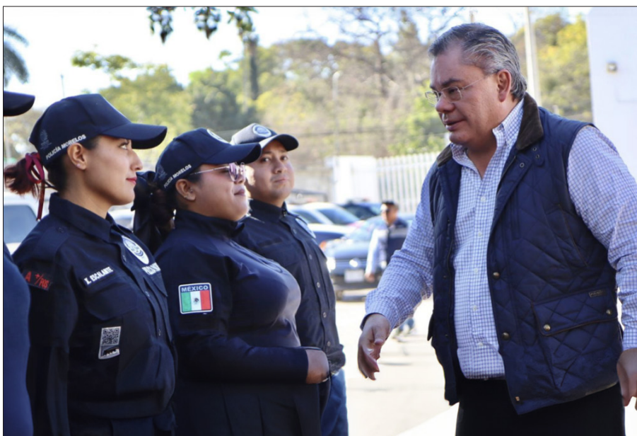
◀ El alcalde Rafael Reyes convocó a los nuevos elementos a trabajar para salvaguardar la integridad y los derechos de las personas.