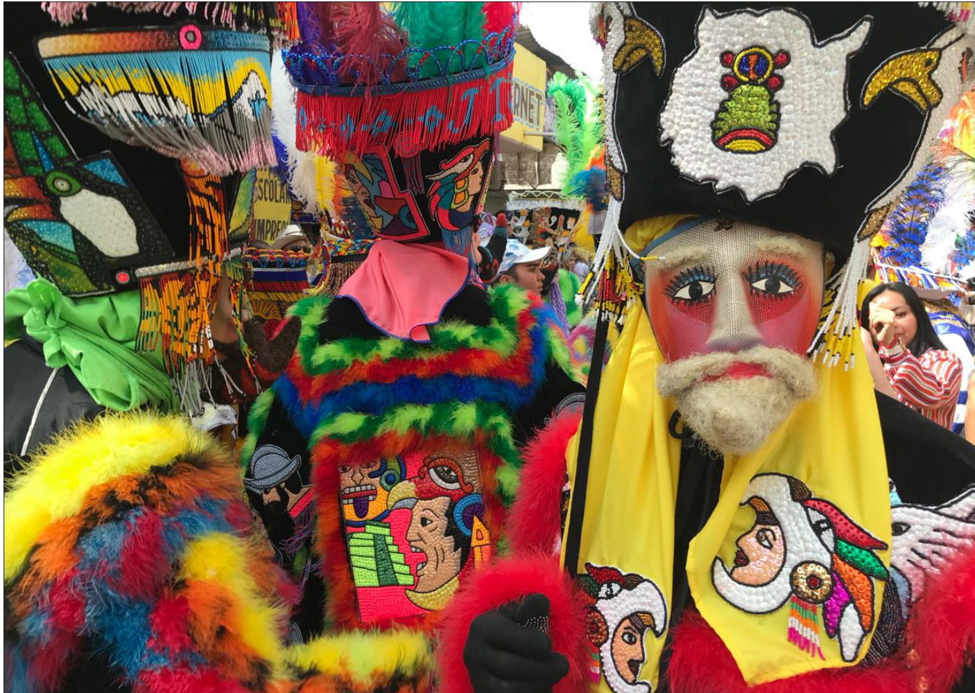
▲ Tras más de medio siglo, el Carnaval regresará a la capital del estado el próximo 13 de febrero con un desfile en el centro histórico. En la década de los setenta, Cuernavaca dejó de celebrar su Carnaval que este año será rescatado gracias a una iniciativa ciudadana. CLARA VIVIANA MEZA / P 6