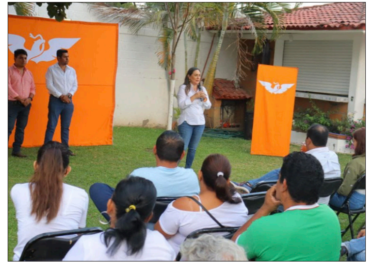
▲ Ortega resaltó que Movimiento Ciudadano es el proyecto político que más ha crecido en el país.