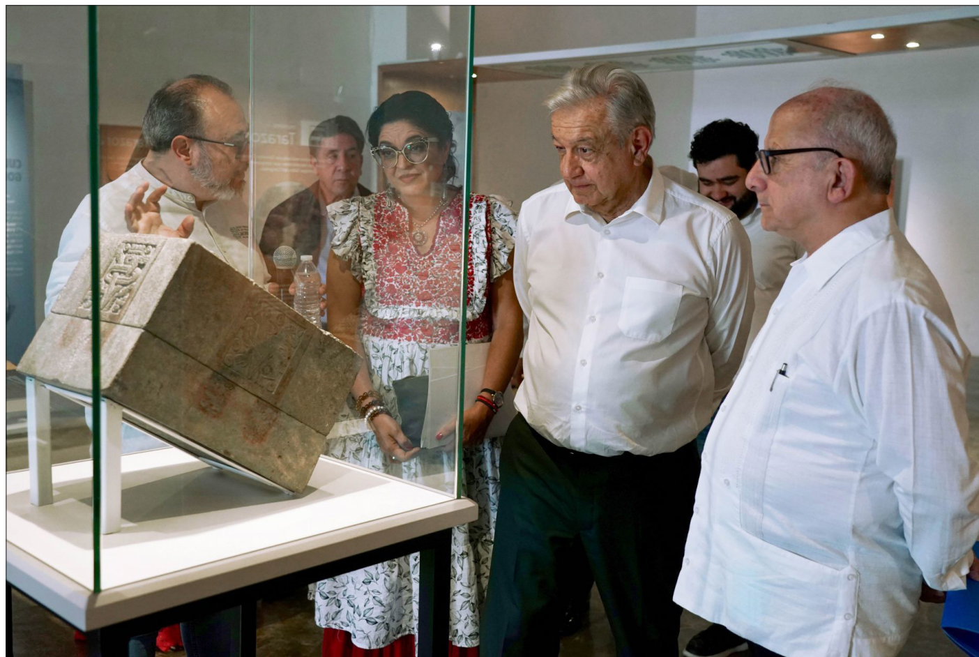
▲ El Presidente de la República, Andrés Manuel López Obrador, visitó Morelos para reinaugar los murales de Diego Rivera y a supervisar la rehabilitación del Palacio de Cortés en Cuernavaca. El INAH prometió terminar los trabajos de rescate de los edificios históricos dañados por el terremoto del 17 antes de que concluya el sexenio. ANGÉLICA ESTRADA / P7

“Ni temblores, ni pandemias nos han detenido”