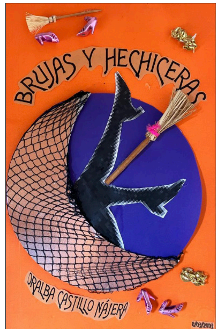
▲ Presentación del libro "Brujas y Hechiceras", editorial Cartonera de Cuernavaca. Sábado 24 de febrero, 13 hrs., en La Bigotona

En Cuernavaca la única publicidad callejera permitida son los anuncios espectaculares, luminosos, y los letreros de denominación para los negocios, todos ellos deben contar con autorización del ayuntamiento.