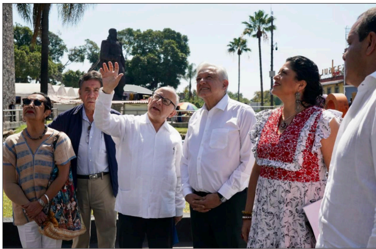
▲ Durante su visita a Cuernavaca, el Presidente de la República inauguró los murales de Diego Rivera en el Museo Regional de los Pueblos de Morelos y comprobó la rehabilitación realizada al edificio histórico.

El documento fue firmado por el Consejo Promotor de la Iniciativa Legislativa para crear el Municipio Indígena de Alpuyeca y la comunidad indígena de Alpuyeca, Morelos.