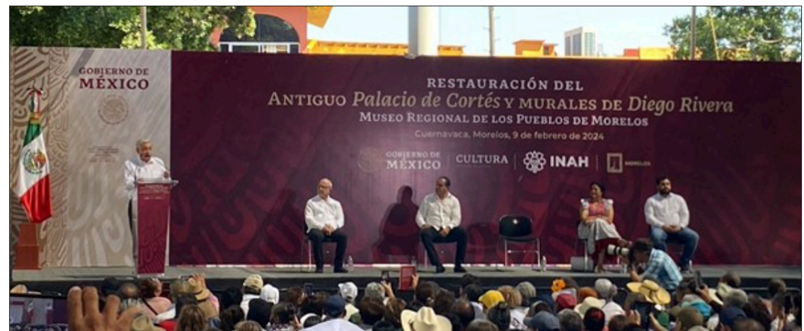
▲ “La transformación continuará”, aseguró el Presidente de la República, y señaló que hará todo lo posible “hasta donde alcance, hasta donde yo pueda, y dejaremos la tarea a quien nos suceda, para que continúe haciendo justicia”.

El siguiente en hablar es Diego Prieto Hernández, Director General del Instituto Nacional de Antropología e Historia (INAH), quien recuerda los estragos causados por los terremotos de 2017. Rememora la devastación sufrida por el patrimonio cultural y destaca el esfuerzo conjunto del gobierno y las autoridades locales para la recuperación. Con orgullo, muestra al presidente los logros alcanzados y resalta la restauración del Palacio y la preservación de la identidad histórica de Morelos.