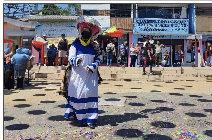
▲ En Emiliano Zapata quieren quemar el mal humor con Chinelos. Su Carnaval genera una importante derrama económica al comercio del municipio.