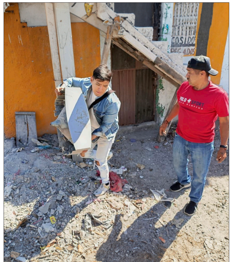
▲ Las jornadas de descacharrización en Temixco iniciaron en enero y ahora se extenderán a varias colonias más del municipio.