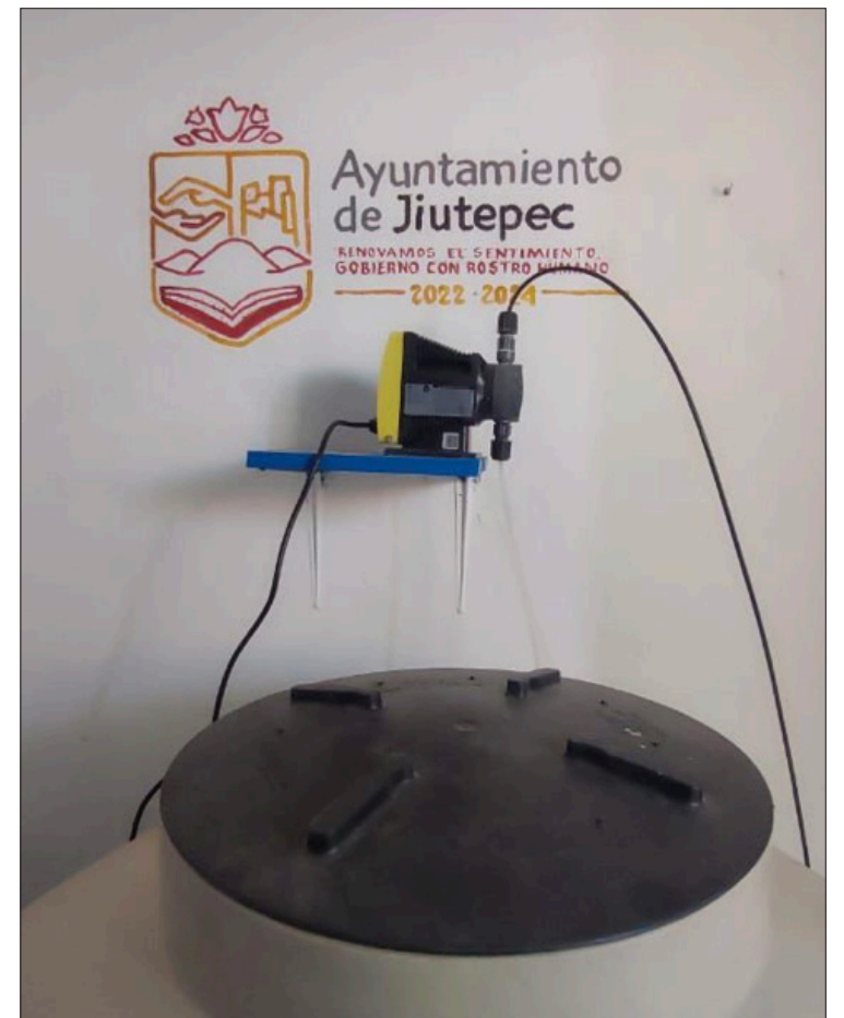
▲ Se instalaron 32 bombas dosificadoras de cloro en Jiutepec, en la imagen una de ellas.