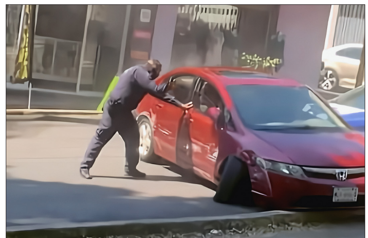
▲ La persecución se prolongó por algunos kilómetros y obligó al cierre de varias calles en la capital.