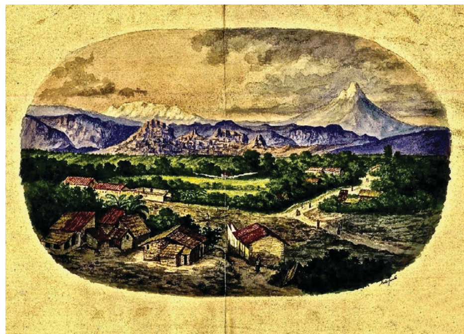
▲ Vista antigua del entorno de Cuernavaca.

por el cultural, natural y el mixto en convivencia con los asentamientos urbanos y rurales, preexistentes y futuros en el siglo XXI. Este concepto amplio nos permite incorporar, no solo el patrimonio arqueológico, histórico y contemporáneo, sino el actual y presente en la vida cultural y en su interacción de los grupos sociales, que lo producen y conviven con ella de manera cotidiana. El patrimonio es la actuación y la herencia pasada y presente de los grupos sociales. Debe ser valorado e integrado como parte de su ecosistema cultural y natural.