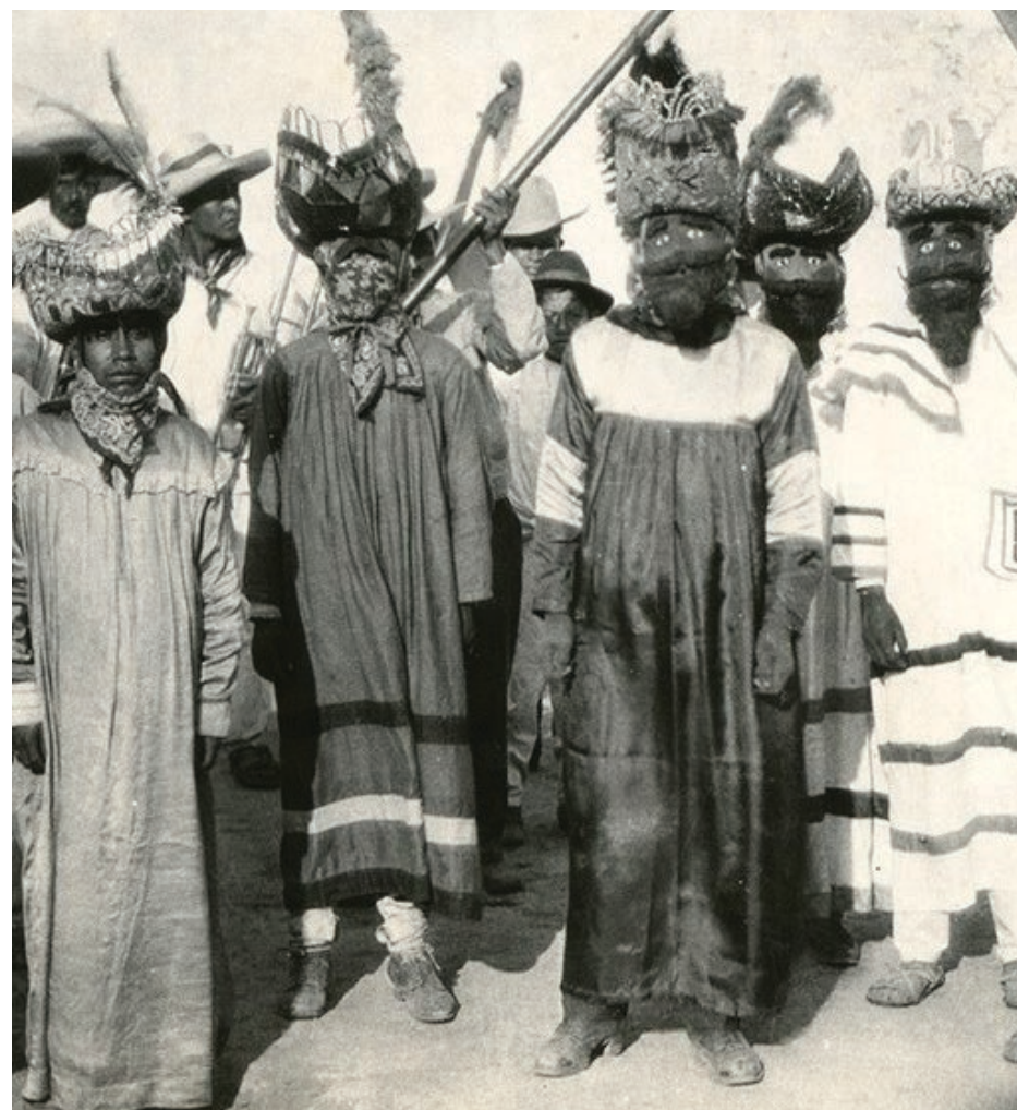
▲ Imagen: Chinelos de Atlatlahucan (fragmento); 1931.

En el artículo titulado El Carnaval en Francia, y publicado en el Semanario de las Señoritas Mexicanas —1 de enero de 1842—, se hace referencia a un personaje del carnaval: polichinela, el cual es un individuo identificado por una joroba, aunque su origen etimológico “viene de dos palabras griegas que significan moverse mucho”. En México, la referencia más antigua del vocablo chinelo conocida es del periódico La Patria, el 22 de diciembre de 1909.