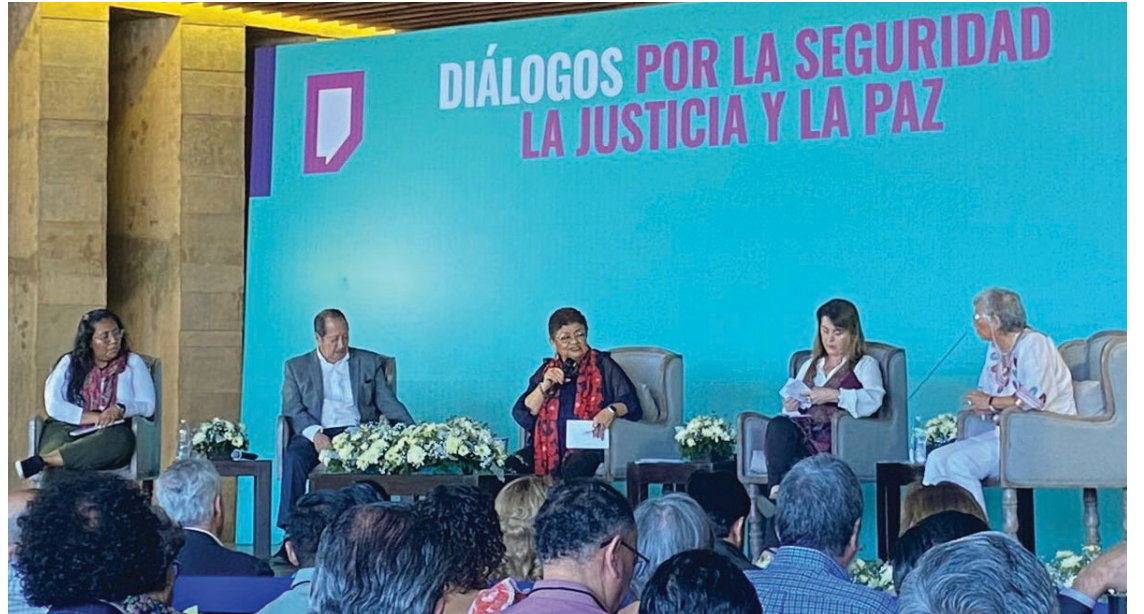
▲ Los "Diálogos por la Seguridad y la Paz", convocados por la Red M por Morelos, buscan abordar los desafíos de seguridad y justicia en nuestro estado.