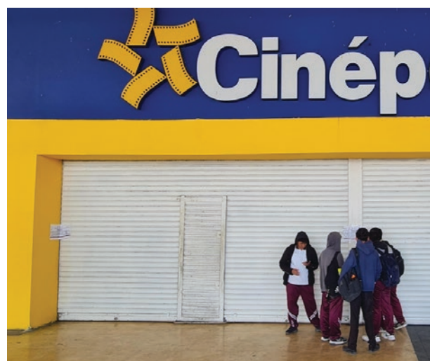
▲ En el sur se quedarán sin cine por el momento.

Al ser la única opción de cine en esta zona sur del estado de Morelos, hubo quienes, en su mayoría jóvenes, que ya se preparaban para ver la película ya escogida para este jueves, sin embargo, se encontraron con la cortina blanca del acceso principal y recepción del cine instalado junto con la citada bodega comercial en el trienio gubernamental local 2003-2006.