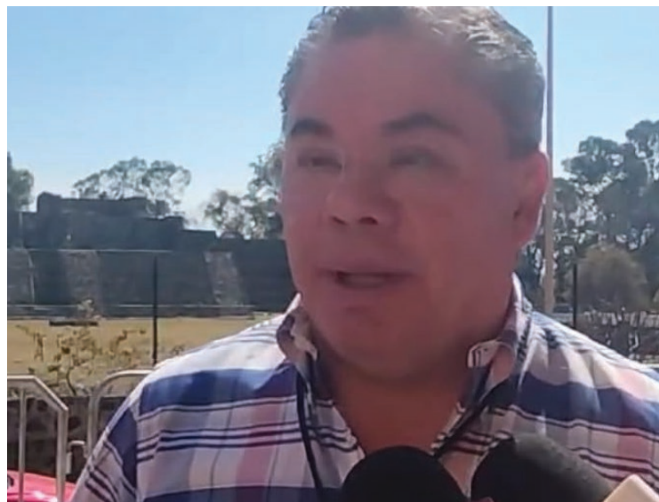
▲ El edil de Jiutepec externó su respeto a todas las personas que fueron nominadas "entendiendo que el partido debió haber hecho un análisis muy profundo sobre las personas que aparecen tanto en las listas como en las candidaturas".