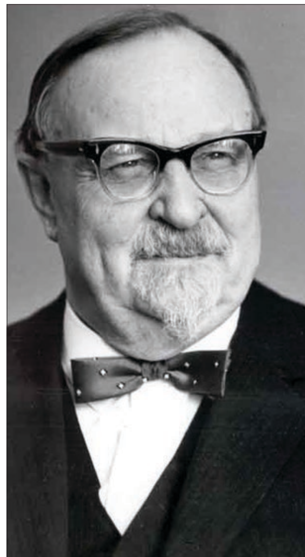
▲ Alexander Oparin.

El desarrollo tecnológico reciente para encapsular moléculas de ARN auto-replicantes y autocatalíticas en membranas lipídicas, similar a cómo se hacen las vacunas contra el COVID-19, ha redefinido nuestro enfoque experimental sobre el origen de la vida, llevando a nuevas perspectivas que Oparin, quizás, habría contemplado con gran expectación. La idea seminal de Alexander Oparin hoy nos permite tener una ventana al más remoto pasado, y probar experimentalmente los elementos que juntos pudieron conducir a la expresión de la vida tal como la conocemos.