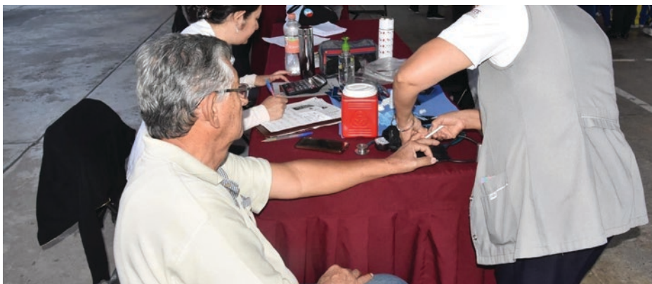
▲ Entre los servicios que se ofrecieron en la Feria se encuentran detección de enfermedades crónico-degenerativas, pruebas de glucosa, pruebas de antígeno prostático y un esquema de vacunación completo.