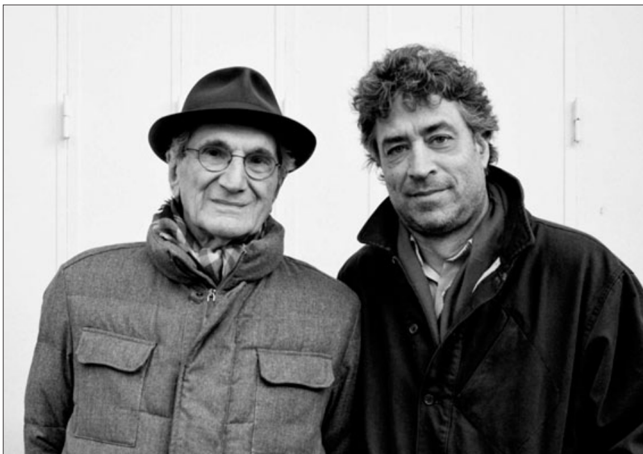
▲ Toni Negri y Michael Hard

4. Y, en todo caso, defender una Globalización de Derechos y de oportunidades en la que cada cual pueda desarrollar su singularidad.