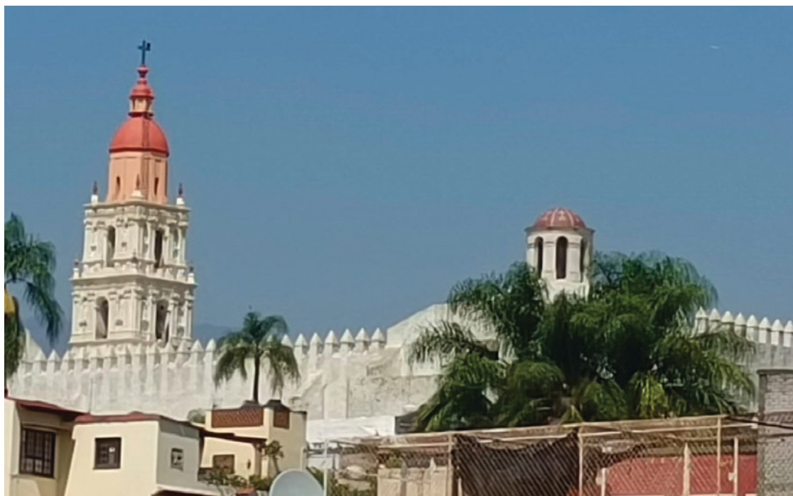
▲ “En unas semanas” concluirán los trabajos de rescate de la Catedral de Cuernavaca tras años de trabajo. El INAH dice sentirse orgulloso de los trabajos de reconstrucción.

La Catedral de Cuernavaca es un edificio del siglo XVI (fue concluida antes de 1574) que fue erigido para ser el Convento de la Asunción de María. Se trata de un conjunto arquitectónico formado por una capilla abierta, y las de la Santa Cruz, de Dolores, del Carmen y de la Tercera Orden. En el sismo del 19 de septiembre de 2017, la nave mayor de la Catedral sufrió daños, particularmente en su campanario. La restauración tomó varios años y se fue abriendo paulatinamente.