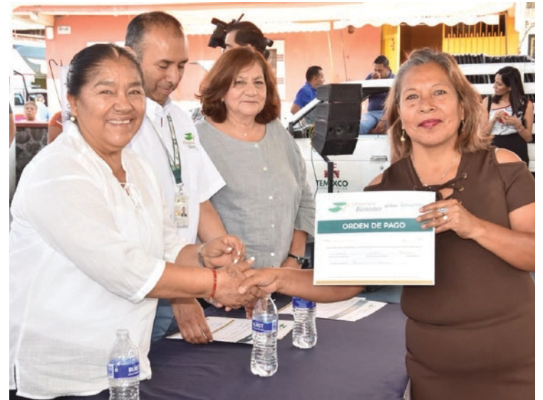
▲ Los créditos se conceden por periodos de 6 a 12 meses sin intereses, están destinados a fortalecer los proyectos de emprendedores locales.