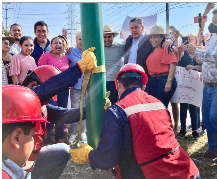
▲ La obra consiste en la instalación de 98 postes y 196 luminarias.

La obra contempla la instalación de 98 postes de nueve metros de altura, cada uno con un doble brazo metálico de dos