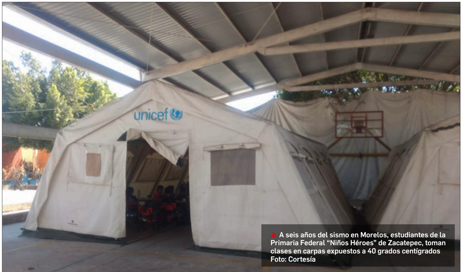
▲ A seis años del sismo en Morelos, estudiantes de la Primaria Federal “Niños Héroe” de Zacatepec, toman clases en carpas expuestas a 40 grados centígrados

Entre los municipios, cuyas escuelas de nivel básico solicitan techumbre son Jojutla, Zacatepec, Tlaquiltenango, Amacuzac, Puente de Ixtla y Xochitepec.