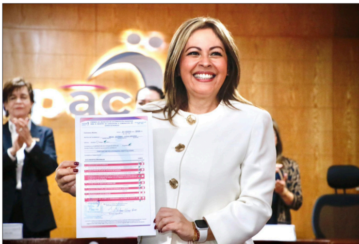
▲ “No somos ni sumisos ni obedientes, nos rebelamos a las injusticias, a las imposiciones y a los abusos del poder”, aseguró la senadora al recibir su constancia.

También señaló que las puertas de la coalición están abiertas para quienes decidan abandonar otros proyectos políticos: “claro que todas y todos son bienvenidos para construir un gran estado”.