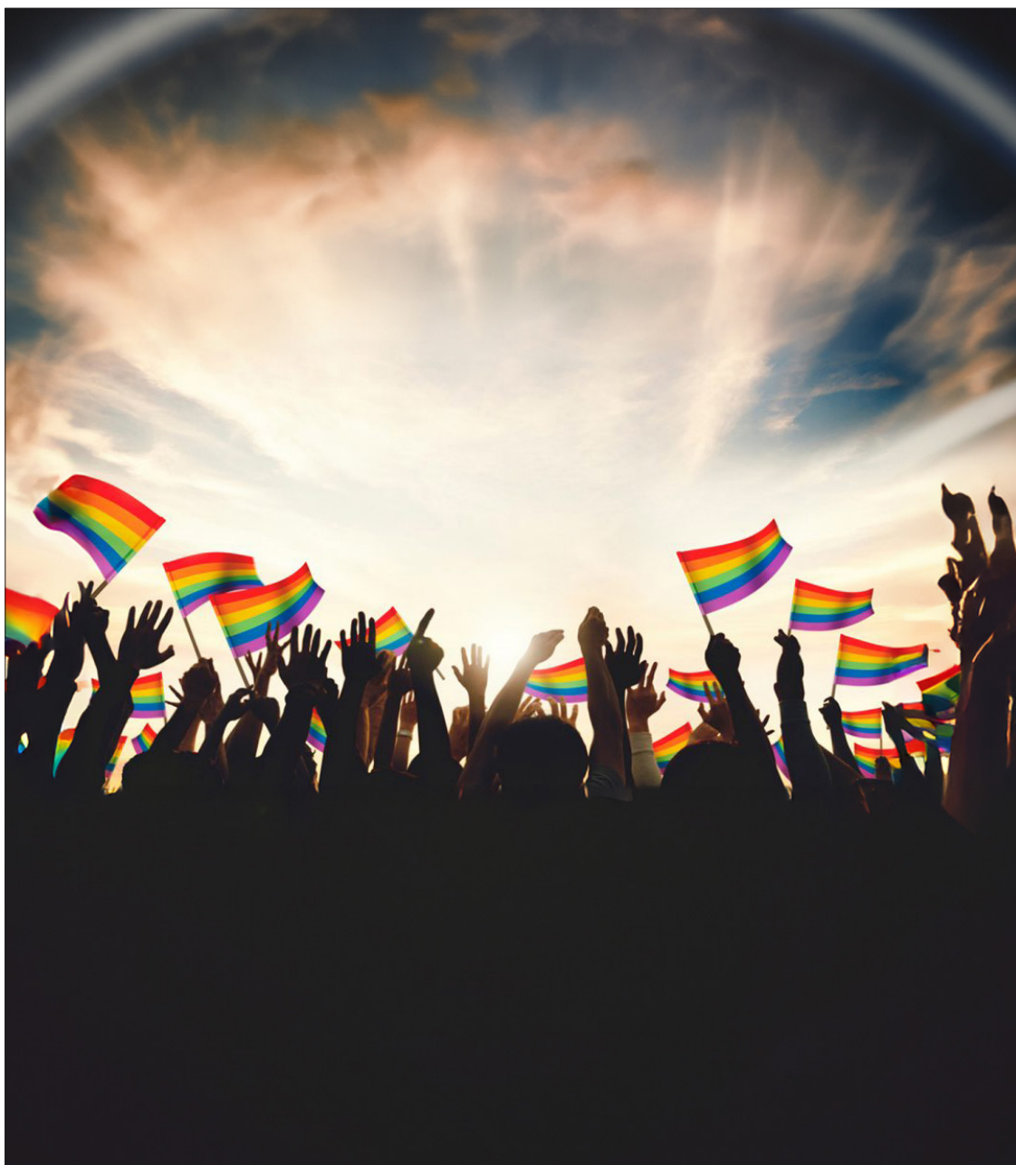
▲ Ilustración: Hannibal Martínez