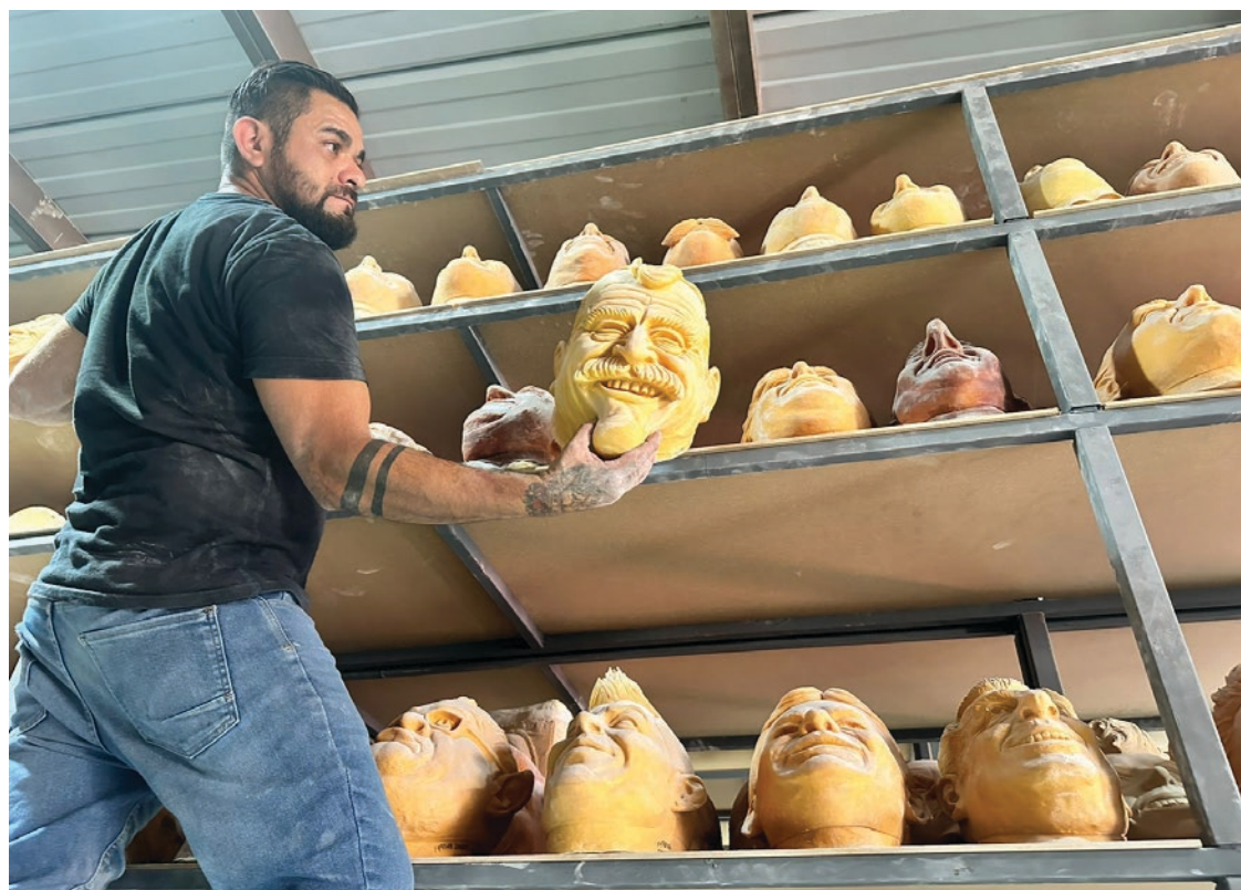
▲ En Grupo Rev ya hay toda una galería de máscaras políticas.

Añadió: “entonces fuimos muy cuidadosos para que ambos productos no fueran utilizados con tintes de violencia, más bien este nuestro espíritu de la fábrica y sus productos es buscar que los clientes los utilicen para el esparcimiento sano”.