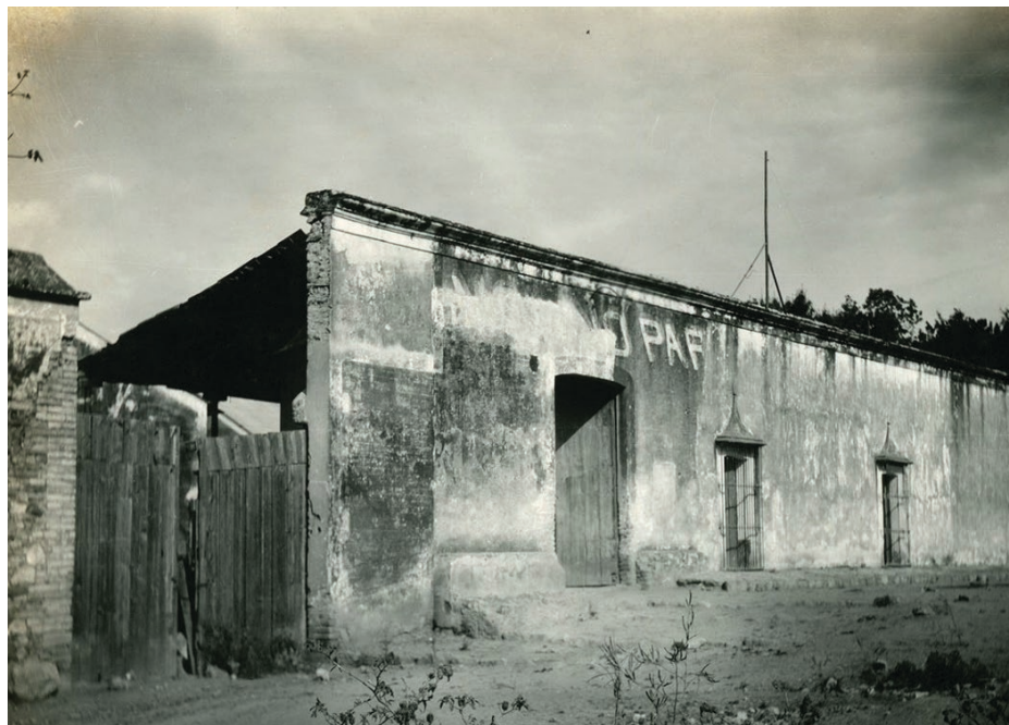
▲ Imagen: Antigua Cuartel del Ejército Libertador del Sur; Tlaltizapán, Morelos (fragmento); ca. 1930.