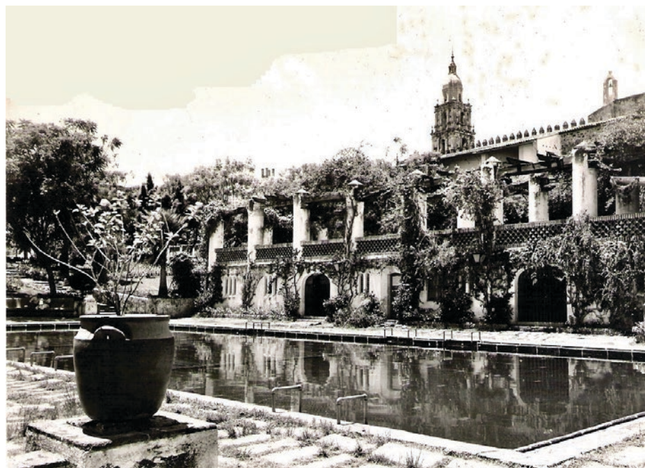
▲ Parque Revolución, Cuernavaca, Morelos.

7. Caminos viejos de la ciudad para un mejor diseño de caminos peatonales interpretativos y de las perspectivas visuales de la ciudad, desde diversos sitios.