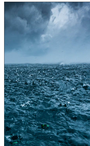
▲ Imagen: Getty Images

La corriente termohalina, la cual conduce calor, humedad y nutrientes del Ecuador hacia los polos —y de la cual la AMOC es tan sólo una parte— corres-