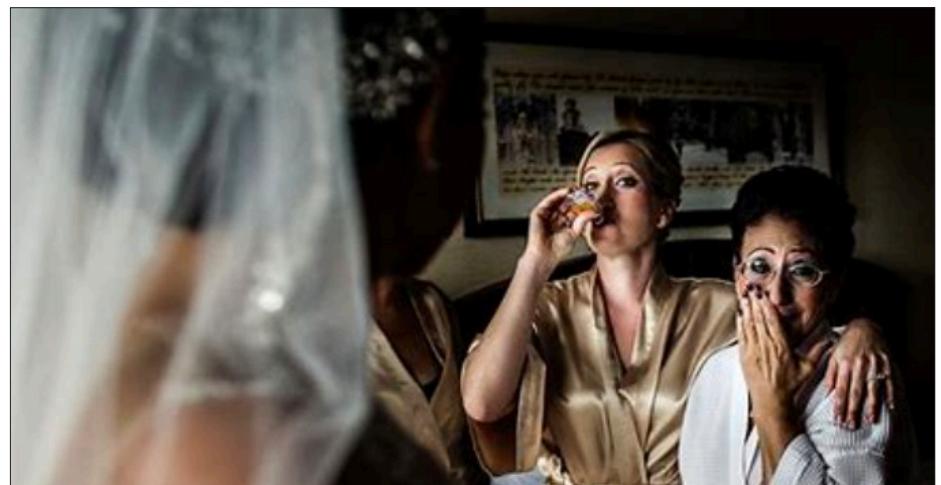
▲ Imagen: Cortesía de la autora

Porque hay amores que vivirán por siempre en nuestro corazón, aunque ya no estén en nuestra vida.