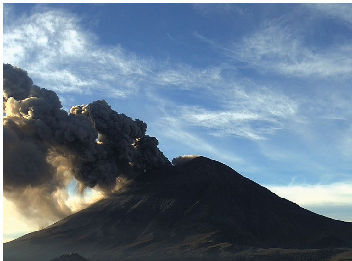
▲ No hay motivos de alarma por la reciente actividad de Don Goyo, confirma Protección Civil.

A finales de 2023, el Popocatepetl comenzó una serie de erupciones menores, acompañadas de sismos locales y una lluvia de polvo y ceniza que afectó la zona metropolitana de Puebla. Desde entonces, ha mantenido un nivel de actividad que las autoridades continúan clasificando como normal.