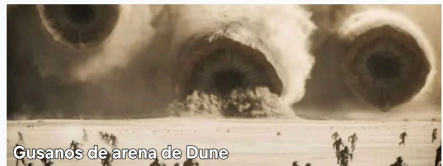
Gusanos de arena de Dune