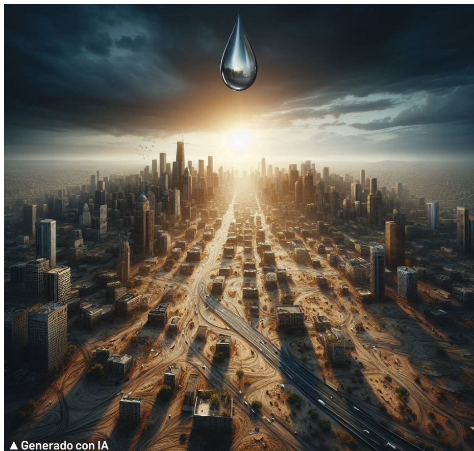
▲ Generado con IA

La crisis del agua en la CDMX requiere una respuesta coordinada y colaborativa entre diferentes actores, incluidos el gobierno en sus distintos niveles, el sector privado, la sociedad civil y la comunidad científica. Es necesario establecer mecanismos de coordinación y gobernanza que fomenten la participación de todos los interesados en la toma de decisiones relacionadas con el agua. Solo a través de un enfoque integral y colaborativo podemos garantizar el acceso equitativo y sostenible al agua para las generaciones presentes y futuras.