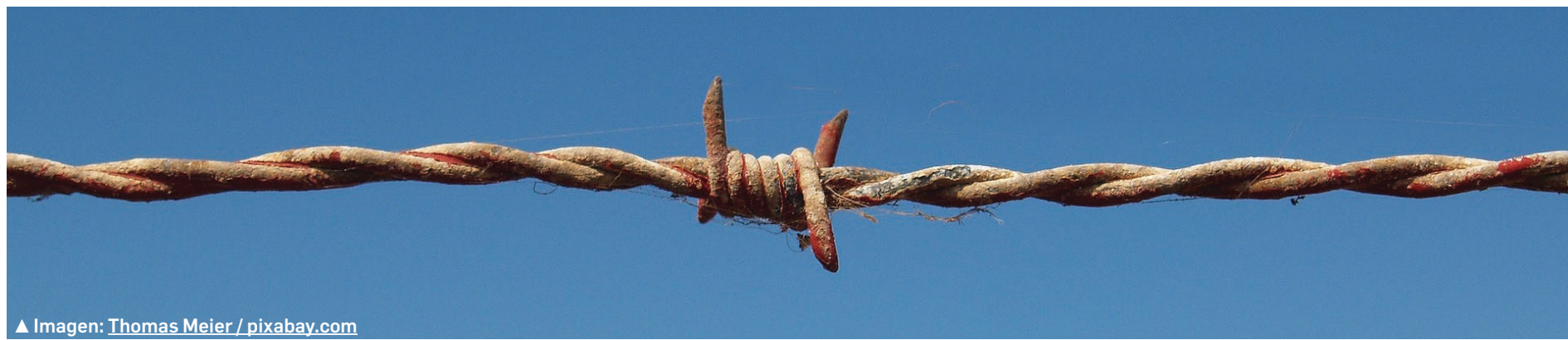
▲ Imagen: Thomas Meier / pixabay.com

*Milpaltense, internacionalista, escritor y migrantólogo.