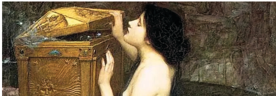
imagen y semejanza, vio que estaba solo, y decidió darle una compañera, e hizo a la mujer. Esta primera pareja vivió en un edén, sin embargo, Dios, puso una condición: “no comerán los frutos del árbol prohibido”

EVA. En el libro del “Génesis”, se narra que el Creador, después de hacer al hombre a su