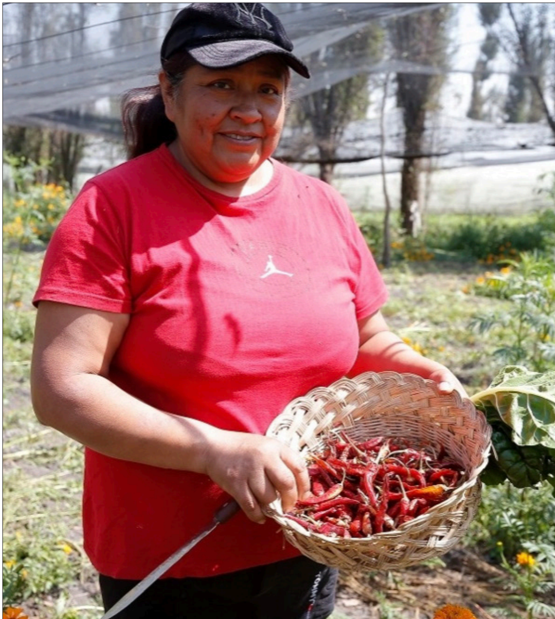
▲ Mujeres campesinas trabajan la tierra desde que sale el Sol hasta que se oculta.

En un comunicado indicó que el organismo espera que estos proyectos contribuyan de manera transformadora al empoderamiento económico y social de las mujeres rurales, al desarrollo inclusivo en las zonas rurales, la adopción de tecnologías innovadoras, incrementando la sostenibilidad ambiental y resiliencia ante el cambio climático. Permitiendo a la región avanzar hacia sistemas agroalimentarios con mejor producción, mejor nutrición, mejor medio ambiente y una vida mejor, mencionó.