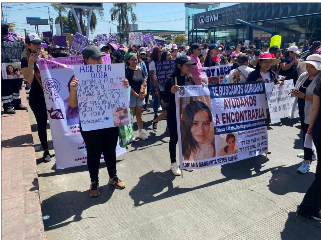
▲ La Jornada Morelos

Este 8 de marzo de 2024, se hizo evidente que la violencia de género y el feminicidio sigue siendo una realidad urgente que debe abordarse de manera prioritaria. La presencia de familiares de víctimas, mujeres trans, ciclistas, artistas y muchas otras mujeres que marchan juntas demuestra la fuerza y la determinación de un movimiento diverso y unido. En Día Internacional de la Mujer, las calles de Morelos resonaron con la voz de miles de mujeres que exigieron un cambio real y tangible hacia un futuro más justo y seguro para todas.