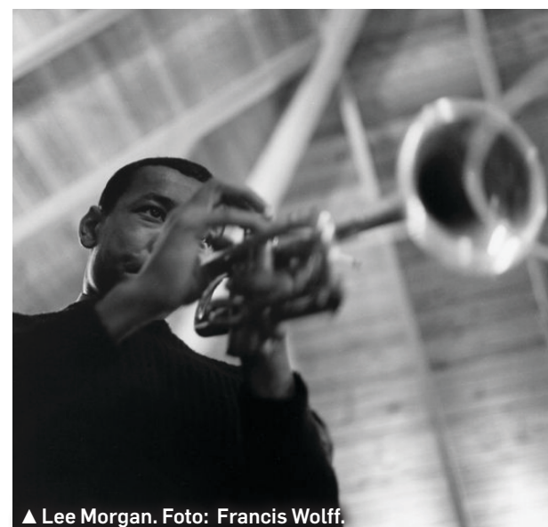
▲ Lee Morgan.