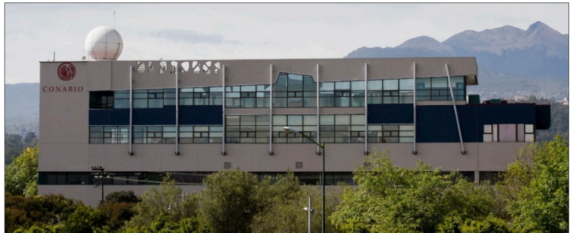
▲ Instalaciones de la Conabio, en la Ciudad de México.