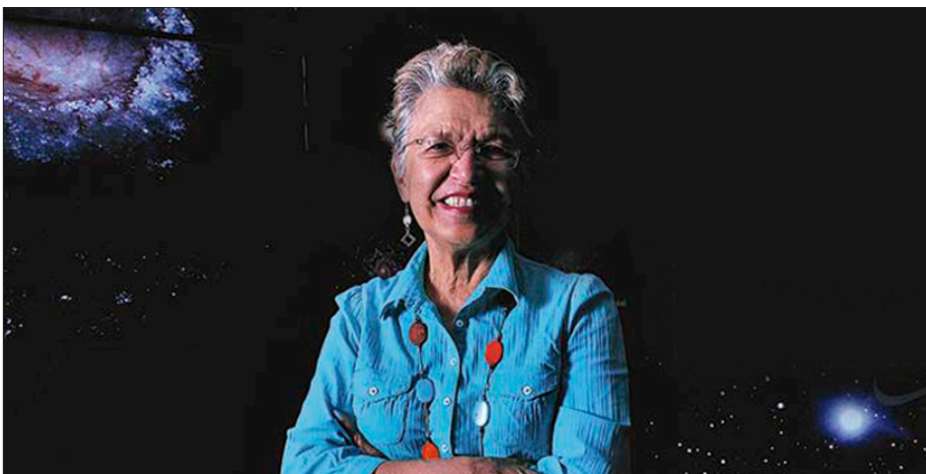
▲ Sylvia Torres-Peimbert.

En la pasada marcha del 8 de marzo en Cuernavaca, Morelos, el estado con más investigadoras e investigadores per cápita del país, tuve el honor de encontrarme a grandes científicas mexicanas que también luchan, sueñan y trabajan por un país mejor para todas las personas.