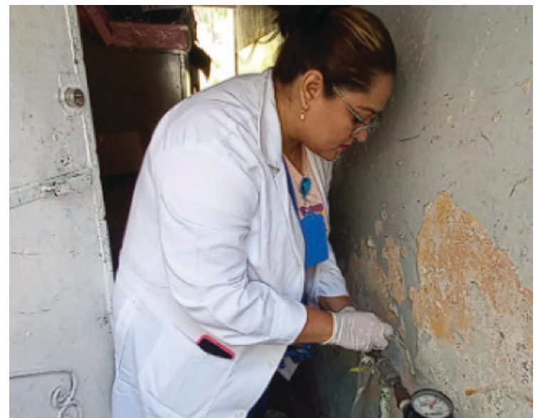
▲ La autoridad sanitaria validó la potabilidad del agua que se distribuye en la zona.

Esto debido a que, en días pasados, se reportó la presencia de olor y color, en el agua que llegaba a sus domicilios, por lo que, tras recibir dichos reportes, se actuó de manera oportuna realizando la supervisión de la zona, dando atención a la reparación de dos descargas sanitarias de particulares, así como tres ductos de agua potable, además de la entrega de pastillas de hipoclorito de calcio para reforzar la potabilidad del líquido en la zona.