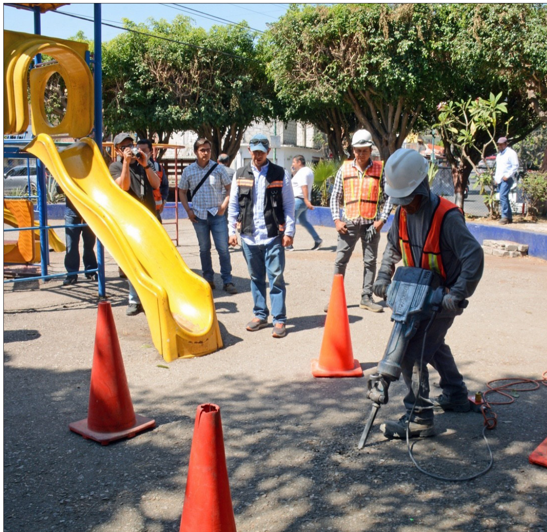
▲ El Ayuntamiento de Cuernavaca inició la rehabilitación de la segunda glorieta de la colonia Antonio Barona.

Para estos trabajos se tiene una inversión de cinco millones 141 mil 496.14 pesos de gastos de capital en municipios 2024.