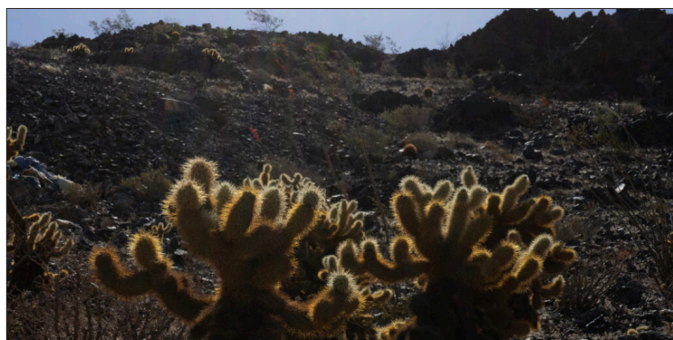
▲ Ejido El Bajío.

*Profesora de la Universidad Autónoma de la Ciudad de México