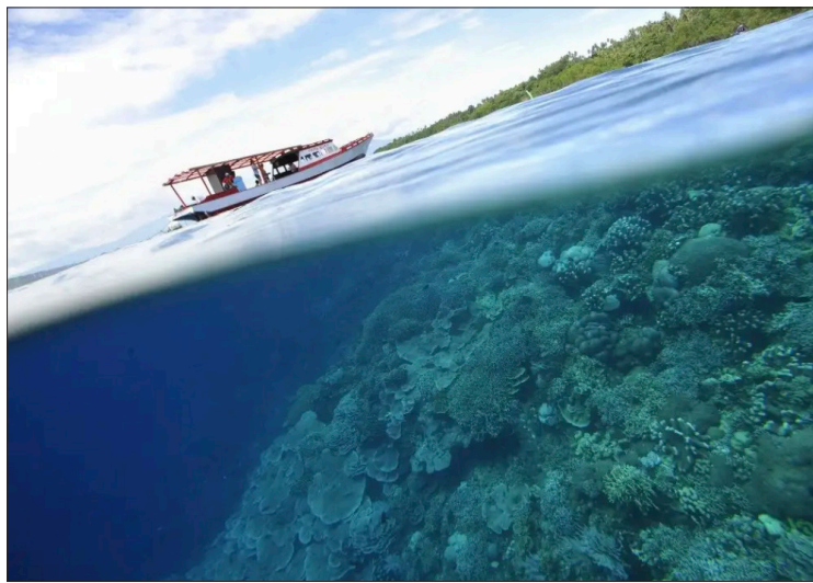
▲ Corales y manglares en el parque nacional marino protegido de la isla Bunaken en Manado, Indonesia, en 2006.

En un día normal de 2023, casi un tercio de los océanos se