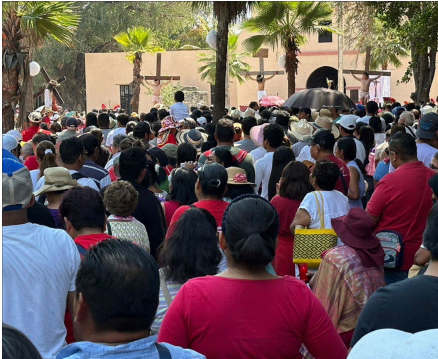
▲ Más de cuatro mil personas se concentraron la mañana de ayer en Jojutla, para ser testigos de la escenificación del viacrucis, una tradición que se realiza por décadas en esta cabecera de distrito y que, de acuerdo con la estimación de la iglesia católica, responsable del evento, duplicó la participación considerada el año pasado. / HUGO BARBERI RICO / P 12 / Foto: Hugo Barberi Rico / La Jornada Morelos