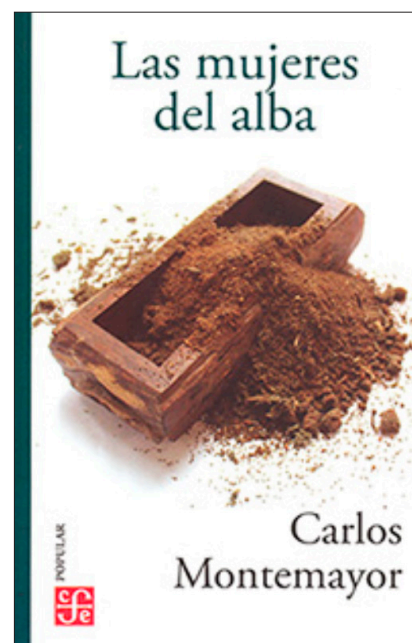
◀ Las mujeres del alba , Carlos Montemayor. Fondo de Cultura Económica, México, 2019.