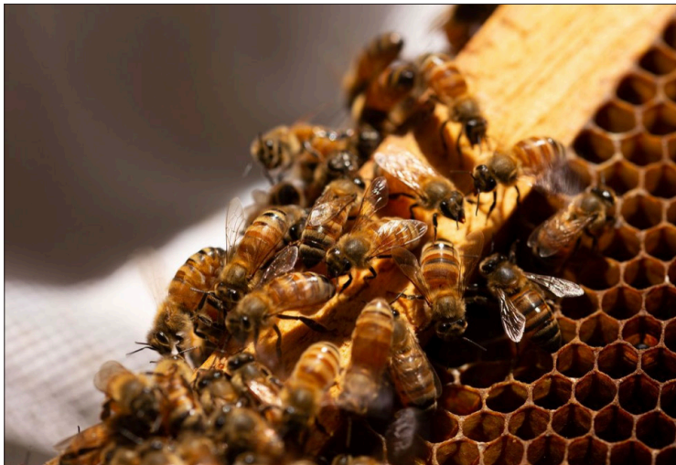
▲ El proyecto es liderado por estudiante de la maestría en Ingeniería Agrícola y Uso Integral del Agua (IAUIA) y podría ayudar a disminuir la cantidad de estrés generado a las abejas y aumentar su proliferación.

La casa de estudios informó que se mantendrá el apoyo universitario para avanzar en la investigación y