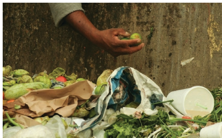
▲ Pepena de alimentos desechados en la Central de Abasto, en la Ciudad de México.

El informe, elaborado junto a la organización sin fines de lucro WRAP, es el segundo sobre el desperdicio global de alimentos compilado por la ONU.