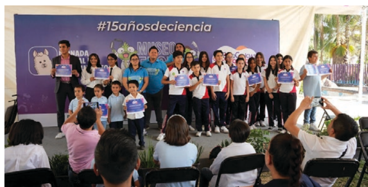
▲ En la Expociencias Morelos 2024 participaron 46 equipos de diversas instituciones educativas del estado, desde el nivel preescolar hasta el superior, con edades comprendidas entre los 5 y los 24 años.