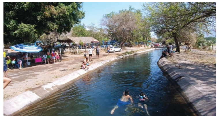
▲ Los canales de riego de Tlaltizapán también atraen a los visitantes.

Santa que se dio en coordinación con las autoridades referidas, estatales y federales con el ayuntamiento que preside.