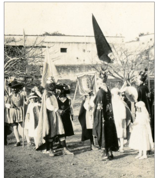
▲ Carlomagno y los 12 Pares de Francia. Reto de 4 noches; Atlatlahucan (fragmento); 1931.

Esta “representación escénica tradicional” es resultado de dos elementos fundamentales: la comunidad y la religiosidad. En una entrevista realizada (2022) a un joven de la colonia Tres de Mayo, en Xochitlán, a pregunta expresa sobre su motivación para interpretar el papel de moro confeso que, cuando niño, él no soñaba ser un héroe como aquellos que veía en la televisión: el siempre soñó ser un personaje de “El reto”. Y lo había conseguido.