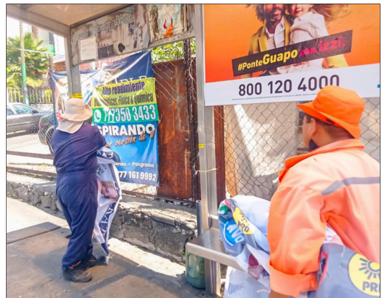
▲ El Ayuntamiento de Cuernavaca ha impuesto multas por propaganda que todavía no han sido pagadas.

Expuso que el reordenamiento es definitivo y de no poder llegar al mismo por la vía del diálogo, se tendrá que buscar el apoyo de la fuerza pública, pero las banquetas de la avenida Adolfo López Mateos deberán estar libres.