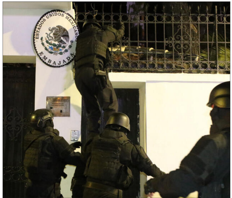
▲ El asalto a la embajada mexicana en Ecuador.

Las acciones de Ecuador son inaceptables. Por lo tanto, como mexicanos, expresamos nuestra solidaridad con las decisiones del gobierno mexicano de hacer que se cumpla las