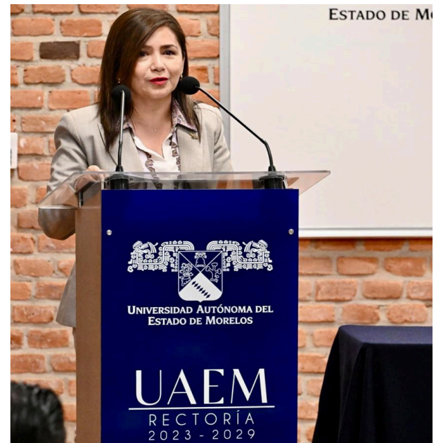
▲ La rectora anunció la iniciativa de certificar bajo el estándar de la Norma Mexicana en Igualdad Laboral y No Discriminación todas las actividades administrativas de la torre de rectoría.

Finalmente, la rectora afirmó: “La Universidad Autónoma del Estado de Morelos es un espacio abierto al diálogo y asume su compromiso en la construcción de una sociedad más justa, igualitaria y respetuosa de la dignidad humana”.