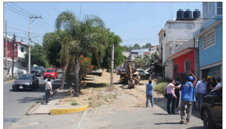
▲ Iniciaron los trabajos de rehabilitación de la segunda etapa de la calle Defensa Nacional en Cuernavaca que mejorará la conectividad en la zona norte de la ciudad.

Cabe mencionar la relevancia que tiene la calle Defensa Nacional al ser una de las principales vías de comunicación para llegar a la Universidad Autónoma del Estado de Morelos (UAEM), y colonias al norte de Cuernavaca, invirtiendo en esta segunda etapa un millón 669 mil 699.23 pesos proveniente de recursos municipales.