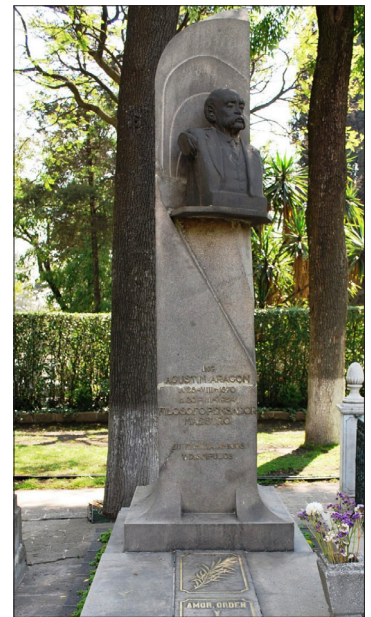
▲ Tumba de Aragón y León en la Rotonda de las Personas Ilustres.

El general Carlos Pacheco, héroe del 2 abril de 1867, fue originario de Chihuahua, pero es