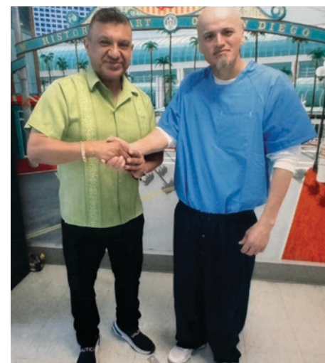
▲ Foto tomada el pasado domingo por un reo apodado el colombiano.