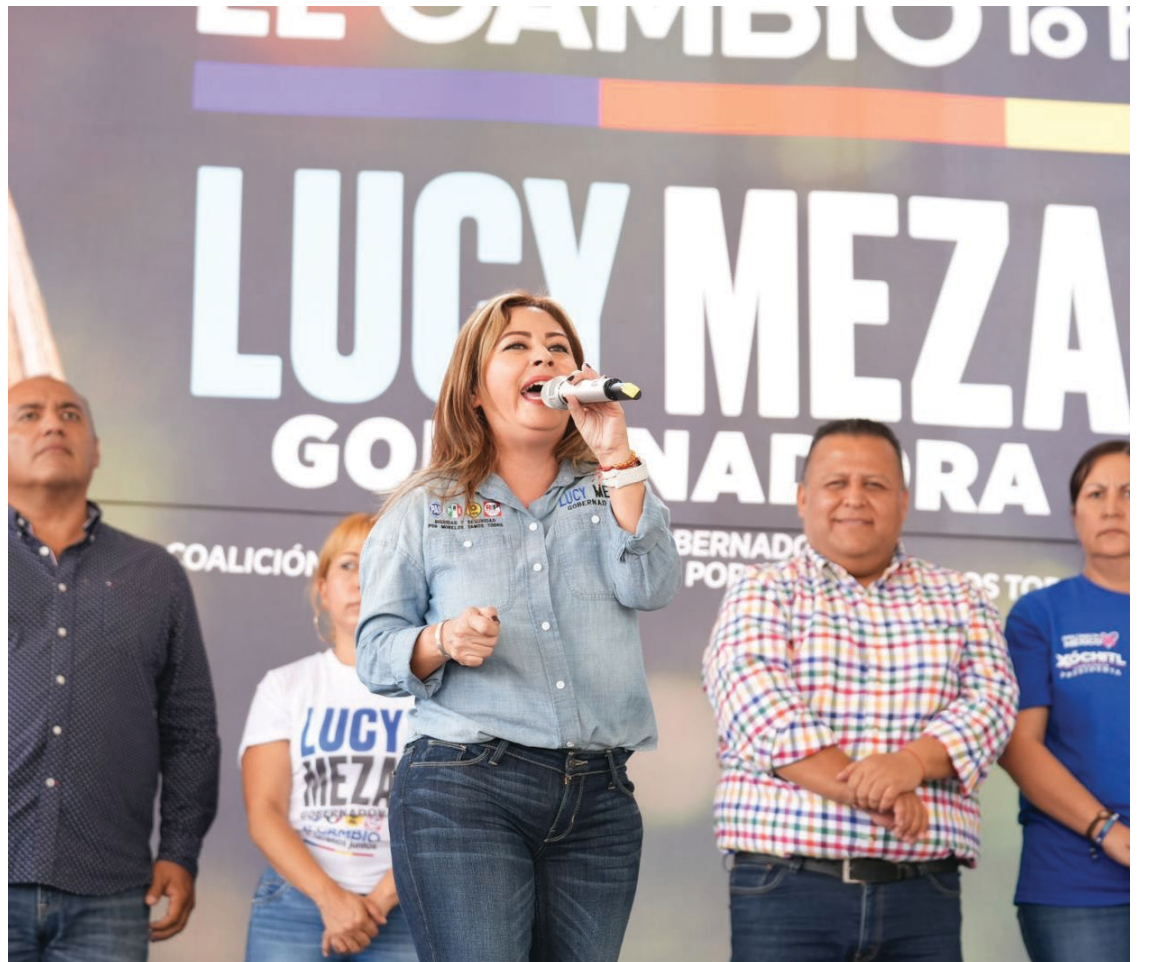
▲ En Jiutepec y Temixco se sumaron al movimiento por el rescate de Morelos que encabeza Lucy Meza.

Después de saludar a cada uno de los asistentes, la candidata del cambio hizo vibrar a mujeres, hombres y jóvenes, quienes se lanzaron a arropar y a respaldarla para llevarla al triunfo el próximo dos de junio.