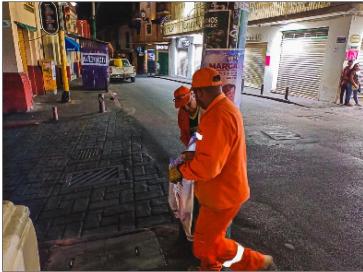
▲ Ante las constantes denuncias, el Ayuntamiento retiró papeletas, pendones y lonas de propaganda electoral que, de manera irregular y clandestina, se habían colocado en espacios no permitidos.

De acuerdo con Reglamento de Anuncios del Municipio de Cuernavaca: "Ningún particular, sin autorización del Ayuntamiento, puede fijar, pegar, adherir, colocar, instalar, o pintar anuncios en postes de electrificación y telefónicos, señalamientos de orientación, restrictivos, indicativos y de nomenclatura, protección para peatones, cubiertas para paraderos de microbuses, kioscos, módulos para venta de periódicos, cabi-