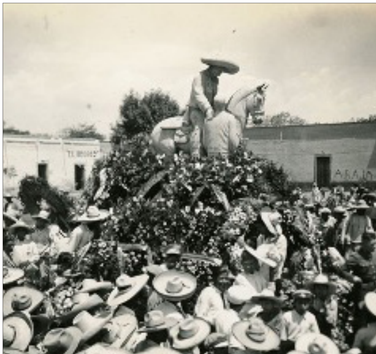
▲ Imagen: Estatua ecuestre de Emiliano Zapata Salazar (fragmento); Cuautla; ca. 1930.

espíritu enterrado bajo los miles de discursos que diluyen la íntima esencia de las comunidades surianas.