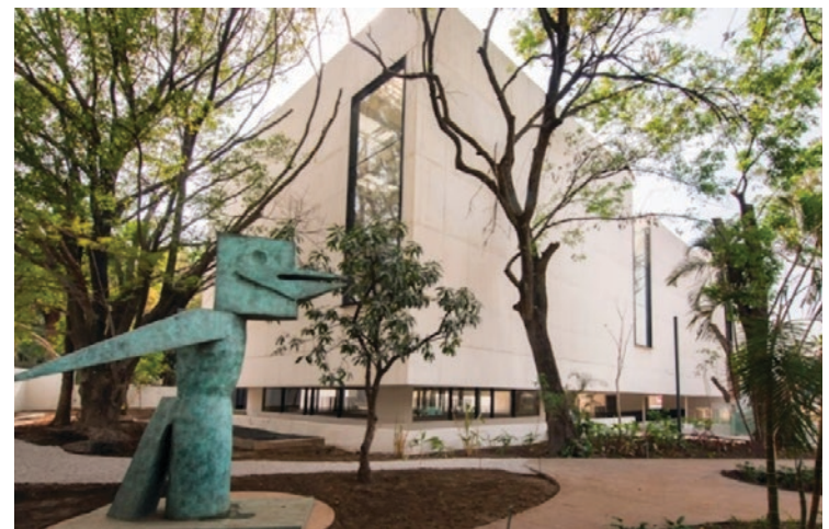
▲ Museo Juan Soriano.

Para quienes estén buscando opciones culturales este mes, estas exposiciones ofrecen una oportunidad interesante de disfrutar del arte contemporáneo en el MMAC Juan Soriano.