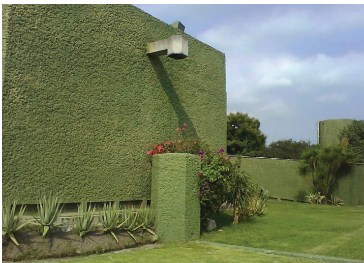
▲ Foto: Página de Escenarios del Museo Universitario de Ciencias y Arte de la UNAM.