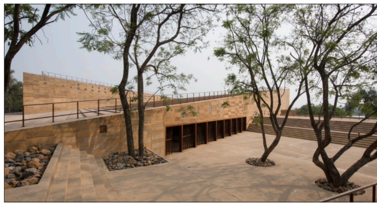
▲ Auditorio Teopanzolco.

El Auditorio Teopanzolco fue creado como un centro de reunión que era utilizado para todo tipo de actividades populares, conciertos, mítines políticos, ferias, exposiciones, así funcionó por décadas. Graco lo demolió para construir “una cosa muy bonita, pero totalmente inoperante para el pueblo. Con un problema de corrupción del tamaño del mundo porque hay sobreprecio, una obra asignada además directamente a uno de los constructores consentidos del gobierno de Graco Ramírez, muy cercano desde el Colegio Marymount a Rodrigo Gayosso (hijastro del exgobernador). La probable corrupción en esa obra provocó una pérdida a los morelenses que Gerardo Becerra calcula en unos cien millones de pesos.