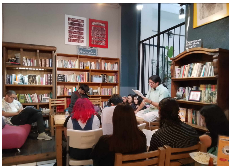
▲ Círculo de lectura.