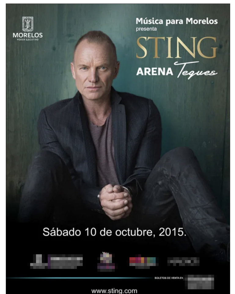
▲ El concierto en el que está comprometida la firma de Graco

“La declaración ya está lista hace algunas semanas y todo parece indicar que este tema de Sting en cualquier momento puede ser judicializado”, adelantó, y expuso “el único documento en que Graco cruzó la firma fue el de Sting... tiene que avanzar”.