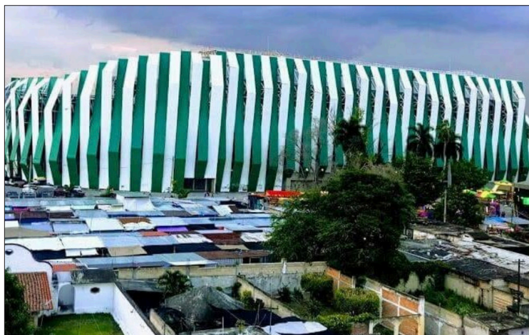
▲ Estadio Agustín Coruco Díaz