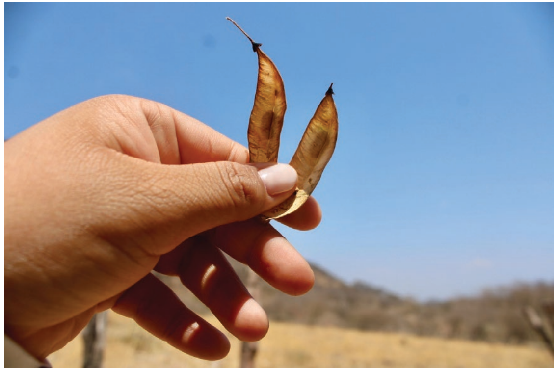
▲ El material recolectado también se utilizará para las tareas de reforestación.

Las personas interesadas pueden ingresar al micrositio www.sustentable.morelos.gob.mx donde podrán descargar el formato correspondiente, el cual, una vez llenado deberá ser impreso y entregado en la ventanilla única de trámites y servicios ubicada en Bajada de Chapultepec, número 25, en la colonia Chapultepec de Cuernavaca.