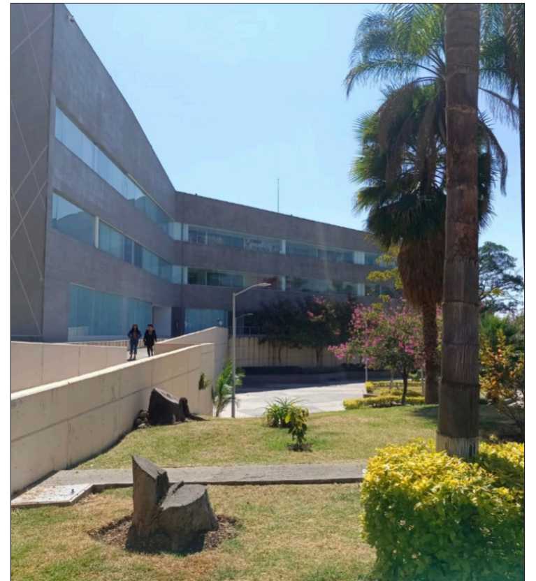
▲ Congreso del estado de Morelos

No todos los casos quedaron impunes, ante los tribunales han tenido que responder los exsecretarios de Turismo, Obras, Desarrollo Sustentable, Hacienda, el Tesorero del gobierno estatal, y otros funcionarios de menor rango, y responsables de fideicomisos, muchos de ellos amigos del exgobernador o de Rodrigo Gayosso, todos ellos por denuncias impulsadas por la oficina de Gerardo Becerra.