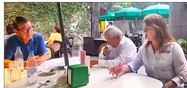
▲ El Patronato del CRI de Jojutla conserva la esperanza de que se mejore la situación para que haya más apoyo para quienes más lo necesitan, tras dos sexenios en que los han “hecho a un lado”.

Finalmente, Sánchez Mote, comentó que pese a ser una reunión muy rápida, tuvieron oportunidad de explicarle cómo han trabajado “que hemos aportado mucho en este centro y que el actual gobierno, como el anterior, no solo no ha trabajado con nosotros, si no que nos ha puesto trabas, nos ha sacado del mismo centro donde sesionábamos y no nos permite entrar ni por nuestras cosas”.