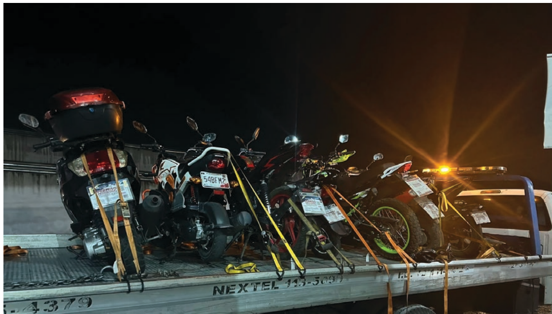
▲ Policía de Cuernavaca detuvo 51 unidades irregulares en la primera semana de abril y logró recuperar una motocicleta robada.