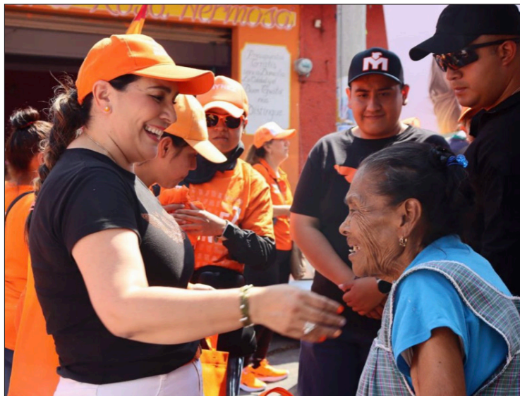
▲ La candidata propuso generar más oportunidades de emprendimiento para las mujeres retirando la burocracia que hoy entorpece su incorporación al desarrollo económico.

Además, explicó, se generarán más oportunidades de emprendi-