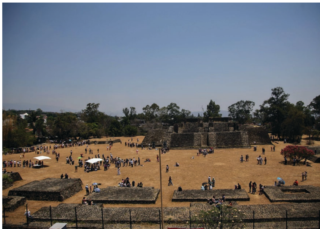
▲ Eclipse en Teopanzolco.

En contraste con el alto ausentismo de los alumnos, prácticamente el total de trabajadores docentes y administrativos del nivel básico (alrededor de 23 mil) se reincorporaron a sus actividades normales.