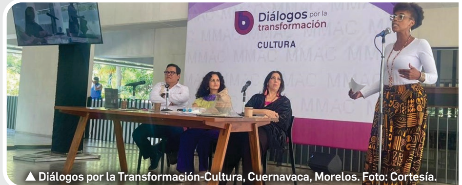
▲ Diálogos por la Transformación-Cultura, Cuernavaca, Morelos.

5.- Todo trabajo escénico profesional tiene que ser bien pagado y no demandado por autoridades estatales y sobre todo municipales que