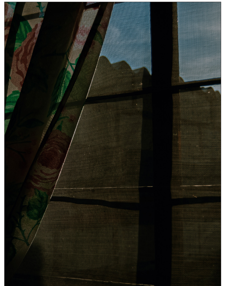
▲ Ventana de Mita.