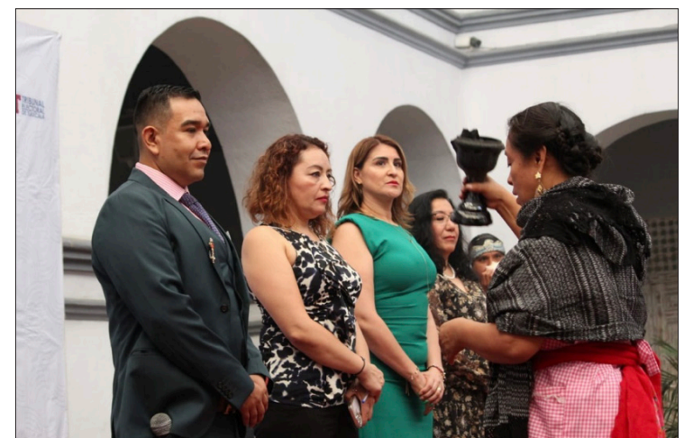
▲ El encuentro inició con una ceremonia tradicional para propiciar una reunión productiva con alternativas de solución para los múltiples problemas que enfrenta la sociedad actualmente.