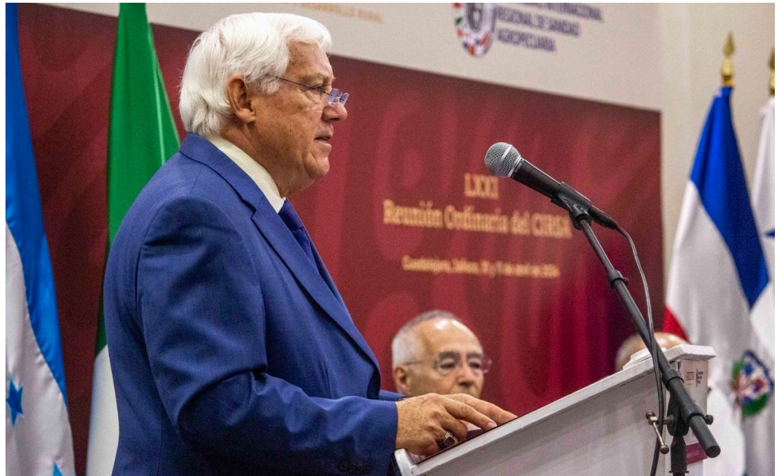
▲ El secretario de Agricultura y Desarrollo Rural, Víctor Villalobos Arámbula, llamó a los países de Centroamérica y el Caribe a fortalecer el trabajo coordinado para evitar la introducción y proliferación de plagas y enfermedades que atentan contra la seguridad alimentaria de los pueblos y dañan el ambiente y el libre comercio.

El reto, dijo, es producir cada vez más y mejores alimentos, a pesar de los desafíos que se enfrentan ante el cambio climático, como la escasez de agua y las temperaturas extremas.