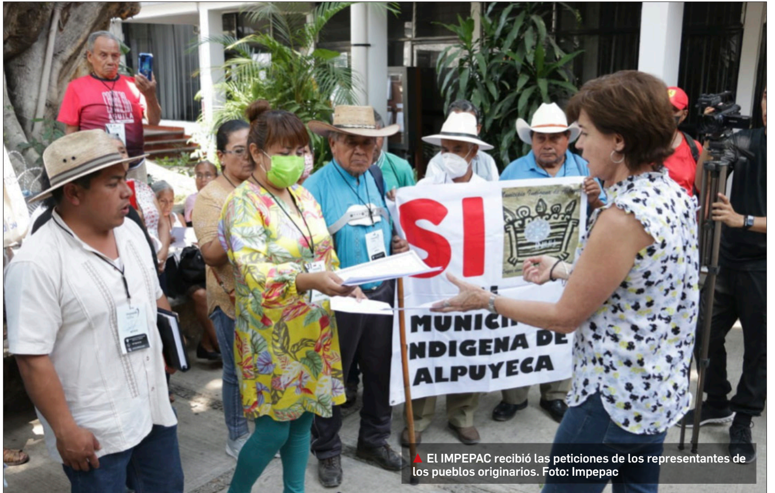
▲ El IMPEPAC recibió las peticiones de los representantes de los pueblos originarios.