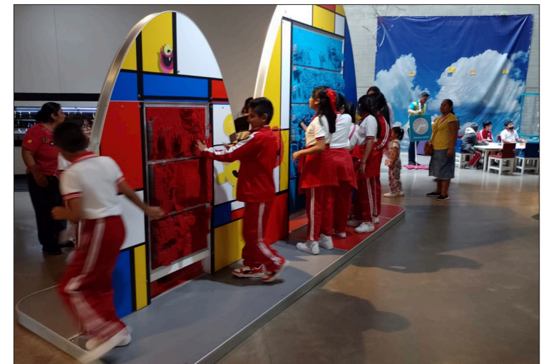
▲ Estudiantes de la escuela primaria "Santa Díaz Romano" acudieron a Papalote Museo del Niño Cuernavaca gracias al acuerdo de esta institución con el municipio de Jiutepec.