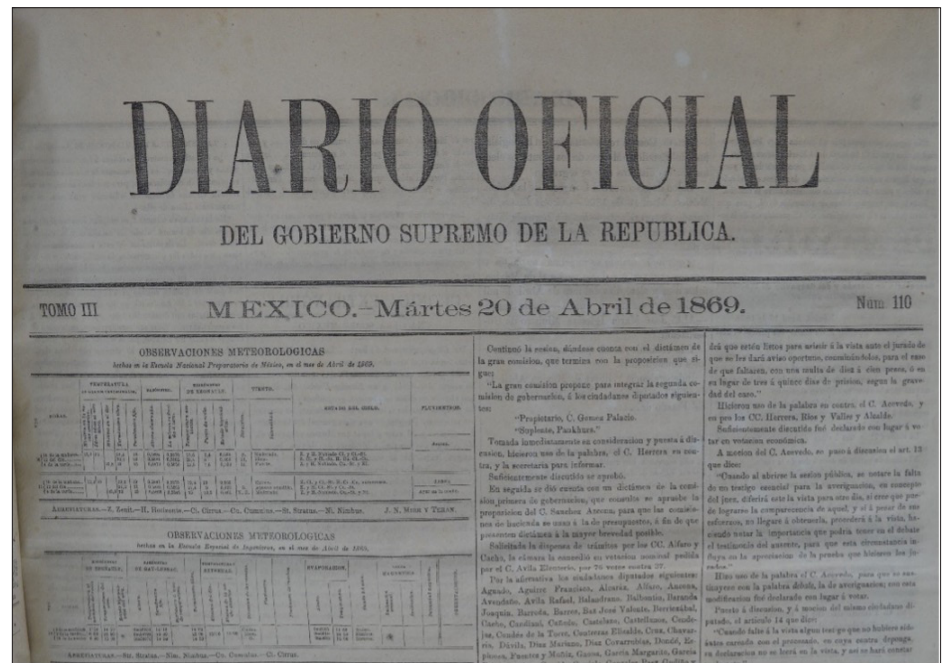
▲ Imagen: Diario Oficial del Gobierno Supremo de la República (fragmento); 20 de abril de 1869. Hemeroteca del Archivo General de la Nación.

Ciudad de México en caso necesario; y Morelos era un paso seguro para dirigirse a Acapulco. Igualmente, necesitaba de más congresos locales adictos a él para garantizar sus reelecciones. La Cámara de Diputados aprobó la creación de la entidad el 16 de abril, el presidente firmó el decreto el 17 de abril y fue publicado el 20 de abril de 1869. La conmemoración de la ignorancia.