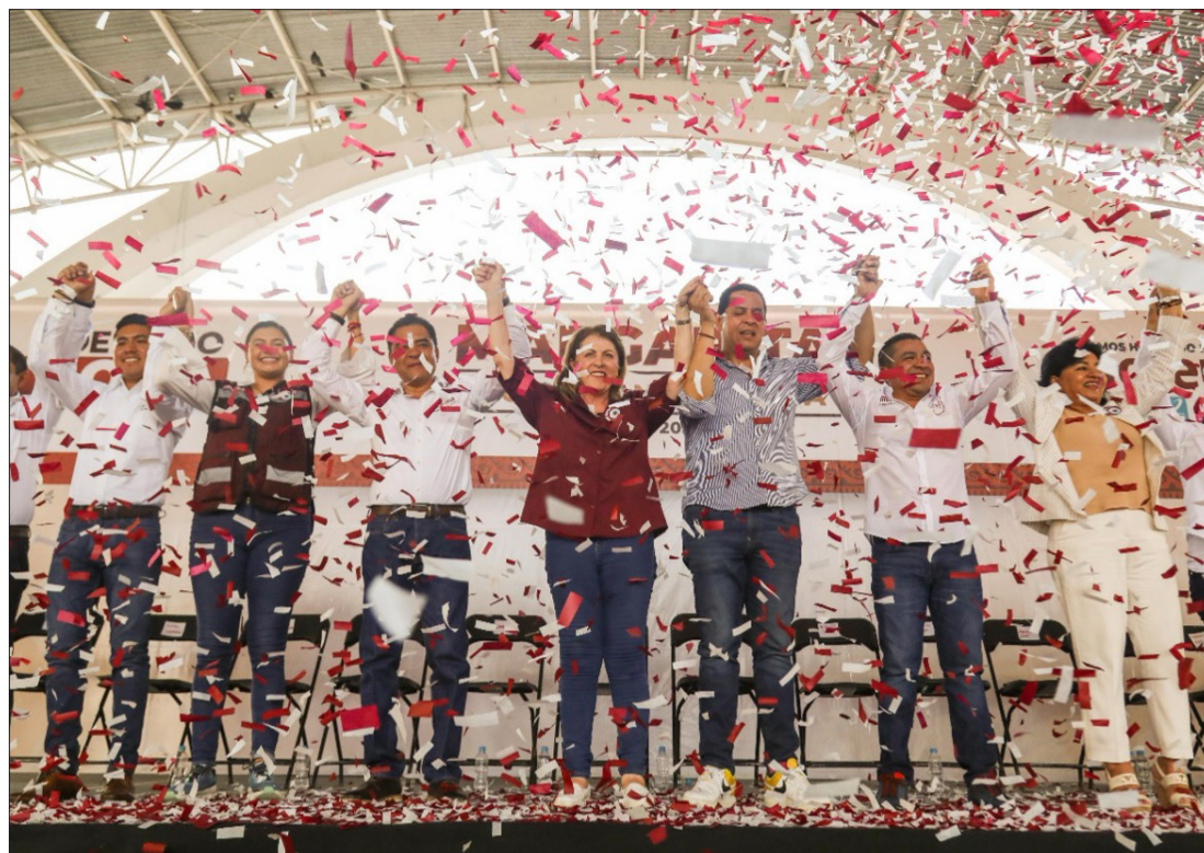
▲ La candidata a la gubernatura recibió el respaldo de habitantes de Tlaquiltenango en su gira por la zona sur de Morelos.