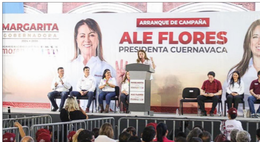
▲ En Cuernavaca, Margarita González Saravia acompañó a los candidatos a senadores, diputaciones federal y locales, y la alcaldía de Cuernavaca.

Finalmente, González Saravia culminó su discurso recordando que la guerra sucia que se ha emprendido para relacionarla con personajes de gobiernos anteriores ha sido un desgaste en dinero y recursos por el partido del frente, que no ha logrado buenos resultados, muestra de ello es que Morena sigue a la alza en las encuestas en Morelos, duplicando incluso su ventaja sobre la oposición: “Compañeras y compañeros de Tlaquiltenango necesitamos unirnos, hacer juntos la transformación de este municipio y del estado de Morelos, hay que votar el 2 de junio por Morena”.